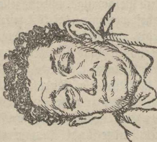
Sinowjew-Apfelbaum. Põlja-kommuna ja ill internatsionaall ildesaatwa komitee esimees.