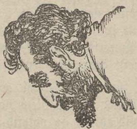
Martow-Zederbaum. End. keet-ildesaatwa nõefog. llige.

nimed oma lehte tulla. Jutustused, kuidas rikkaks saanud juudid waewa nägid, et nende nimed ilmuks weerus pealkirja all „Seltskonnast“ ja teda Bennett hiilgawalt tagasi löi, kuuluvad lõige kordalainumateks kogu ajakirjanduse-ilmas. Bennett jäi kangekaelseks. Sealjuures oli ta tart küllalt, et mitte