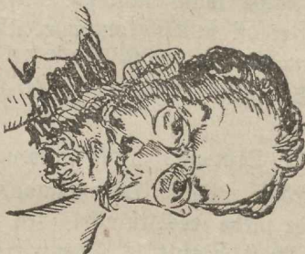
Adolf Joffe. End. N.-Wenemaa rahukonverentsi saadik, oli ka Tartu rahukonve- rensi; praegu saadik Tokios.