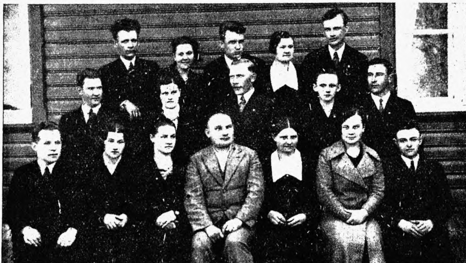
Halliku Maanoorte Ringi liikmeskond ja juhatus 1935. a.

Peame siis praegu panema käed rüppe ja ootama, mil meilgi tuleb tegutseda?