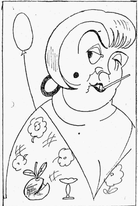
„Baaridaam“ paruness Haloy.

„Kui armuline proua soovib, võtame kõik endi peale ja teeme tarvilikud korraldused“. Ärijuht an-