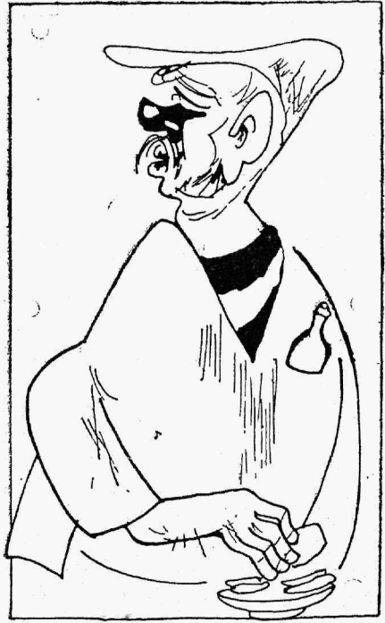
„Kutsumata külaline“ Tops.

käimisega. Nähtavasti ei suuda sissetulekud, mis kõlavama nimega restoraanist selle rentnikule tulevad, rahuldada rentnikuhärra nõudlikku pugu.