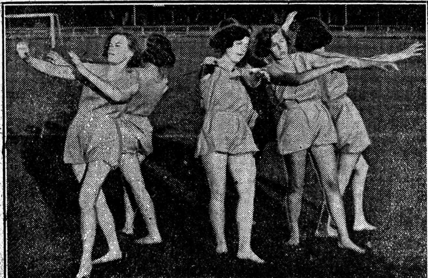
Rühm Soome neide võimelmistantsu ettekandel.

Lõigata välja ja saata „Spordilehe” toimetusele, Uus tän. 24 ehk postkast 70, kuni 29. augustini.