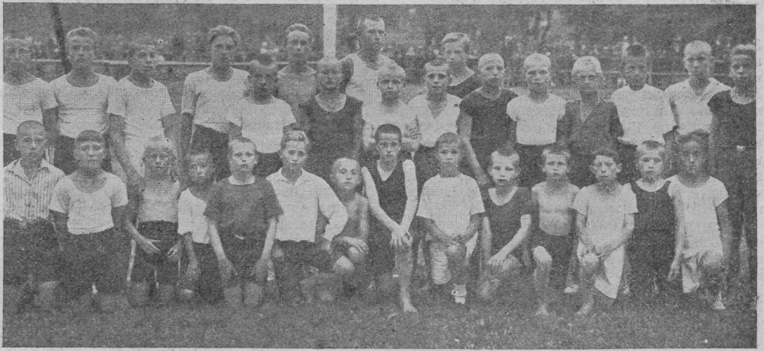
Staadioni noorte teatemeeskondade grupp Nurmi võistlusel.

Sellest Ekraveliidu otsusest on E. Sp. Keskkliit omad järeldused teinud — nimelt uue otsuse,