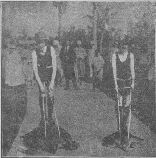
Originaalne võistlus Floridas Ameerika naisujujate vahel.