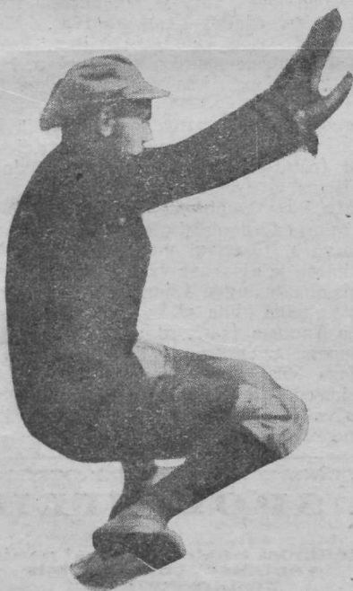
Ai-vai, aitab küll!

Hakoahi väravaht Judelovitsch Kalevipoegade pommirahe all.