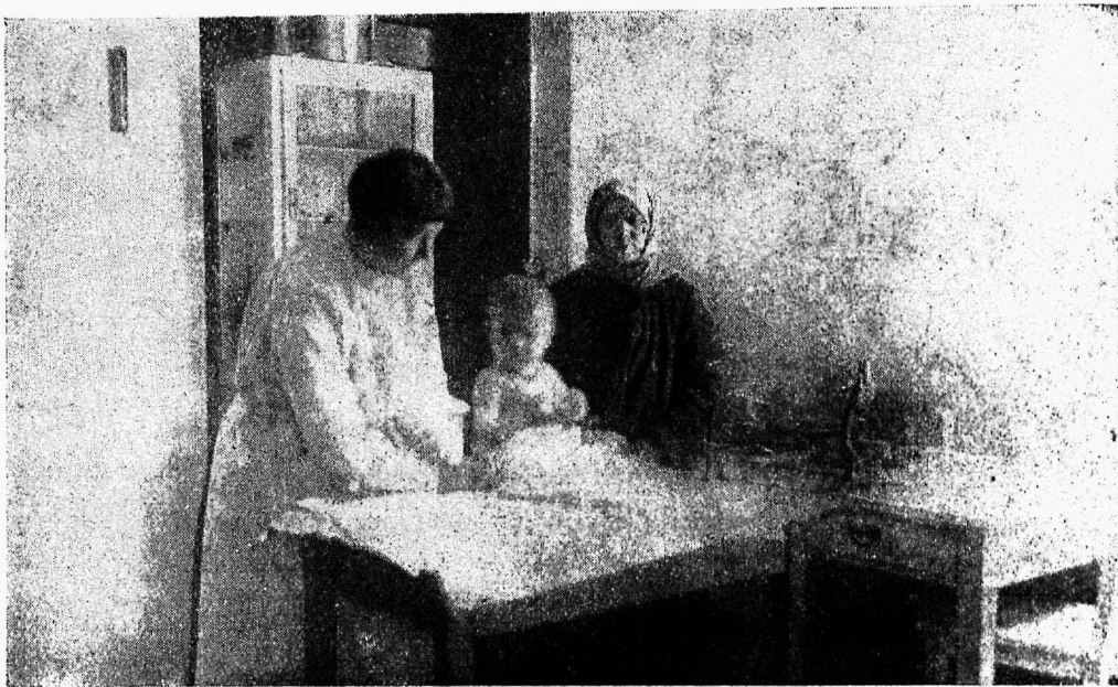
E. N. Liidu Petserimaa esimese laste ja emade nõuandepunkti arsti tuba.

Nõuandepunkti arstil tuleb sagedasti kuulda setu naistelt järgmist ütelist: „Küll om tu üits hüva asi, et võib tohtriga kõneleda oma keeles ja et ta om tulnu meid rumalaid siia õppama.“ Vii-