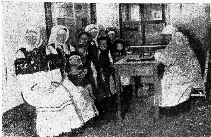
E. N. Liidu Petserimaa esimese laste ja emade nõuandepunkti ooteruum.

Eriti suur ebausik ja arusaamatus valitseb tervishoiu ja haiguste suhtes. Rahval pole aimu