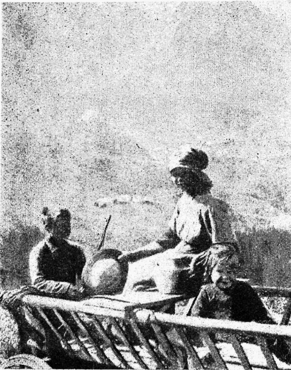
Hommikune heinamaale minek.

mistamine. Peab ütleva: schweitslane jõob lihtsalt. Gommikujöögiks on juust hapu veiniga, mis on harilikud Schweitzi talumiku toiduained. Võimaks on supid ja muud soojad jõogid. Weini (juhkrita) tarvitakse meie talja ajemel, mis viimasest ei ole parem. Schweitzi taluperenaise kutseharidus on taluperenaise kurjuste edendada. Viimased on enamuses põllumeeste talvekoollide juurde koondatud. Kui talvekooll aprilli keskpaigas tegemise lõpetab, algab perenaise kurjus, mis 6 kuud kestab. See on kurjus otse praktilise elu jaoks. Kuna Schweitziis sünduslik algharidus kuni 8 klassini ulatub, ja seega õpilased tubli eelharidusega, jõutakse selle lihtsese juurekursuse ajaga tarvitajad teadmised omandada perenaise kutsealal.