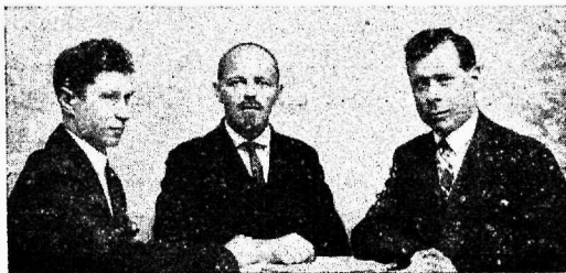
P. E. K. S. „Vaata” asutajad.

Samal aastal Tallinna Kurttummade Seltsi kutsel võeti saadikute läbi osa esimesest ülemaalisest kurttummade koosolekust, mis peeti ära Nõmme-Liival 13.