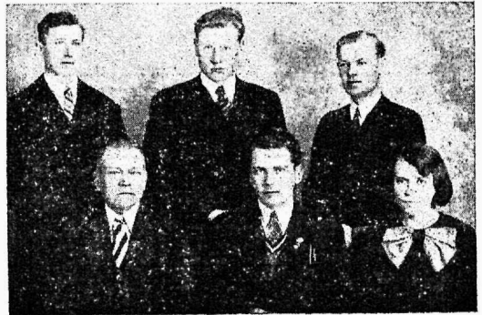
P. E. K. S. „Vaata“ praegune juhatuse.