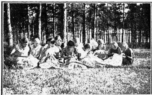
Eesti Lastesõprade Keila suvekolonii lapsed metsas käsitööl.

1933. a. algas tegevus 23. juunil ja lõpeb 22. augustil. Seega tegevuse kestvus 60 päeva. Suve jooksul on koloonias olnud 112 last. Selline rohke laste arv on tingitud sellest, et tä-