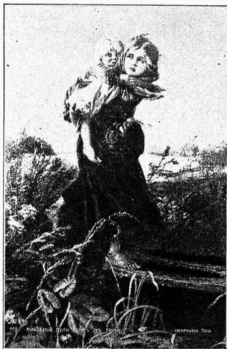
Lapsed põgenemas äikese eest.

Prantsusmaa oleks ainus „väljasurev“ maa — on isegi maid, kus sündivus on vähem kui Prantsusmaal. Nii oli elusalt sündinuid 1931. aastal iga tuhande elaniku kohta Prantsusmaal 17,4, Eestis 17,4, Saksas 16,0, Šveitsis ja Norras 16,7, Rootsis 14,8, Inglismaal 15,8.