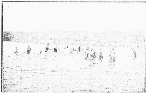
Eesti Lastesõprade Ühingu Keila suvekolonii lapsed suplemas.

Koloonia taotleb kaht eesmärki: 1) anda võimalust lastel kosuda. Tallinna hoolek. osak. kontrollandmetel jääb igal aastal kaugelt üle 1.500 koolialise lapse kolooniasse