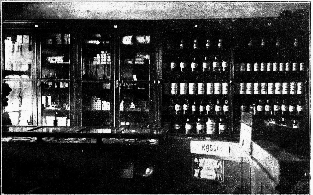
Narwa Üldhaigekassa apteek. Wabamütigi jaoskond.

Ka siin juhib tööbörsi nõukogu, kes wallitakse töölise ja tööandjate esitajaist, kuid tema tegewus ja wõimupiirid on wäiksed. Ta ajab ainult jookswaid asju. Meie tööbörside nõukogud tuleksid walida wõrdsel arwul töölise ja tööandjate esitajaist, kuid siin