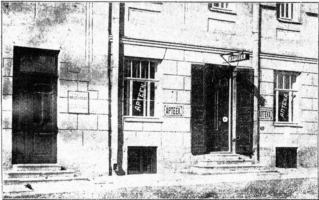
Narwa Üldhaigekassa apteek. Esikülg tänawalt.

Esimene töbörs Wenemaal asutati 1913. a. Ta tegewus arenes kiirelt, nii et varsti asutati Peterburi südalinna keskbörs, just tööjõu nõudmiste vastuvõtmiseks. Erakohakuulamise kontoritest olid mõned väga eeskujulikud. Tööotsija, kellelt kohasaamise korral esimese kuu palgast teatud protsent wõeti, wõis kohasaamise ajal kontori sellekohases ruumis elada, kus ka temale üles-