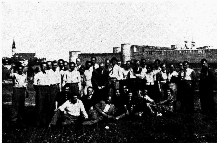
Tööliskoja ühistegevusekursioon Narvas.

SISU: 1) Tööliskoja valimised tulemas. 2) Töölisvanemate ja kutseühingute ühisnimekiri Tööliskoja valimistel. 3) A. Offenbach: 25. rahvusvaheline töökonverents. 4) I. R.: Töövõtjate kutseühingute normaalpõhikirjad. 5) Rahvusvahelise Kutseühingute Liidu kongress. 6) Kutseühingute esindajate nõupidamine. 7) Ülevaade Tööliskoja tegevusest. 8) Välismaalt. 9) Ühistegevusnurd. 10) Käitiste elu. 11) Mitmesugust.