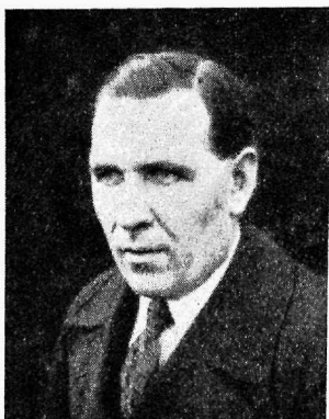
Koja liige V. Ado,

tuse ala. Selle töö halva korralduse juures tekivad tihtipeale suuremad vaheajad, kus kõik töölised vallandatakse tööpuudusel. Selles olukorras on tööstureil võimalik mängida tööliste saatusega. Eriti on madalaks kistud palgad. Kui aga töölisvanema tege-