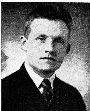
Koja liige Ed. Saar,

töölisliikumisele. Autoriteetseks kohtunikuks ja otsustajaks sel alal on vaid käesoleva konverents. Seepärast kõneleja teeb ettepaneku konverentsi poolt valida 15-liikmeline töölisvanemate-kutseühinglaste segatoimkond, esitades omalt poolt vastavad kandidaadid.