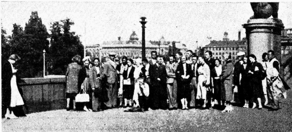
E. A. Koja ekskursionist osavõtjad Stokholmis

jatud soovi — võimaluse korral jälle varsti tagasi tulla. Õppevõimalused ametnikkude ellu puutuv osas kasutati ära täiel määral. Kutseühingute tegelased tutvusid ametnikkude organisatsioonidega, nende sisemise korra ja asjaajamisega. Loodi väärtuslikke tutvusi Daco, Industrijänstemanna Förbundet, Handelsarbetareförbundet, Kontors- och Handelsanställdas Förening'i ning teiste kutseühingute tegelastega. HSB — ühiselamute kvartal Kungsklippanis — 13 maja 1000 perekonnaga pälvis osutatud tähelepanu. Ametnikkude elukorterid — milledes on äärmine puhtus, moodsaimad ehitusnõuded silmas peetud, on ehitatud siiski niivõrd ökonoomselt, et osutuvad ka Rootsi oludes väga odavateks, eriti arvestades seda, et üüri tasumisega amortiseerub korter ning saab valdaja omanduseks 20 aasta jooksul.