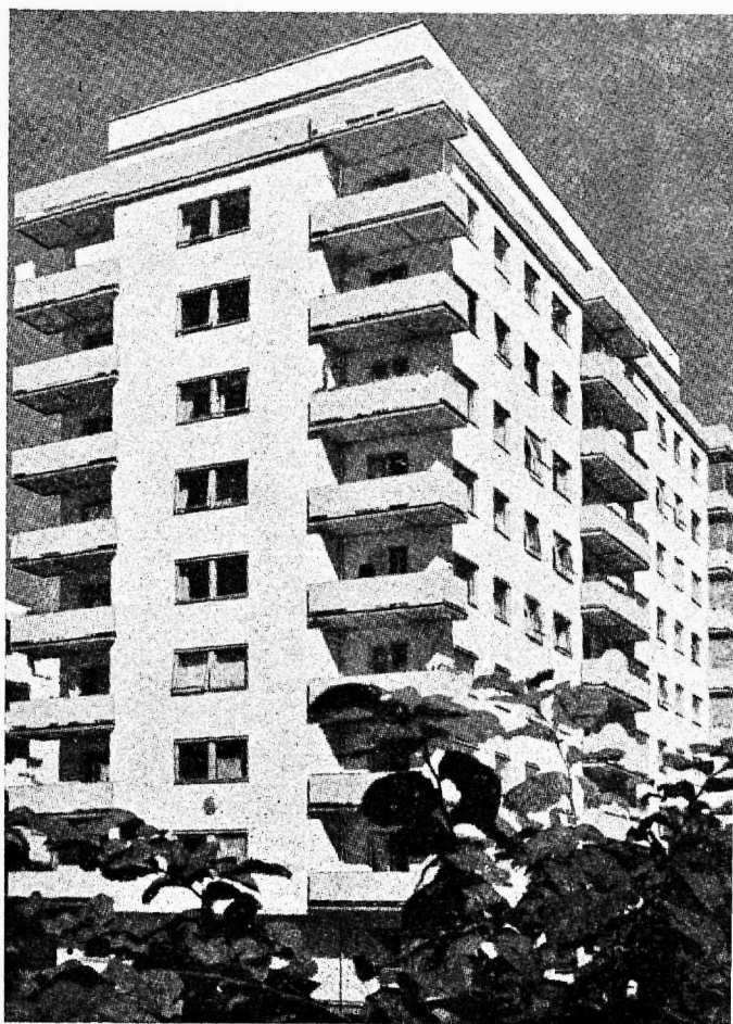
Eraametnike ühiselamu Stokholmis — Kungsklippanil.

Mis puutub väljaminekutesse ametniku hüdsetis, siis on siin võrdlemisi raske tõmata paralleele näiteks meie ning Rootsi ametniku vahel, kuna olud on liiga erinevad. Paiguti on kulud hädavajaliste väljaminekute osas Rootsis väga suured, näiteks tuleks Stokholmi ühe 300 kr. kuu tuluga ametnikul