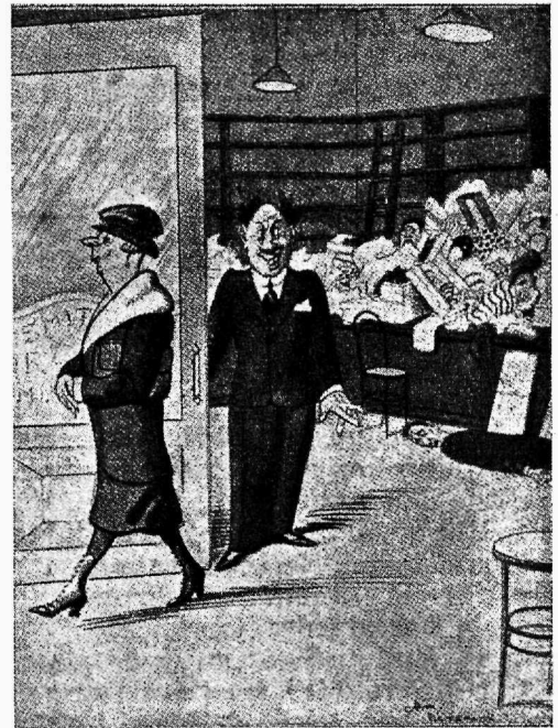
Müüja ostjale: Palume meid ka edaspidi lahkelt külastada

Kutseühingu energiline tegutsemine aitas seada jalule seaduse nõuded ja äriametnikkonna õiguseid.