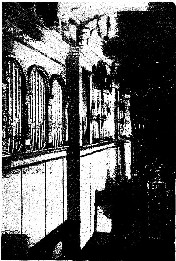
Rakvere kiriku uue oreli prospekt.

Juba enne sõda, äratundes, et Rakvere kiriku orel enam nõuetele ei vasta, asutasid mõned muusikaharrastajad koguduse liikmed kapitali uue oreli muretsemiseks; kuid raha kaotas oma väärtuse ja nii tuli oreli ehitamisega peale sõda uuesti algust teha.