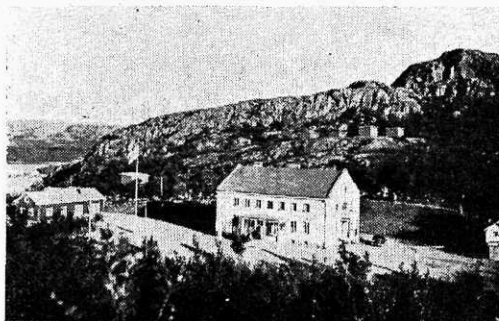
Liinahamari hotell Petsamos. Tagafoonil kalju- mäed turistide majakestega. Vasakul Põhja-Jää- meri ja bensiinijaam.

pole aga võimalik jälgida üheski kultuur- riigis. Kui sellele vaatepildile lisandada valguse ja pimeduse võitlus, kus päike näda-