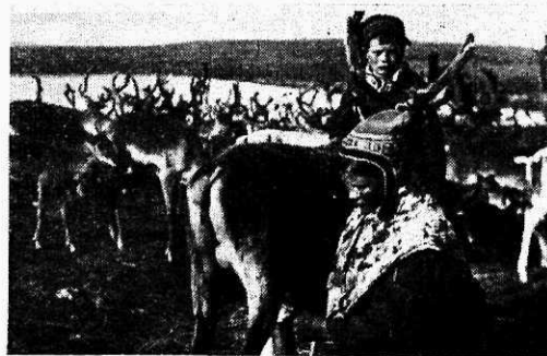
Lapi naine põtra lüpsmas.

Vaevalt jõuan autost välja astuda, kui selgub, et on kadunud kõik elanikud, kes viivu eest askeldasid elamute ümber.