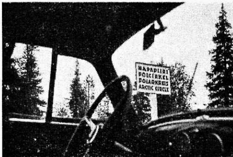
Nabapiiri tulp läbi autoakna vaadatuna.

kuigi vahest mitte enam nii lopsakas kui lõunas, kuid puud ei millegi poolest erinevad. Piirijoon, mis on vaid mõtteliselt kujutletav, on siin aga ometi nii mitmelegi olnud ööbimiskohaks. Telgiasemed ja tulekohad annavad sellest selget tunnistust.