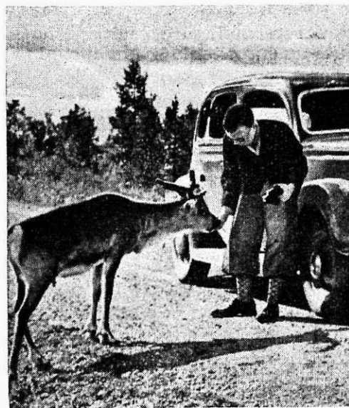
Noor põder Petsamo teel võtab isuga eesti leiba.

„Napapiiri“ — polaarpiirkonna algus asub 8-nda kilomeetriposti kohal Rovaniemist. Kõrgel puutulbal on kinnita-