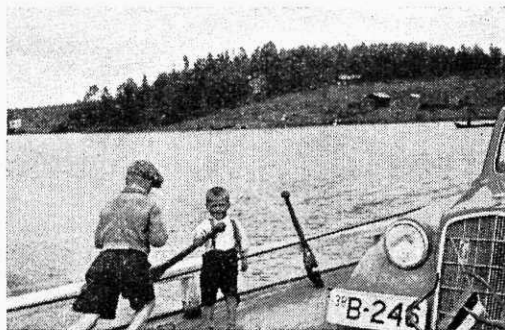
Alaealised poisikesed autot üle laia jõe parvetamas.

Erilise mälestuse Põhjamaa külastajale jätab ikka ja igal pool esinev graniit, mis kohati on kaetud samblakorraga ja palistab maanteid sadade kilomeetrite ulatuses.