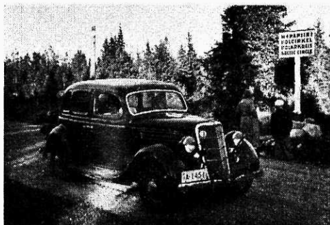
Nabapiirist möödasõitjad piiritulpa vaatamas.

Kuigi nabapiir ei evi midagi magnetilist, tundub ometi, et mingi kodune ning ühine