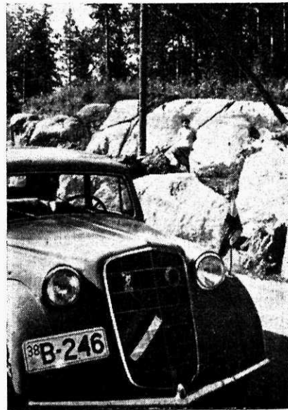
Maantee, mida sadu kilomeetrit palistab graniit,

on Soomes iga matkaja huviobjektiks. Vaevalt on lõppenud üks, kui algab teine vete-koogu, mis palistatud siksakiliselt metsa või kaljuseinaga. Ärvult on järvi Soomes üle 40 000, kusjuures paljud neist on üksteisega ühendatud ja leiavad nii veeteena rohkesti kasutamist. Autotee lookleb kohati mööda mäeseljaku, kus kahel pool teed silm lihtsalt värsib jälgimast järvekogusid. Mäeseljaku moodustavad kivise moreeni, kus kohati liiva- ja kruusakuhjatised, mis on kaetud männi- ja lehtpuumetsaga. Kusagil ei kasva need puud nii kõrgeks kui põhjamaal. Kuigi