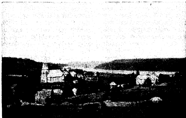
Tüüpilisi külamaastikke Viiburi Osak. kodu-uurimistöö piirkonnast.

Hiljem viidi need esemed üliõpilas-osakundade poolt asutatud etnograafilisse muuseumi, mis aastal 1893 loovutati riigile. Sellel osakundade omal muuseumil on olnud võrratult suur tähendus Soome rahvusliku kultuuri asitõendiste päästmisel. Pääle selle hakati üles tähendada rahvaluulet, rahvauskumusi; laule ja viise. Ja aasta aastalt Soome üliõpilaste huvi selle tähtsa aate vastu kasvab ja laieneb. Aga nagu juba võib arvata, on siiski osakundade kodu-uurimustöö ebaühtlane ja tulemuste poolest võrdlemisi mitmekesine, sest üliõpilased ei püsi kaua ülikoolilinnas ega juhatavaid jõude ole aina saadaval. Majanduslik kitsikus ja seesmised rahunused mõjuvad samuti kaunis palju selletaolise töö käikule. Viimastel aastatel aga on kodu-uurimustöö järele olnud