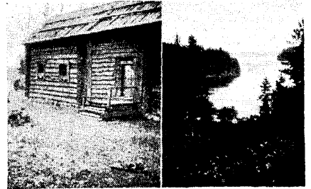
Viiburi Osak. etnograafiline muuseum.

Töötamine niisugusel suvisel retkel on väga huvitav ja mõnus. Peagi saadakse rahvaga