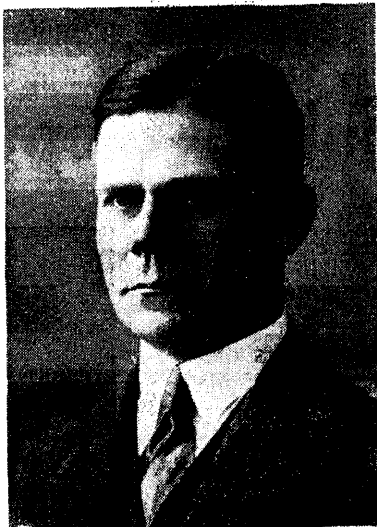
Dr. phil. HANS KRUIUS, eesti ja põhjamaade ajaloo korraline professor.

Valitud sama aasta kevadel sots.-revoluts. rühmas Asutavasse Kogusse, andus H. Kruus täiesti poliitilisele tegevusele. Sots.-revoluts. partei liidrina äratas ta Asutavas Kogus suurt tähelepanu oma ajaloolise kõnega landesvehri sõja algupäevil.