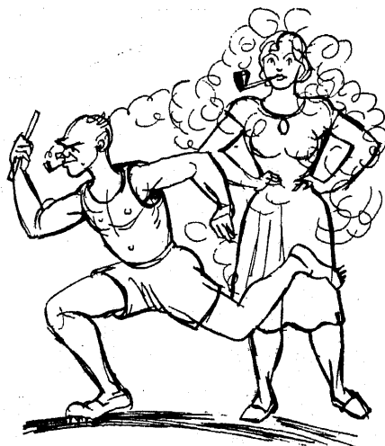
3) Arstiteaduskonna tudengid.

nud tõntsiks nende nägemine ja paljud nende seast on olnud sunnitud tarvitusele võtma prille. Üldjoontes meenutab filosoofi välimus teo-