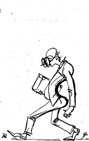
1) Usuteaduskonna tudengid.