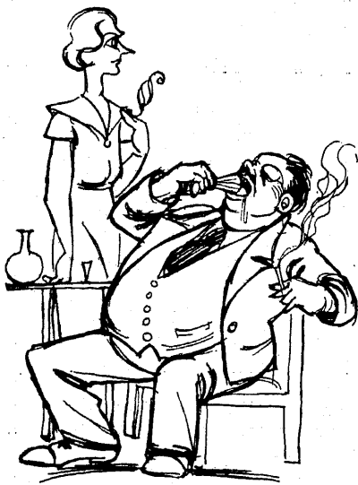
2) Õigusteaduskonna tudengid.