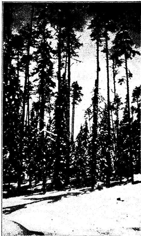
Mets talvel.

Vist kõige otstarbekohasem oleks esi- mene moodus, ei nõua ju see ei lisaku- lused ega midagi. Kui suutsid metsni- kud tänini kõiki vahtkondi järele vaa- data, siis suudavad nad seda teha aju- tiselt veel paari kuu jooksul, seda roh- kem, et nende koosseisu pole märgata- valt vähendatud pärast seda, kui abi- metsaülemad hakkasid nende kohuseid täitma mõnes vahtkonnas. Kui jäävad jõusse praegu maksvad korraldused, siis jääb tulevikus kultuuride järelevalve peaasjaliselt metsavahi ja metsniku hooleks, ja kas see meie kasvavale met- sale tuluks tuleb, näitab tulevik.