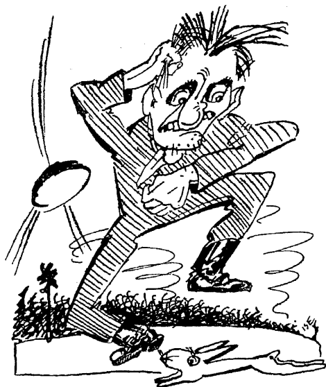
Salakütt. Ükskõik, kellel jänes ninaalt läbi jookseb, siis kui tal püssi kaasas pole.

Parimaks püssiraua materjaaliks on hea teras, vastupidav, painduv ja sitke.