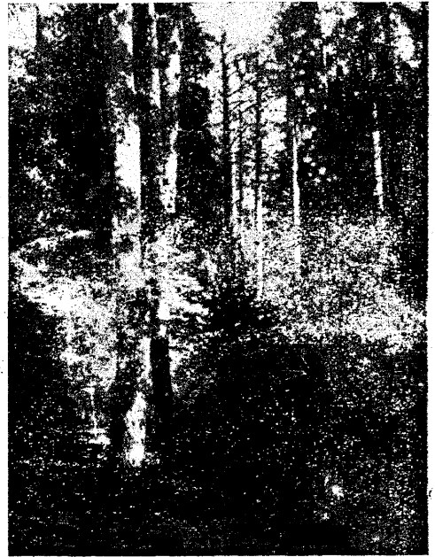
Haavad pesana männimetsas. Lagenõmme vk.

Mis puutub tamme enamusega puiestikkudesse, siis leidub neid vähe. Viidu vahtkonnas esineb tamm puhtpuiestikuna, kuigi mitte suurel pinnal. Puiestiku laius on 0,6, kõrgus 13 m, diam. 22 sm, vanadus 80 a. Järeikasv puudub,