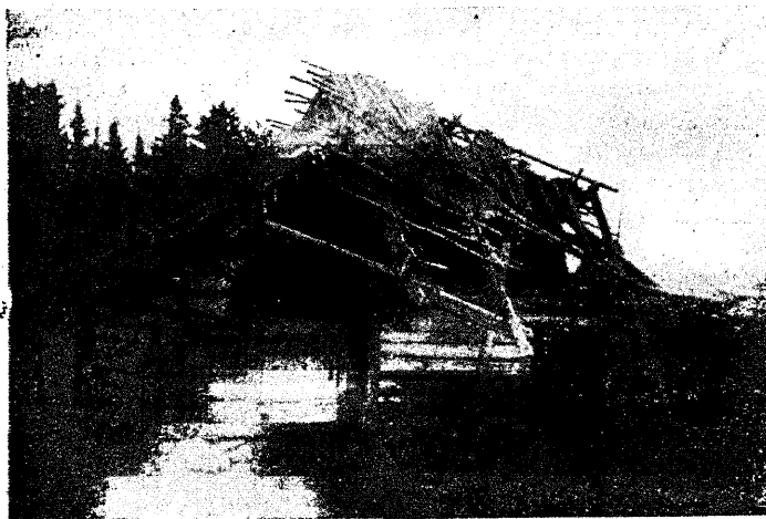
Varangu metskoona Aomänniku vahtkonna metsavahi loomalaud. Külmal ajal on metsavaht hobuse ja lehmad rehetuppa asetanud ise perekonnaga elab sama maja väikeses kambri.

Kolmas riigikogu töötas kokkuhoiu tähe all, kuid üheks suuremaks abinõuks oli riigiteenijate arvu vähendamise kaudu palga krediidi piiramine. Kui siis riigiteenijad sellele vastu astusid ja näitasid, et pliiatsit kätte võttes ei saa ametnik-