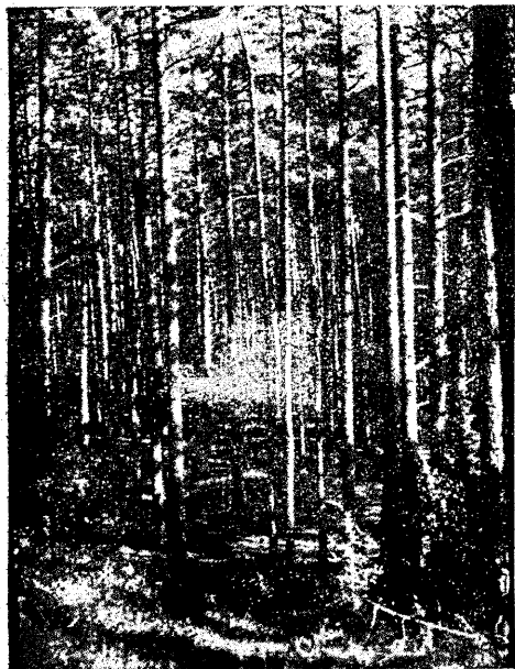
Männik värskel savikal liivamaal Viidu vk.

on kuni 16—18 m läbimõõt 25 sm; vana metsa all järelkasv puudub. Taimühing näitab nende puiestikkude kuuluvust Calluna tüübisse.