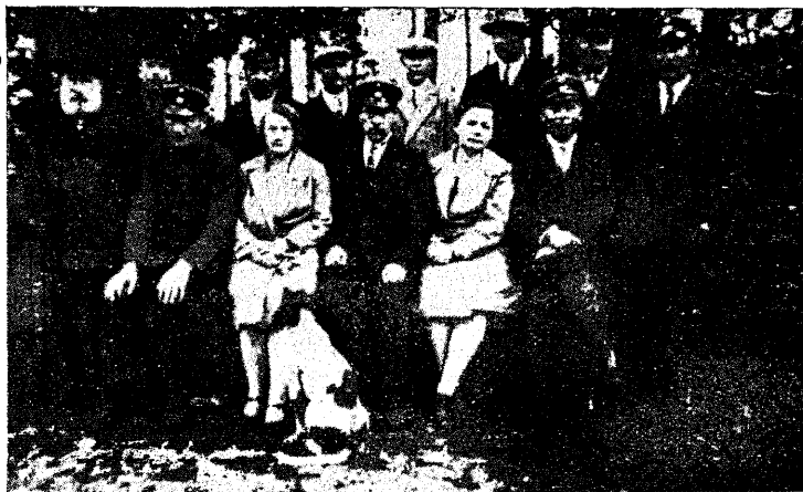
E. M. Ü. Rummu osakond.

sul väljaminekuid: Keskjuhatusesele kr. 34,48, kantselei- ja postikuludeks kr. 6,40, raamatuid ostetud kr. 10, kongressisaadiku kuludeks kr. 57, 1929. a. metsapäeva korraldamise kuludeks kr. 17,55, kokku kr. 125,43, saldo kassas kr. 5,27. Läbirääkimistel otsustati 1930. a. metsapäeva korraldamise puhul rohkem vaimliselt kaasa aidata heaks kordaminekuks. „Eesti Metsa“ tel-