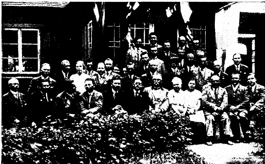
Õppereislased Roela metsaülemia juures.