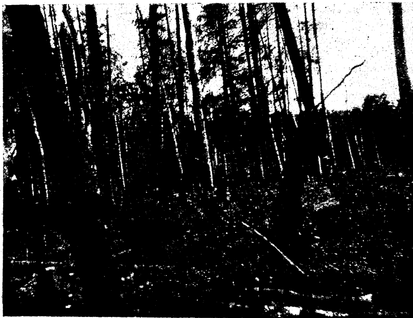
Tuulemurd Vastemõisa metskonna, Vastemõisa metsandiku kvartal nr. 191 peal (1926. a.). Vaade põhja poolt.

3) püüe, et mets annaks võimalikult ruttu suurt sissetulekut (siin räägitakse mitte ainult erakorralistest lanki-