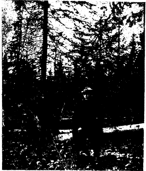
Tuulemurd Loodi metskonna, Loodi metsandiku (kvartal Nr. 9 peal (1925. a.). Vaade lõuna poolt.

Ülesvõtte kujutab kv. nr. 9-da tuulemurdu: tuulemurrust lõunapoole on raiestik.