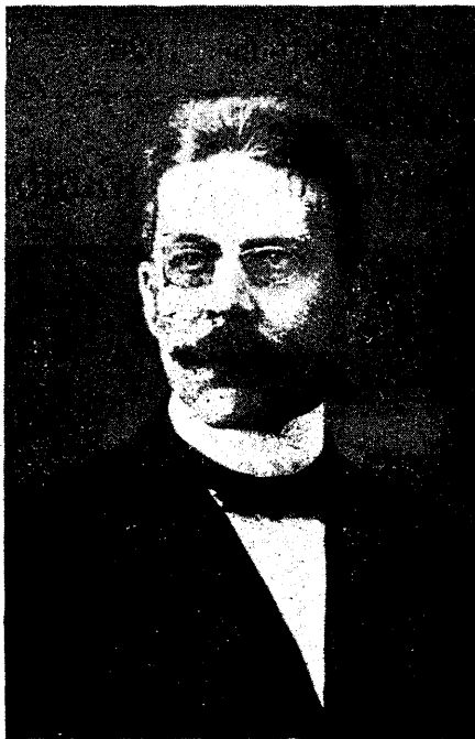
Prof. A. K. Cajander,

Kuid minule paistab, et siin tõesti mõlemad pooled asjast huvitud võivad olla. Soome on kiirel käigul edusammusi teinud üldmetsaaduse, metsakasvukoha tingimuste uurimisel. Tüüpide teooria ja selle järeldused on asjad, mis kogu ilma metsaaduses uusi laineid ja voolusi löönud on. Kuid