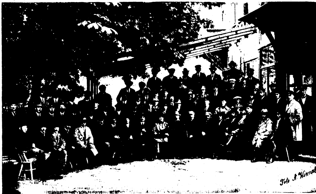
Tallinnas 9. ja 10. septembril 1923 a. Kadriorus „Atvaariumis“.