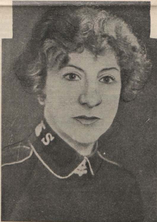
Evangeline BOOTH, Päästearmee uus kindral.