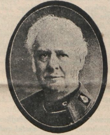
Bramwell Booth, Päästearmee teine kindral.