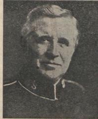
Edward J. Higgins, Päästearmee praegune kindral.