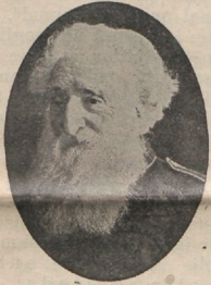
William Booth, Päästearmee asutaja ja esimene kindral.