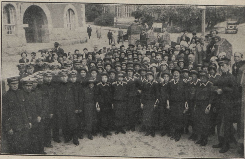
Eesti seitsilised Helsingis.