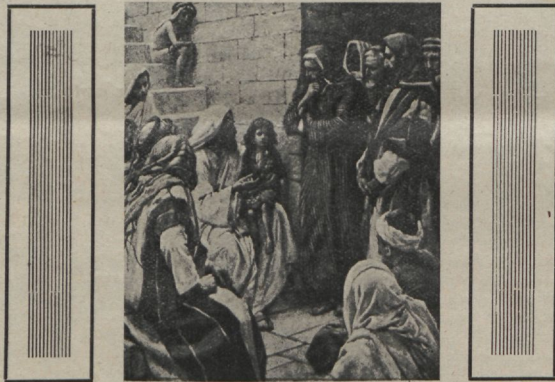
Jeesus õpetab oma jängreid.