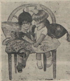
„Kui meie kord prooviksimme tõrvaseepiga.“

Heledate ja tumedate juuste kiisim muutus suurimaks probleemiks minu elus. Ma ei võinud mõista, miks mu sõbrataril olid heledad juuksed ja mul tumedad, emal hele-