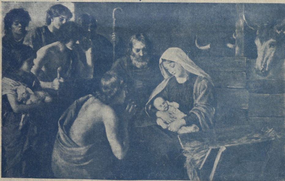
Esimene Jõuluöö Petlemmas.

ja neid kuulas väike hulgake hommikumaa karjaseid, kes kunagi varemalt põlnud läbi elanud sellist ilmutust! Pole ime, kui karjased said rahutuks ja et kartus selle ime nägemisel täitis nende südameid. Milline üllatus pidi see küll olema, kui neile öeldi selle ilmutuse põhjust, ja