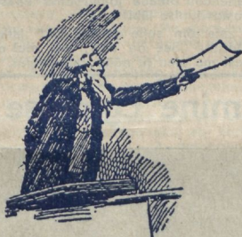
Asutaja William Booth kõnelemas.

Laske see olla päästmise jõulu teile endale. Teil oli jõulu, kui Jeesus Kristus tuli teie hinge, aastaid, kuusid ja võib olla ka ainult mõni päev tagasi. Ja Ta elab sääl tänapäev. Aga Tema päästmistöö ei ole veel lõpetatud. Ta tuli päästma sind su pattudest. Mitte päästma möödunud pattudest, vaid praegustest. Kas võime teha veel midagi paremat sellel jõulul, tervitada Teda meie südamesse ja lasta Teda täita meis kõik Ta püha tahtmist?