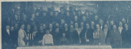
Koduühingu jõulupühad Tallinnas.

Oh, kui ma ometi selle lehe läbi saaksin sinu südame juure ja võiksin näidata sulle, et sa tõeliselt polegi üksinda. Vaimus oleme sulle lähedal, ja võitleme ning usume sinu