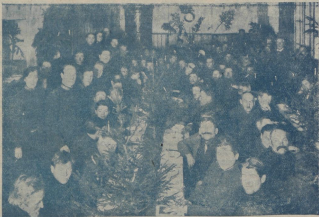
Päästearmees jõulupühad õõmajas Riias.

Komandör Evangeline Booth A. Ü. R. sõitis Jaapani, et juhata da kohalisk kongressi. Komandöri võeti Jaapanis väga südamlilikult vastu. Sisse sõites Tokio linna, raudtee jaamas ootas teda põhjatu suur rahvahulk. Teda tervitama oli ka tulnud Tokio kuberner. Jaapani keiser võttis komandöri audientsile. Siamaale Jaapani keisri lossis ei teata juhtumist, et oleks naissoost isik vastu võetud. Komandör ilmus oma Armees univormis ja teda esitati kui inimsugu teeniva militäärse organisatsiooni ohvitseri.