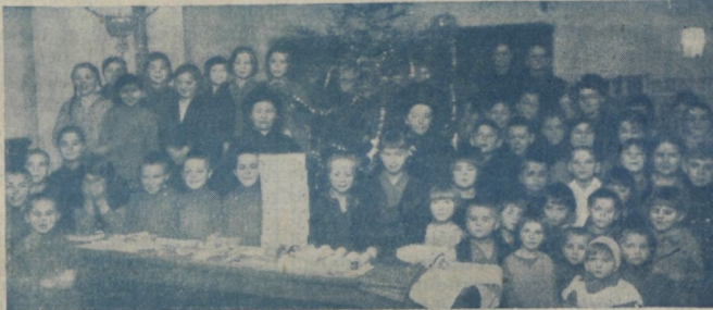
Laste jõulupühad Riias, laste abiandmise punktis.

Targad hommikumaalet jälgisid tähte, ka siis, kui see imelisel kombel jäi seisma ühe lauda kohal. Võib küll mõelda, et nemand vahelduvalt vaatlesid tähte, lauta ja teineteist. Kuid kõigest hoolimata — kui nad nägid tähte, olid nad rõõmsad, kuigi täht jäi seisma!