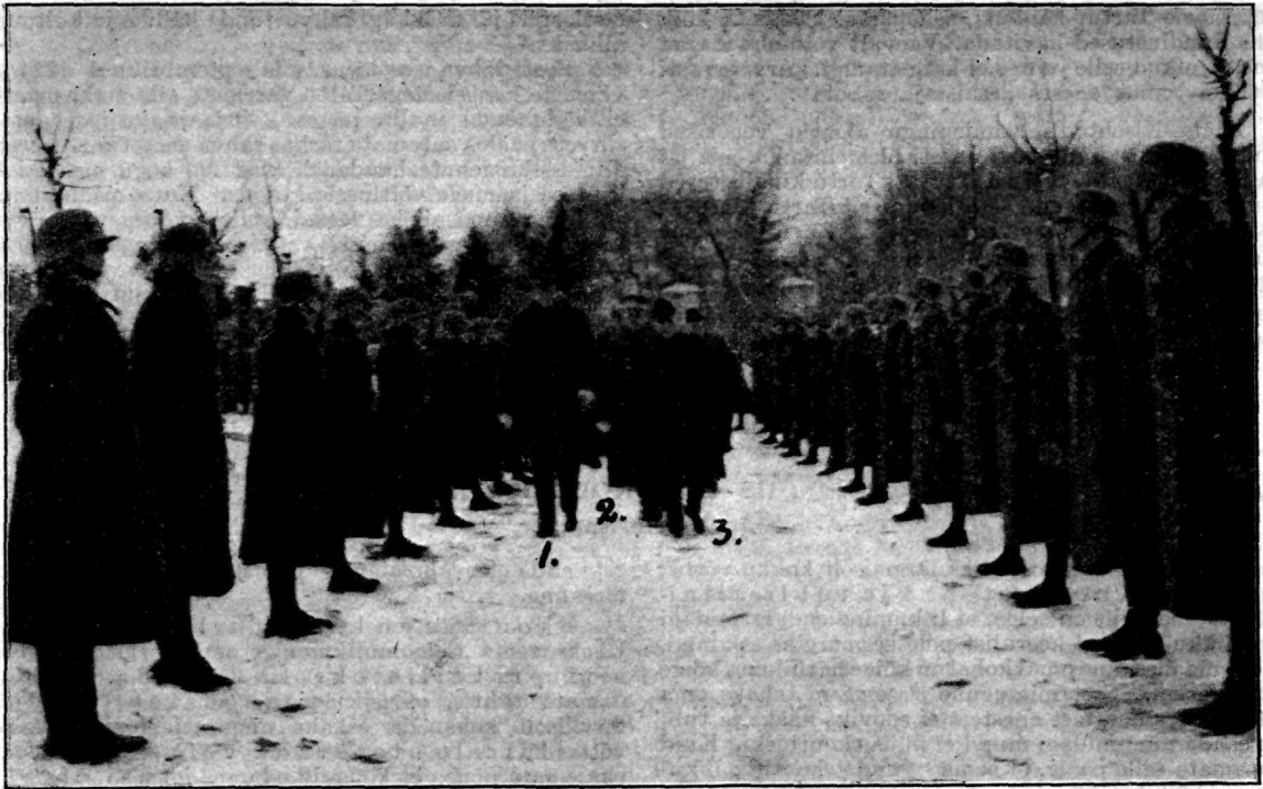
13. dets. 1925. Leedu sõjaväe esitajad pärja panemas Eesti sõjakangelaste ühishauale Juhkentali surnuäral.

1. Leedu san.-kindral Nagevicius. 2. Leedu kolonel Inglivicius. 3. Kolonel Seimann.