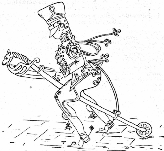
Üks mõõga kandmise kawanditest.