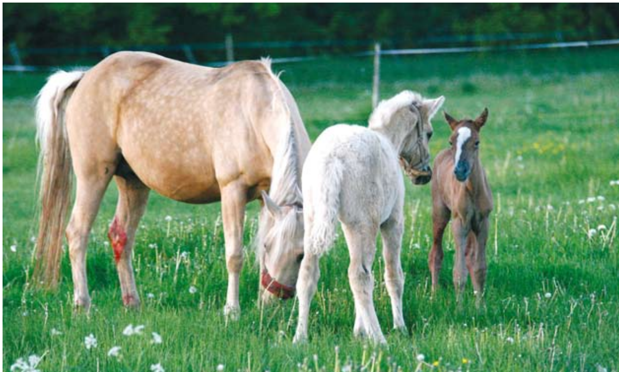
Vabapidamisel olev põlistõugu eesti hobune saab varssumisega ise hästi hakkama. Vaevalt tunnivanust varsapoissi on tulnud juba uudistama pisut vanem eakaaslane.

Alates 1980. aastatest on pandud senisest suuremat rõhku eesti hobuse ratsaspordiomaduste parandamisele. Aretustööd on saanud edu: 2005. a Eesti meister ponide takistussõidus oli eesti ristan dt äkk Anakee ning Eesti meistrivõistlustel ponide klassis kuulus kolm parimat kohta eesti hobustele.