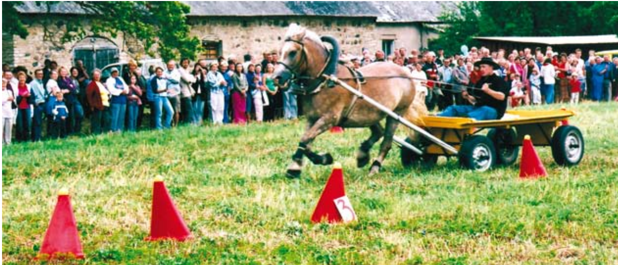
2006. a Viru-Nigulas Eesti Hobusekasvatajate Seltsi poolt korraldatud raskeveohobuste päeval oli kavas ka rakendite vigursõit.

asutamine 1911. a. Seltsi eesmärk oligi ardenni hobuste aretust süsteemselt teha. Paraku algas mõne aasta pärast Esimene maailmasõda, mis pani seltsi tegevusele punkti.