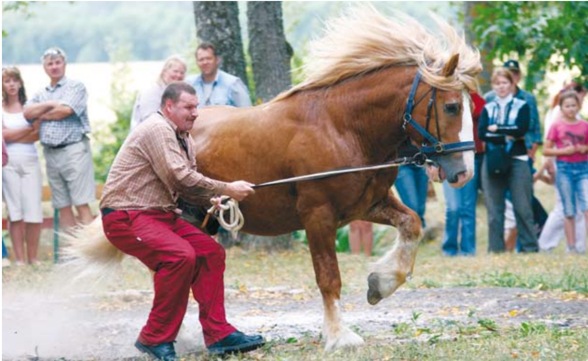
Märade läheduses hakkavad täkid käituma väga jõuliselt.

Viimaste aastate andmeid võrreldes võib loota, et raskeveohobuste arvukus hakkab tasapisi madalseisust välja tulema: kui 2003. a seisuga oli kantud tõuraamatusse 85 mära ja kuus tunnustatud sugutäkki, siis kaks aastat hiljem oli märade arv tõusnud 103 loomani. Aastatega on suurenenud ka varssade arv. 2005. aastal tuli ilmale 21 eesti raskeveohobuse varssa.