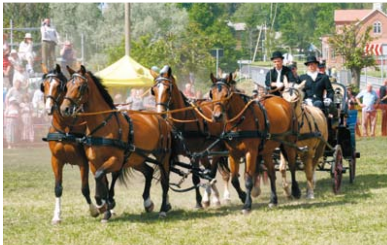
Tori hobune on suurepärase rakendihobune. Tori HK 150 aasta juubeliüritustel esitati esmakordselt kuuehobuserakendit.

Tõuloomade valikul peetakse oluliseks põlvnemist, tüüpi ja väljanägemist, liikumist, hüppeosavust, samuti tervist,