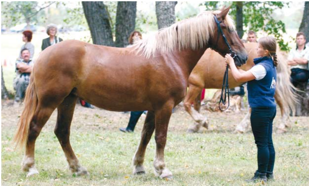
Eesti raskeveohobuste ülevaatusel.

peale turistide söidutamise sobib loom hästi just selliste soiste alade hooldamiseks, kus on traktoriga töötamine võimatu.