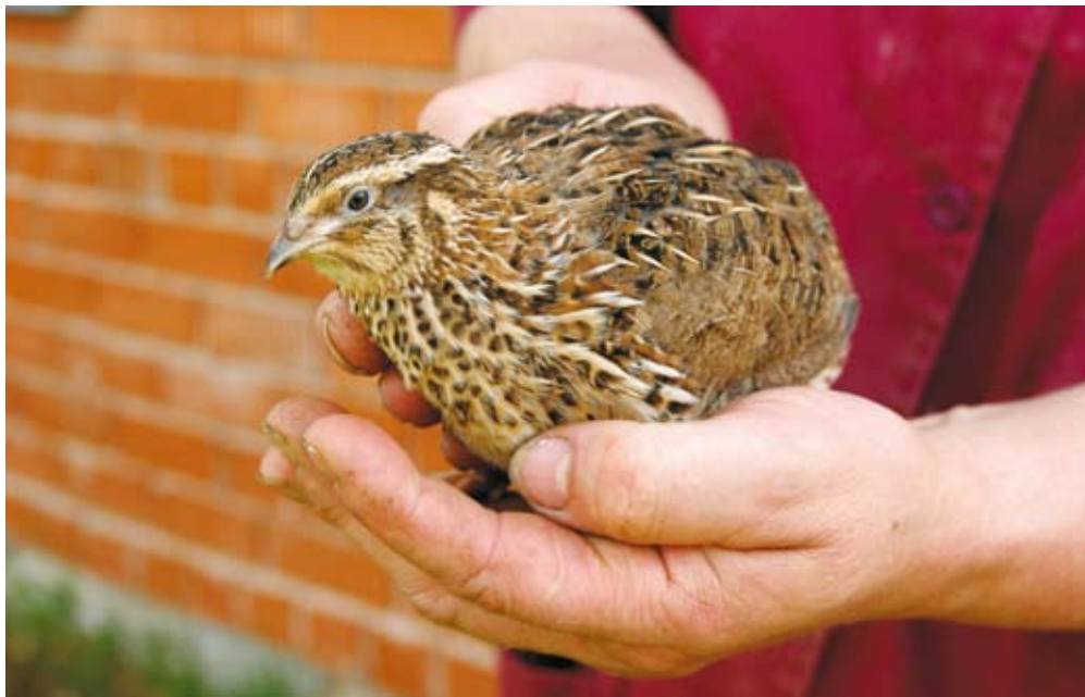
Vutt on väikseim põllumajanduslind.

päevas toodetakse seal ca 12 000 muna. Hiljaaegu avati farmis euronõuetele vastav vuttide tapamaja.