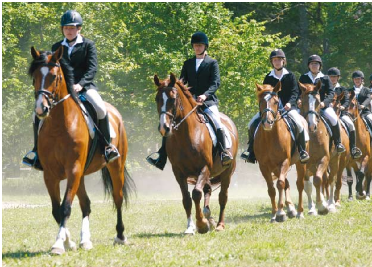
Kaasajal on tori hobust aretatud sportlikumaks.