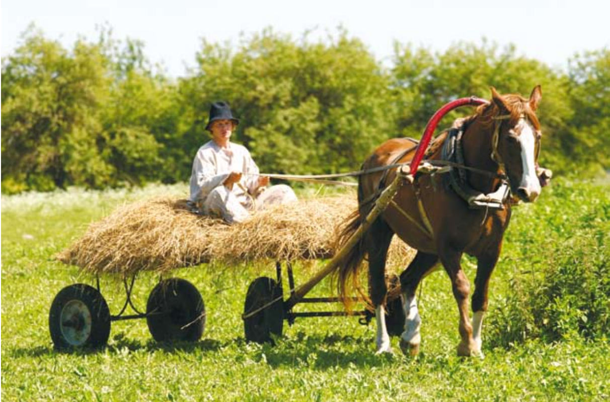
Vanatüübiline tori hobune on asendamatu abimees talutöödel.