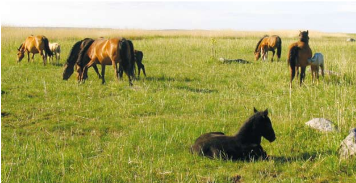
Tänapäeval on eesti hobuse hooleks poollooduslike rohumaade hooldamine. Meeleldi söövad nad rannaniidul värsket roogu ja joovad merevett.

Talletatud on legende eestlaste „dessantidest“ Rootsi, mille järgi olid eesti meestel väledad hobused paatidega kaasas. Kindlasti oli kohalikul hobusel suur tähtsus ka eestlaste muistse vabadusvõitluse juures 13. sajandil.