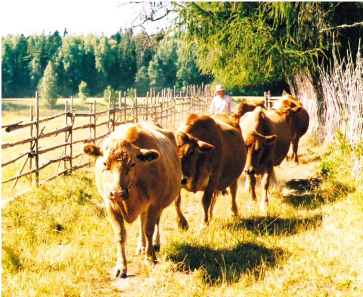
Karjamaale ja tagasi liigub kari kindlas järjekorras.