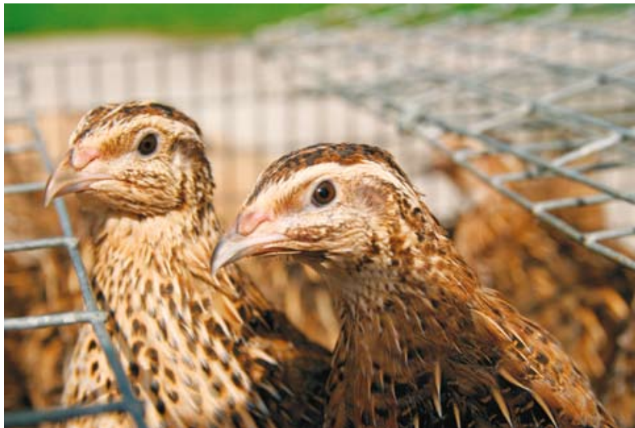
Vutte peetakse enamasti puuris.