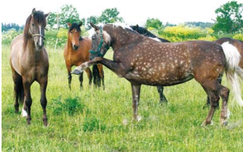
Eesti hobune on hästi värviline ja tihti leidub selles tõus väga huvitava värvusega hobuseid. Esiplaanil heleda laka ja sabaga hõbemust mära.

Tagamaks eesti hobuse püsimist Eestimaal, tema genofondi säilimist, selle hobusetõu teadvustamist ning väärtustamist, asutati 2000. aasta augustis Eesti Hobuse Kaitse Ühing. Ühing seisab eesti hobuse puhasaretuse eest, korraldab teabeüritusi ning koostab temaatilisi trükiseid.