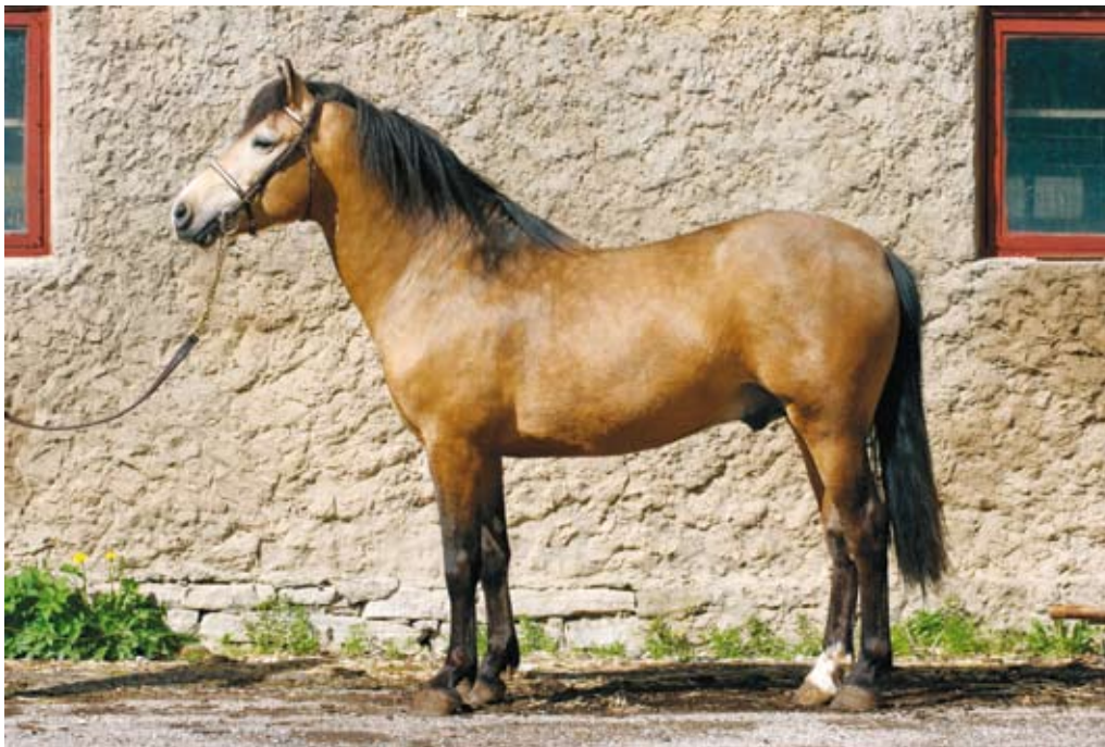
Eesti tõugu sugutäkk Rannik 747E.