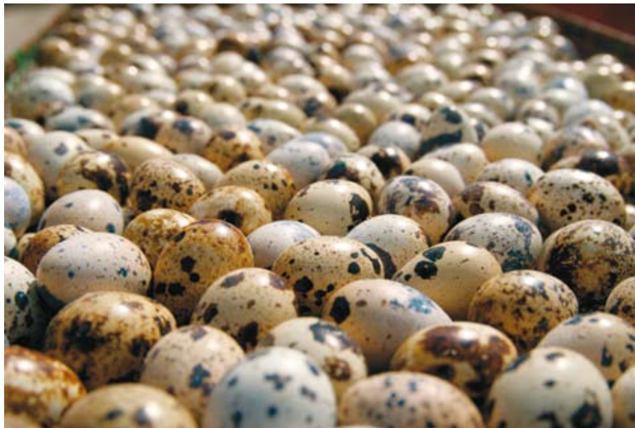
Eesti vuti munad on väga erineva värvusega.