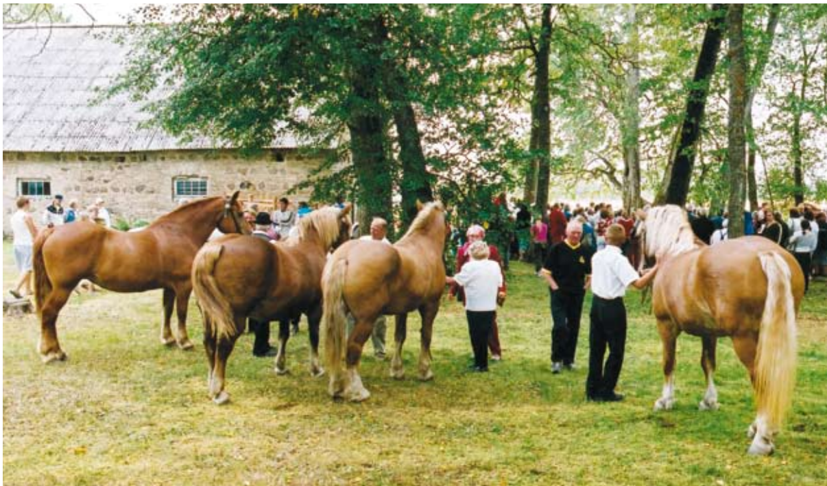
Valik märasid eesti raskeveohobuste päeval.

51 eesti ardenni tätku ja 207 mära. Tõumaterjali soetamisel oli suur tähtsus Rootsist imporditud täkkudel. Täkkude, märede ja noorhobuste impordiks sai ka riigi toetust.