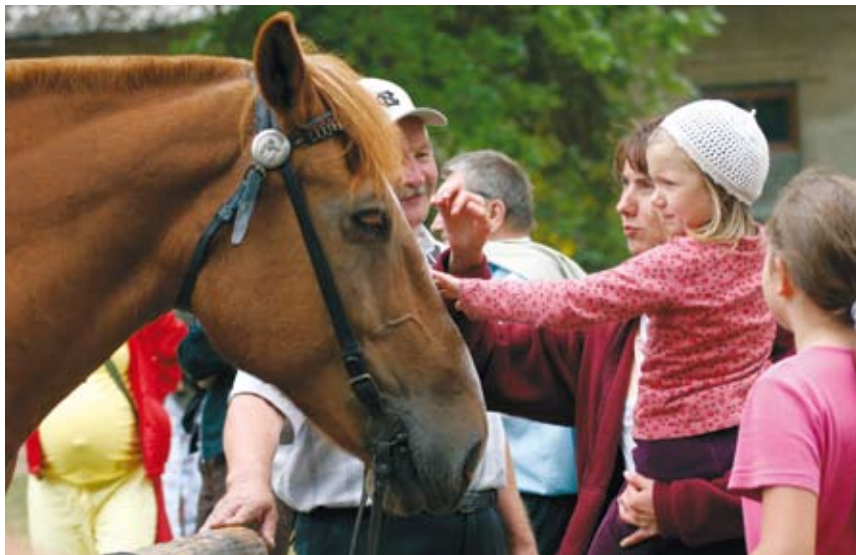
Vaatamata oma suurusele on eesti raskeveohobused väga sõbralikud ja heasoovlikud.

2003. a kevadel toimunud Eesti Hobusekasvatajate Seltsi üldkoosolekul kinnitati eesti raskeveohobuste säilitus- ja aretusprogramm. Selle eesmärk on säilitada tõug ning aretada välja mitmekülgse kasutusotstarbega tööhobune, kes vastaks nii kohalikele loodustingimustele kui majanduslikele vajadustele. Paarid valitakse nii, et säiliksid tööle iseloomulikud omadused ega tekiks lähisuguluses olevate loomade omavahelisest ristamisest tingitud puudusi – sigivuse langust ja pärilike haiguste sagenemist. Selleks tuleb laiendada tõu leviala üle kogu Eesti ning kujundada välja uusi aretusliine teiste Euroopa külmaverelist tõugu täkkudega.