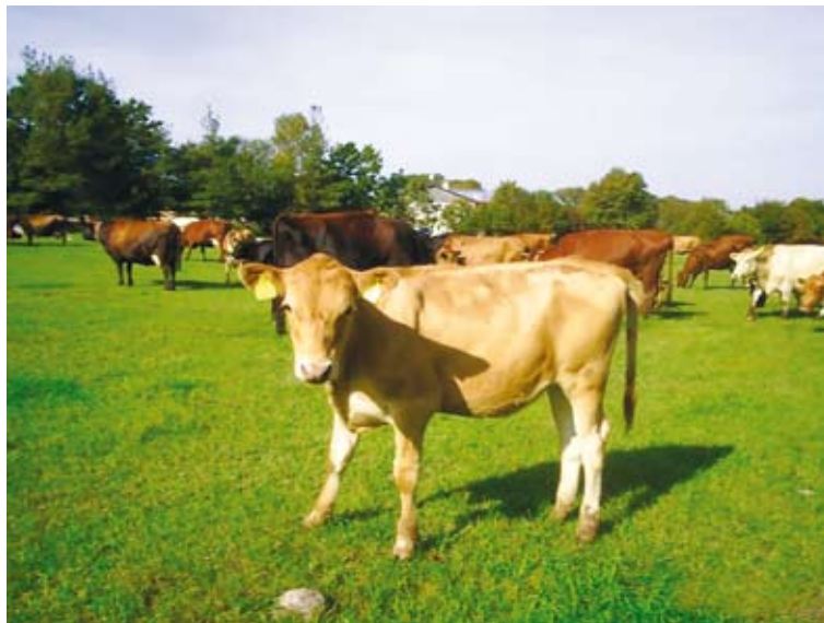
Maakarja vasikad on terved ja tugevad.

osteti läänesoome pullide spermat. 1995–2005 oli kasutusel ka 69 kodumaise pulli sperma. Nii suudeti vältida sugulusaretust ning parandada maatõu geneetilisi omadusi.