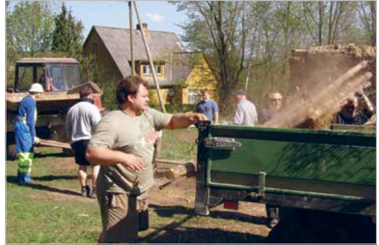
Traditsioonilised igakevadised koristus- ja lammutustööd Kolga-Jaani kiriku pargis

Planting a trees in Kolga-Jaani Church park