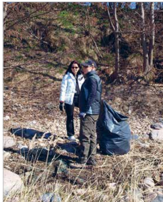
Kakumäe rannaäärse puhastamine Teeme ära kampaania raames 2011

Club at the LC Tabasalu's Christmas market in 2010