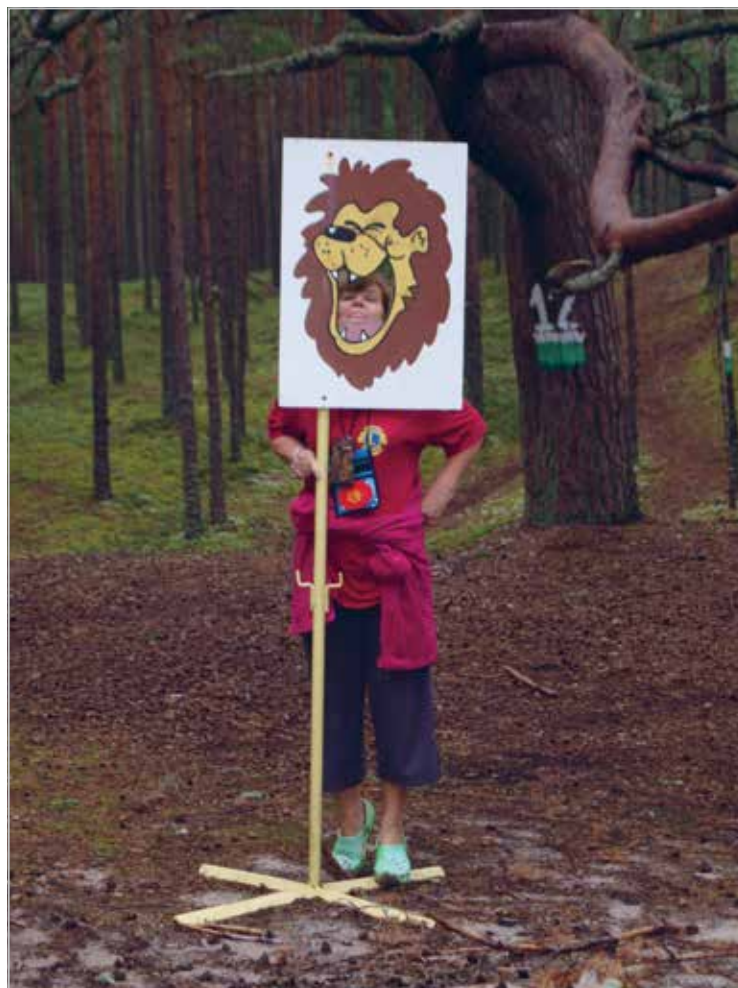
Lõvi. – LC Tartu Toome