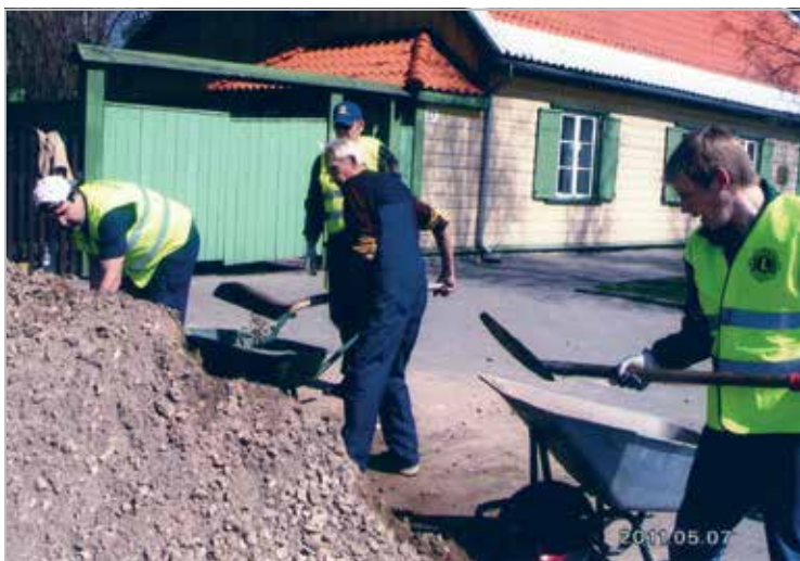
Pärnu Lydia Koidula muuseumi heakorrastus (haljastus)

Public maintenance works (plantering) in Lydia Koidula Memorial Museum