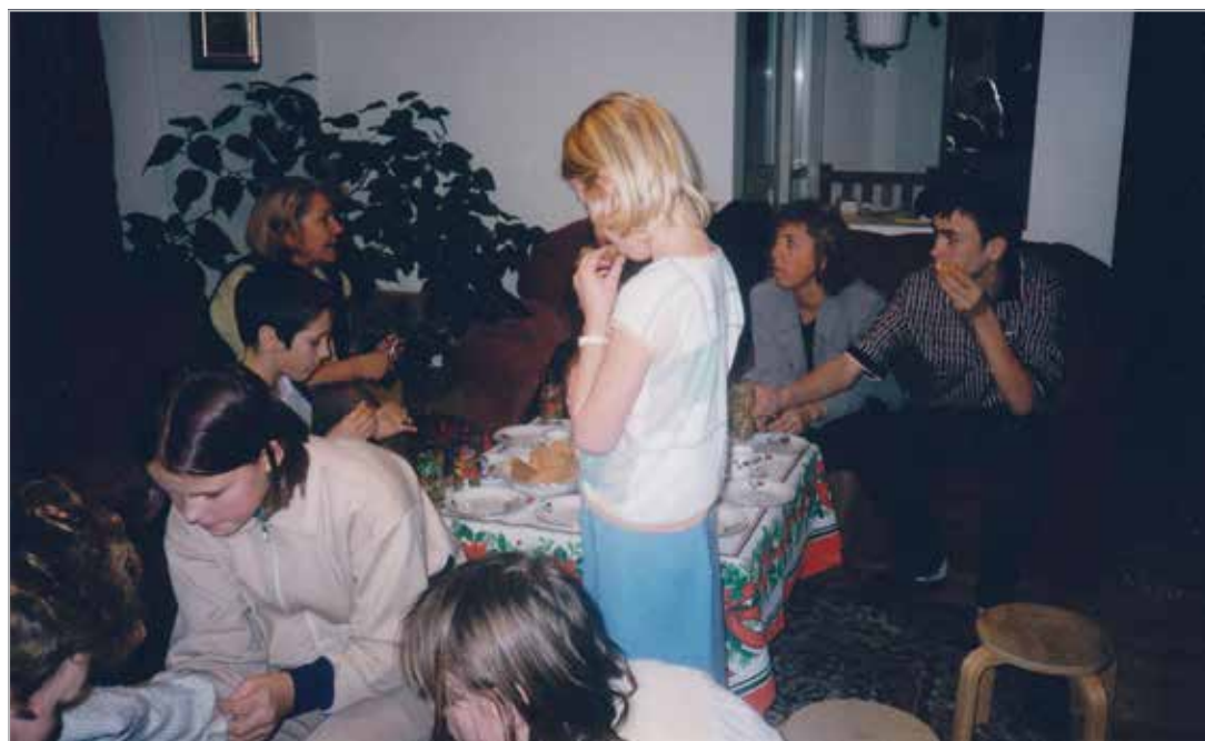
SOS Keila Lasteküla. Perel külas jõulude ajal

With children from Keila SOS Children's Village at the Pauling Coffee factory