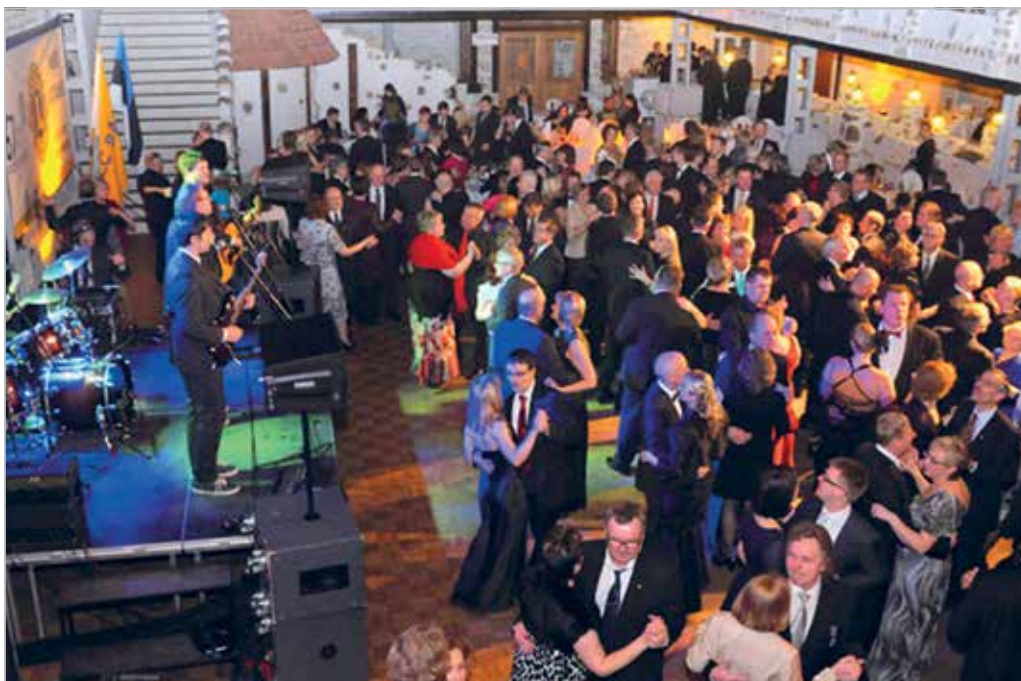
Lionsball Viktoria keskuses