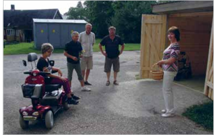
2011–2012 oli meie projektiks invarollerli liikumispuudega neiu. Kui roller olemas, siis oli vaja teha ka garaaž. Hooaegade presidendid ja peatöövõtja tööd üle andmas

Cleaning the benches of Põltsamaa's castle park