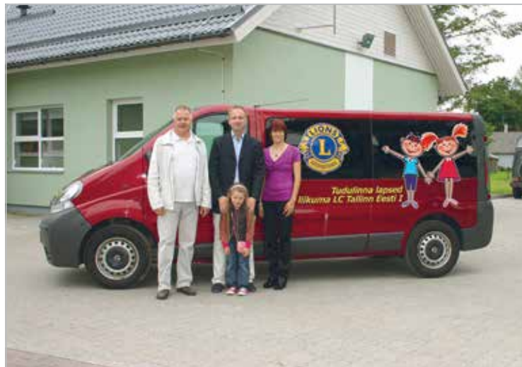
Lions buss Tudulinna lastekodule. – Urmas Ustav, LC Tallinn Eesti I