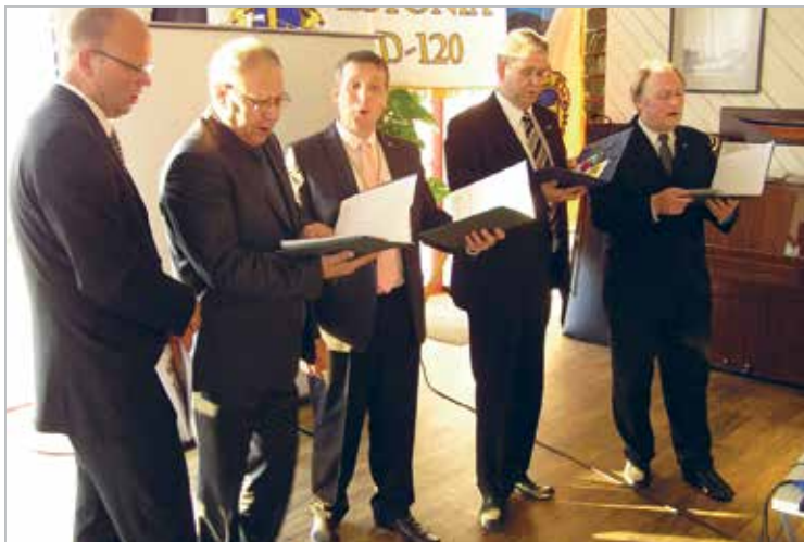
Paikuse klubis leidub võimekaid lauljaid, laululõvid esinemas Eesti Lions-piirkonna üritusel 2011. a.