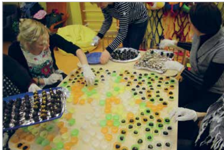
Enne 2012 aasta jõule veeretame ühiselt 1500 imemaitsvat šokolaadi trühvlit. Need läksid müügiks erinevatele firmadele