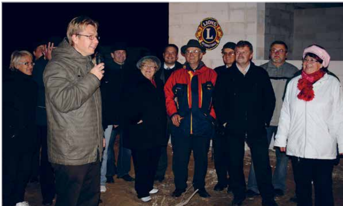
Külamaja nurgakivipanek oktoober 2010

Catering at the parish's summer day, 2011