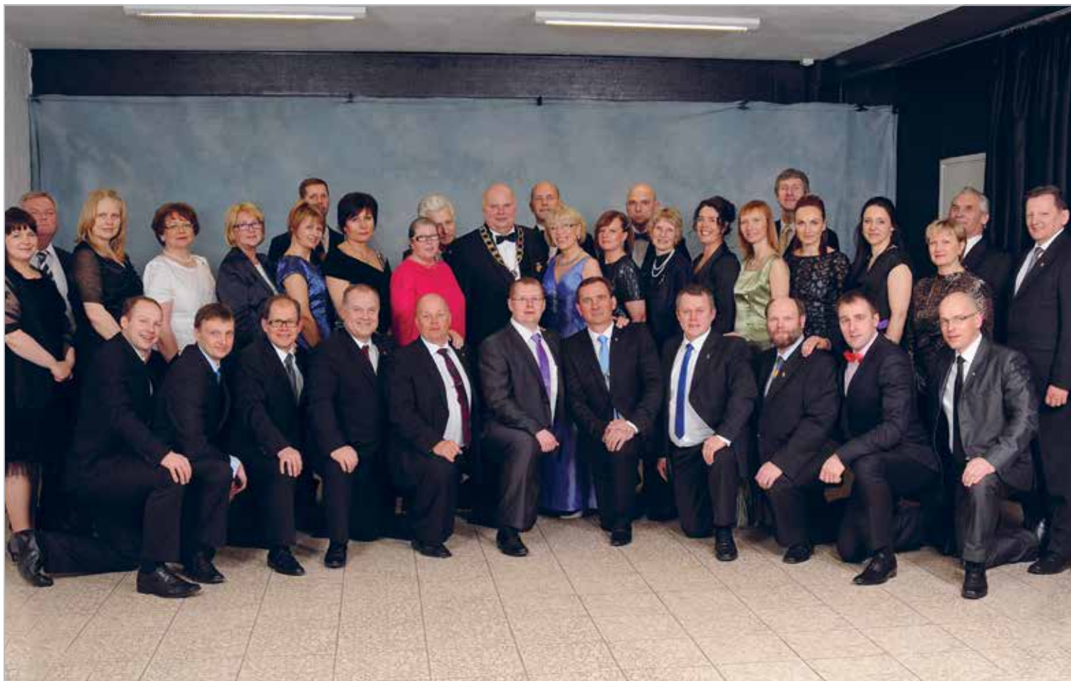
LC Saku lionid ja leedid, 2013

Asutamispäev: 29.06.1991 Charter Night: 31.08.1991