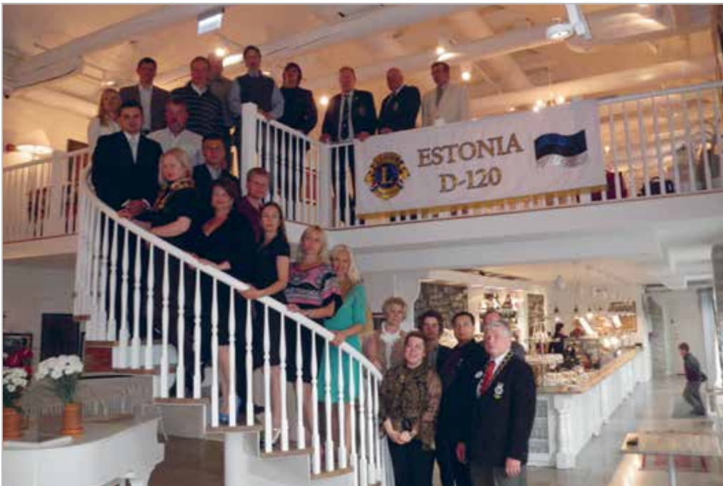
LC Tallinn Meri asutamiskoosolek 30.05.2012