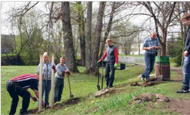
Rapla lionid koos pereliikmetega istutavad 11. mail 2013. a. puid Rapla linna promenaadile. Istutatud sai 18 Virginia toomingat

Norwegian Lions are handing over an aid package in Rapla