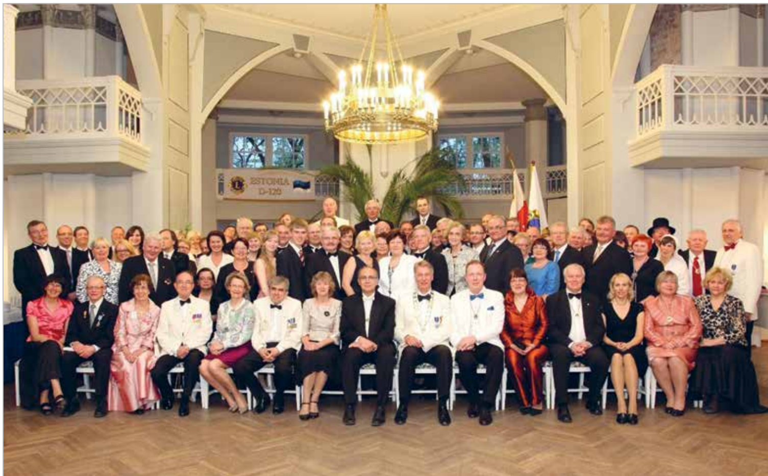
Klubi liikmed, leedid ja külalised Charter Night 20. aastapäeva tähistamisel, mai 2010.

Asutamispäev: 04.03.1990 Charter Night: 12.05.1990