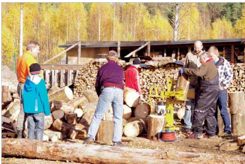
LC Ülenurme and LC Tartu Toome on a charity day in Maarjaküla on October 12, 2013