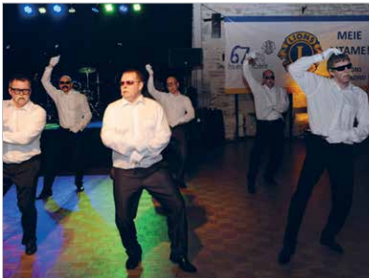
Saku lõvi on tantsulõvi!