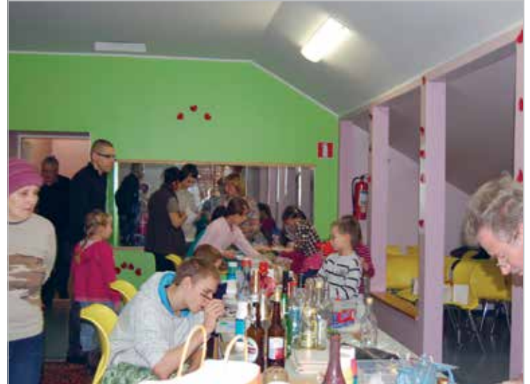
Jõuluingituste töötuba. Kingituste müügist saadud raha läheb lastele

We always lend our helping hand to Extreme Sport Club at sporting events. Power drinks for marathon runners