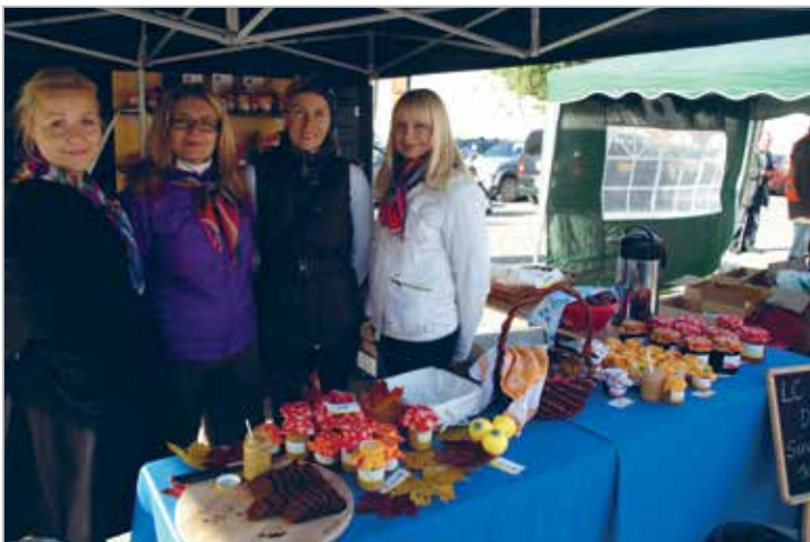
Pole oluline kui palju sinepit laadale kaasa võetakse, alati saab kõik müüdnud suure menuga! Heateolaat Tallinnas Vabaduse väljakul 12.10.2013