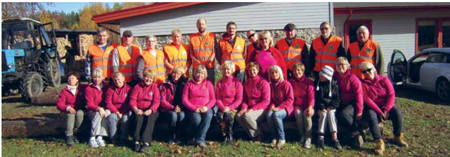
LC Ülenurme ja LC Tartu Toome Heateopäeval Maarjakülas 12.10.2013