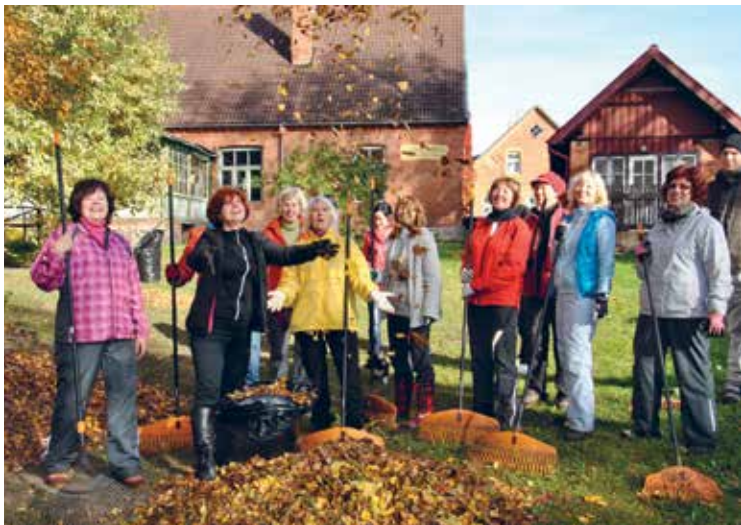
LC Viljandi Ellipsi naised Heateopäeval