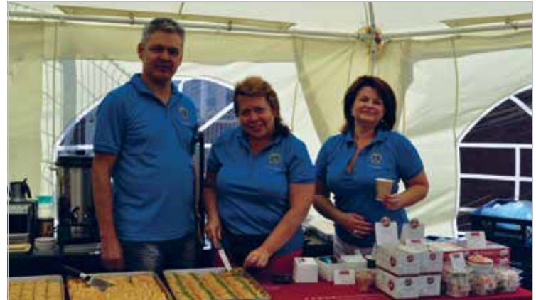
LC Tallinn Meri avas Merepäevadel kohviku. Kogutud raha eest toetati noortekodu Kodupaik 1000 euroga

LC Tallinn Meri hosted the children of Pikavere kindergarden-elementary school on Vastlapäev holiday with sporting games and sweet buns