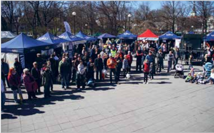
Päikesepaisteline ja meeleolukas 7. mai 2011 Tallinnas, Tammsaare pargis esimesel Heateo Festivalil