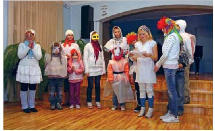
Kadrid esinemas Valga Muusikakooli saalis (autor Arvo Meeks, „Valgamaalane”)

Mardid playing in the new building of Regional Rescue Board in Valga