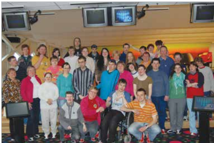
LC Tartu Toome korraldas Maarja Küla lastele sõidu Tartusse, Eedeni bowlingusaali bowlingut mängima

LC Tartu Toome organised for children a trip to Tartu Eeden bowling hall