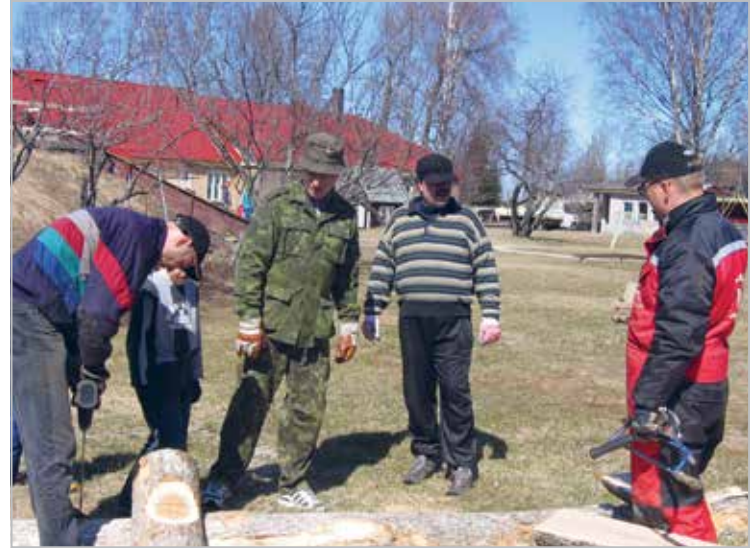
Heateo päev Kabli lasteaia mänguväljaku korrastamisel

Making firewood for senior citizens on a good deeds day