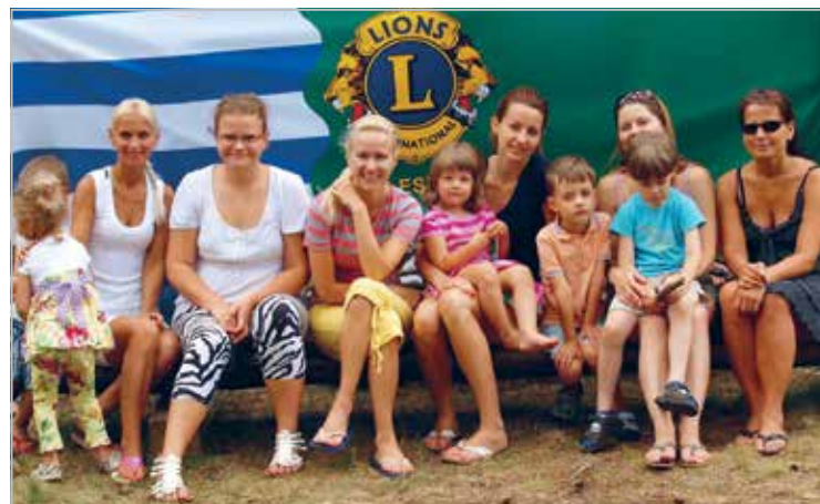
Klubi tagala. Lionite naised-lapsed kokkutulekul 2010

Rollerskating event for Haabersti school-child, foto of two of the lion-organizers