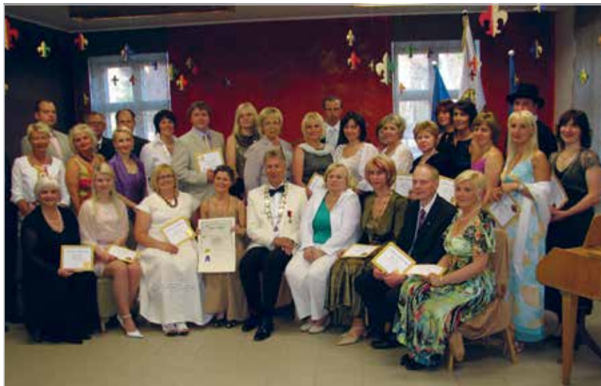
LC Viljandi Fellin Charter 5. juuni 2010

Läbiviijaks LC Tallinn Eesti I lionid. Mõlemal üritusel osales ligikaudu 400 lionit kaaslastega.