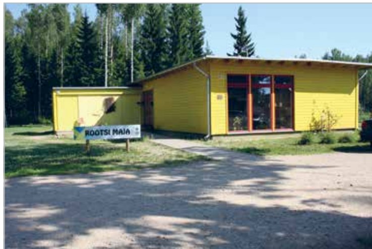
Rootsi maja on ehitatud Rootsi lionite kogutud rahaga

The Lions building a club house at Maarja Village