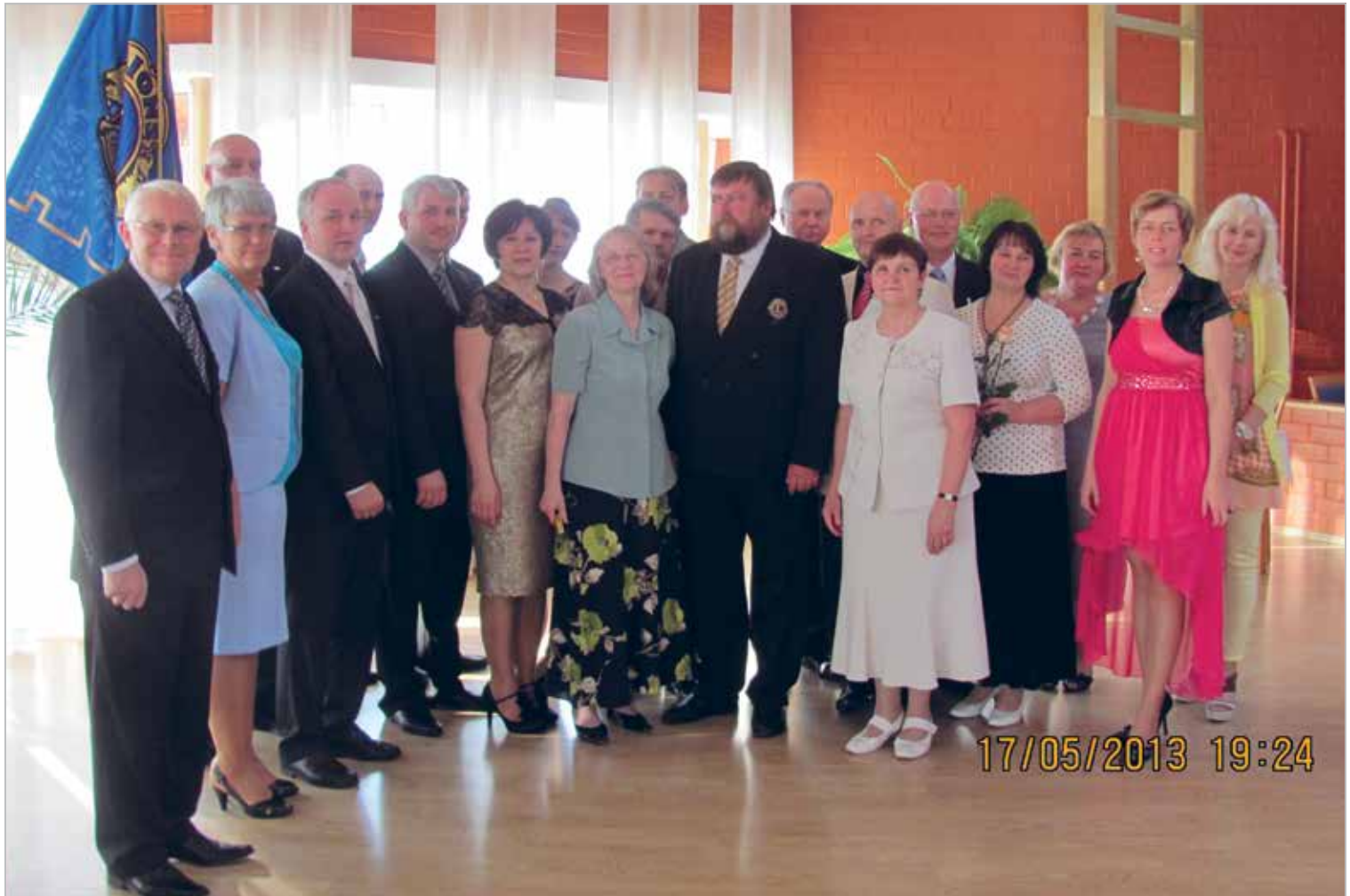
LC Häädemeeste 18. aastapäeva peol

Asutamispäev: 20.02.1995 Charter Night: 20.05.1995