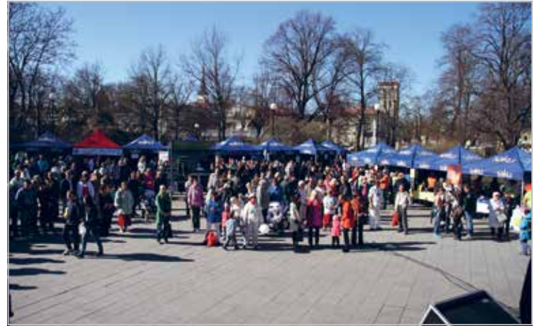
A sunny and spirited day in Welfare Festival in Tallinn on 7 May 2011