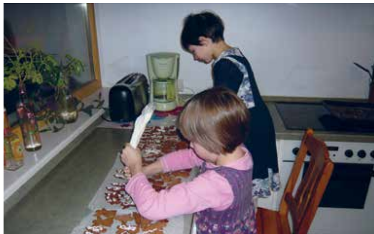
Maarjamäe piparkoogitegu – meie iga-aastane jõulueelne piparkoogitegu Maarjamäe lastekodu lastega

Club members and children from Tallinn orphanage Maarjamäe center visiting Estonian Public Broadcasting museum