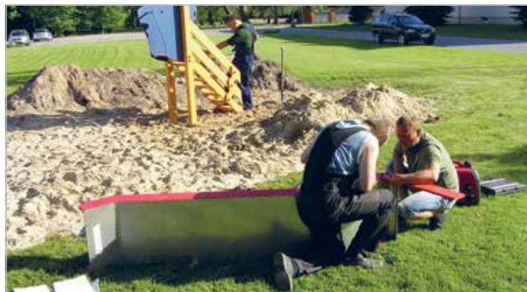
Avaliku laste mänguväljaku püstitamine Paikuse alevisse 2012. a. Projektitoetuse abil ostsime väljaku atraktsioonid, pinnase- ja liivatööd ning paigaldamise teostasime oma jõududega

Paikuse lions club's benches for public use consist of huge fieldstones need to process in right shape. Working process in 2011