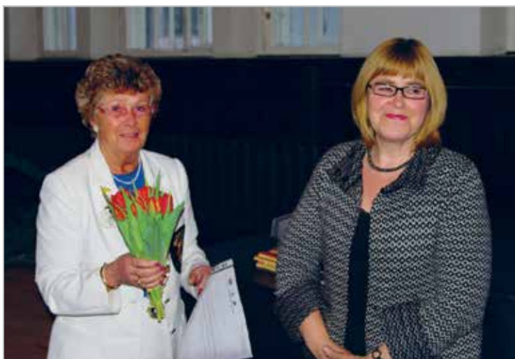
Rahuplakati võistluse korraldaja tänamine Thanking the arranger of the Peace Poster competition