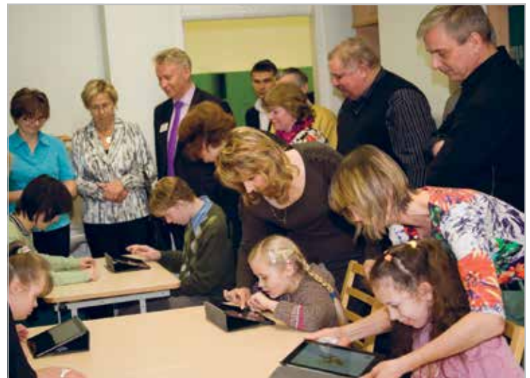
„Näpud tööle” Arvutite üleandmine erivajadustega laste koolile

Catering rally spectators during a charity day