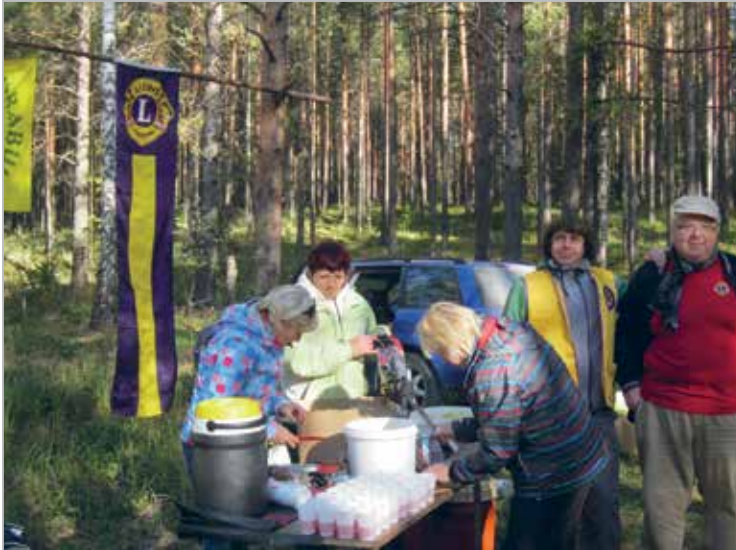
Ekstreemspordiklubi XT Sport toetamine ürituste korraldamisel. Jõujoogid ootavad maastikumaratoni jooksjaid

We always lend our helping hand to Extreme Sport Club at sporting events. Power drinks for marathon runners