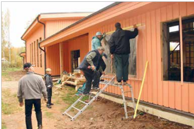
Lionid Maarja Küla klubihoonet ehitamas

The Lions building a club house at Maarja Village