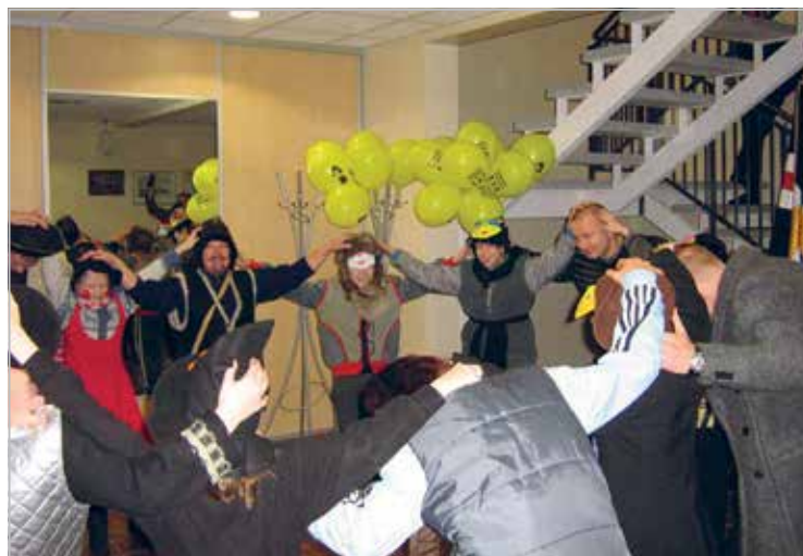
LC Valga Mardituur Valga Kurepesa- ja Taheva Sanatooriumi asenduskodu lastele

Paide's family day Pancakes for Children