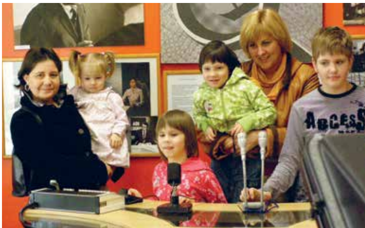
ERR muuseum – Klubi liikmed ja Tallinna lastekodu Maarjamäe keskuse lapsed külastasid Eesti rahvusringhäälingu muuseumi

Helping homeless dogs in pets shelter with childrens from Maarjamäe orphanage