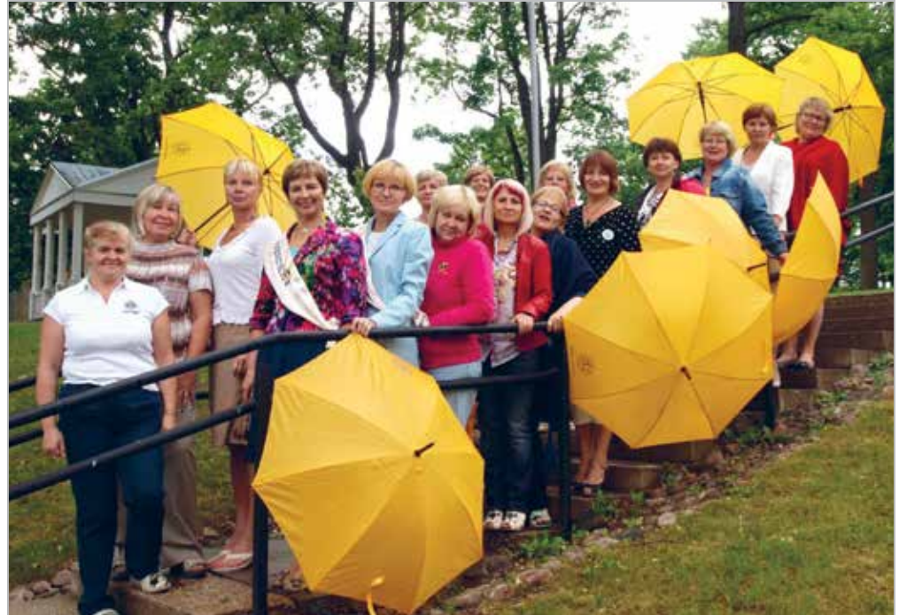
Suvine: vihmavarjudega, mille müügist saadud tulu läheb heategevuseks

With lion friends from LC Husumi (Germany) in Taevaskoja before the fall of the Virgin cave