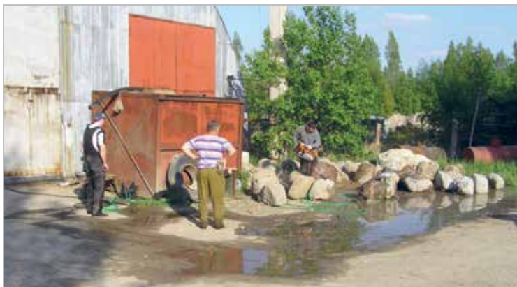
Klubis on võimalik heategevuse käigus õppida erinevaid töid, näiteks Sindi-Paikuse vahele pinkide paigaldamiseks on vaja ette valmistada pingikivid, milleks on omakorda vaja korralikku platsi, kive, vett, tööriistu ja töömehi. Fotol on kujutatud kivide ettevalmistustöid 2011. a.

Installation of benches in Paikuse graveyard in 2012