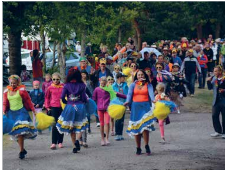
Kuum pidu Pärlseljal