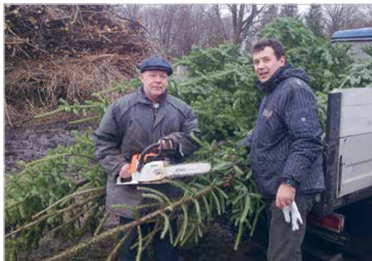
Jõulukused Pärnu lasteaedadele

Public maintenance works (plantering) in Lydia Koidula Memorial Museum