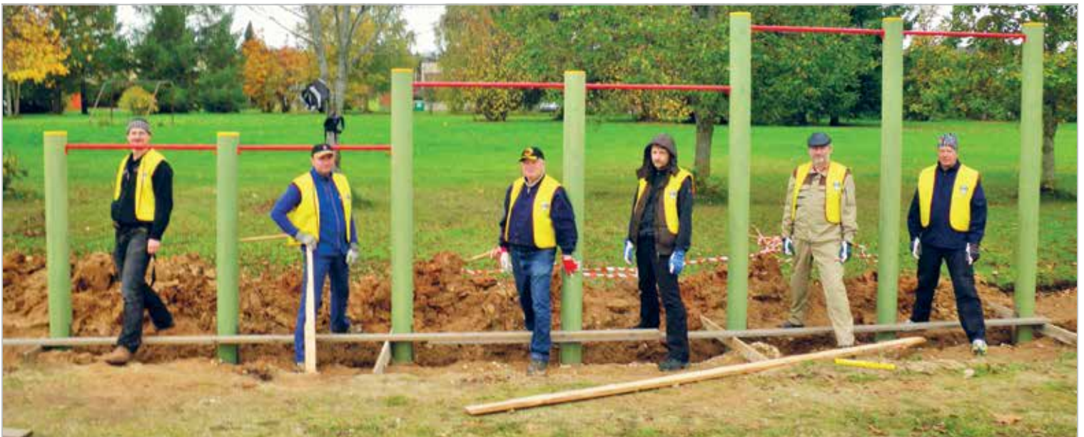
LC Ülenurme esimesel üleriigilisel heateopäeval 8.10.2011