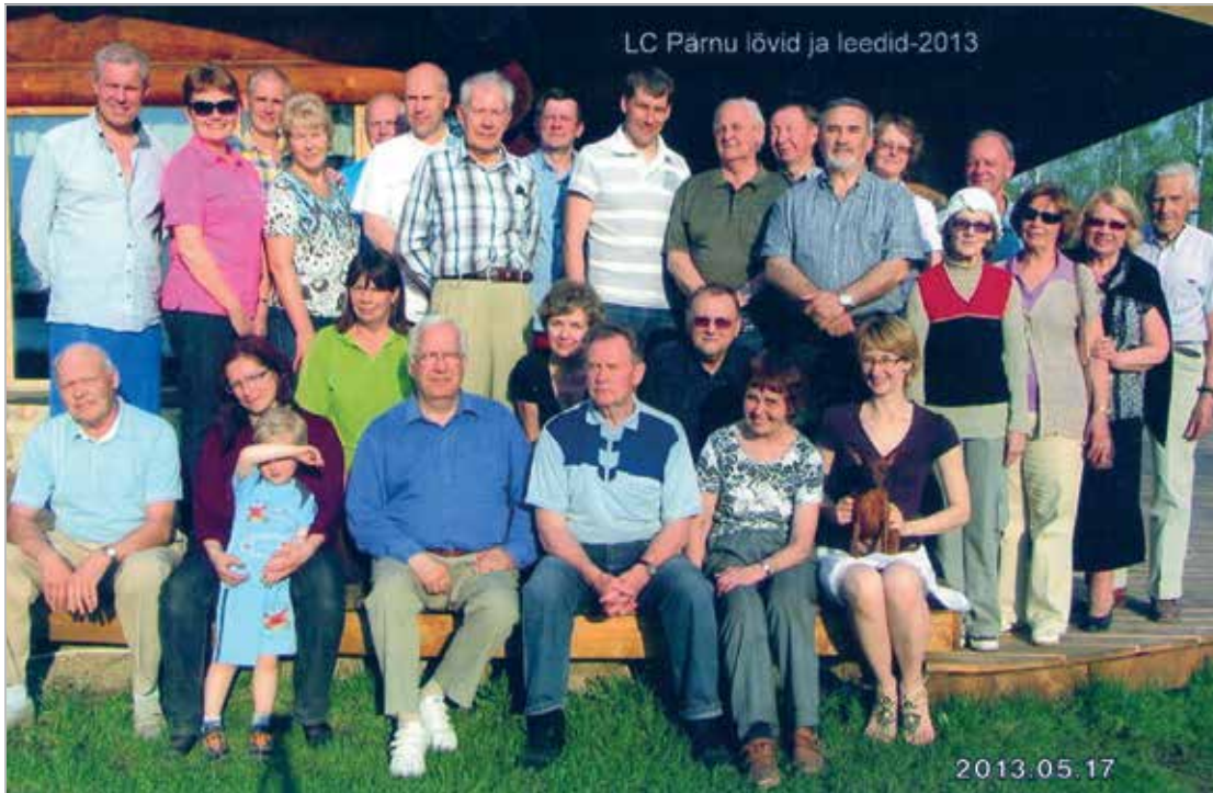
Lions Club Pärnu lionid ja leedid

Asutamispäev: 14.12.1989 Charter Night: 17.03.1990