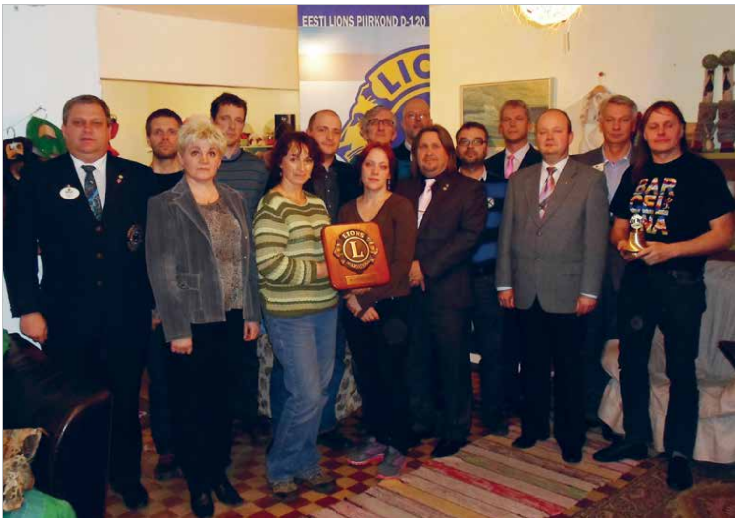
LC Raasiku asutamiskoosolek