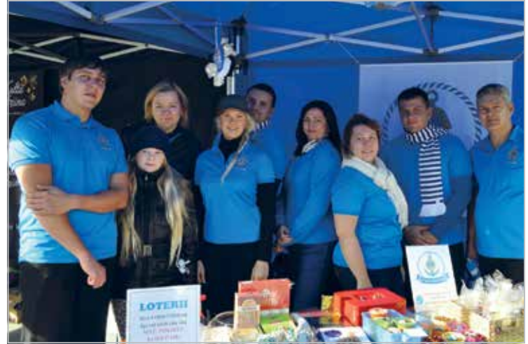
LC Tallinn Meri Heateopäeval 2013 aktiviteeti kogumas

LC Tallinn Meri in Tallinn's Dome Church when the flag is being blessed, 2013