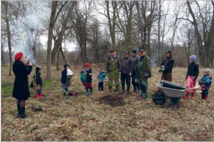
Puude istutamine kirikupargis

Planting a trees in Kolga-Jaani Church park