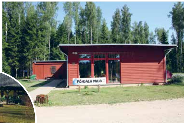
Põhjala maja on kogutud Skandinaavia lionite kogutud rahaga

The Estonian house has been built for the money saved up by the Estonian Lions and Rotarians