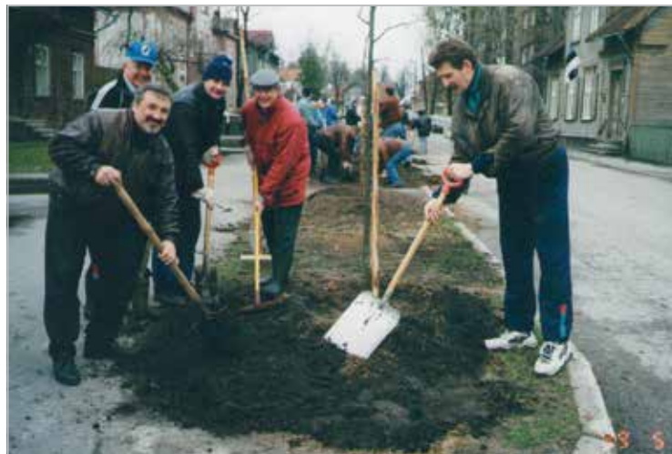
Puude istutus Esplanaadi tänaval

Selling Christmas gingerbreads for charity