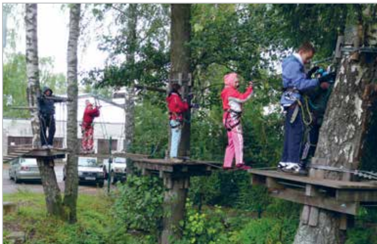
Seikluspark – Maarjamäe lastekodu lastega Nõmme seikluspargis

In Nõmme Adventure park with childrens from Maarjamäe orphanage