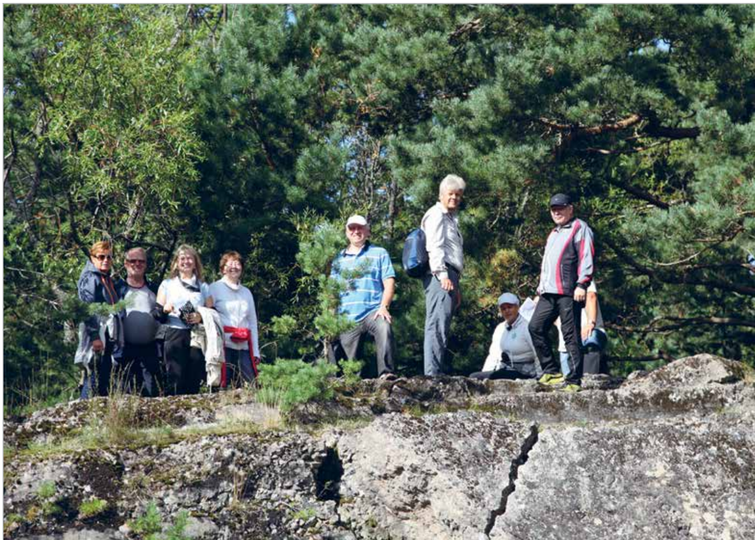
Aegnal rannapatarei kahuripositsiooni varemetel

Asutamispäev: 10.05.1992 Charter Night: 05.09.1992