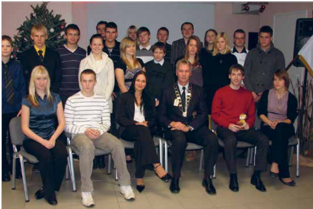
Leo klubi Laagri asutamine 14. detsember 2009