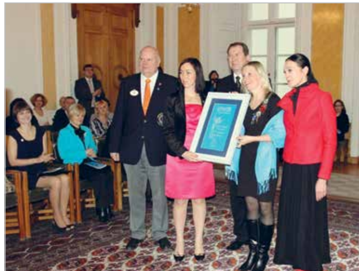
UNICEFi Sinilinnu auhinnaga autasustati Pärnu Lions-klubisid