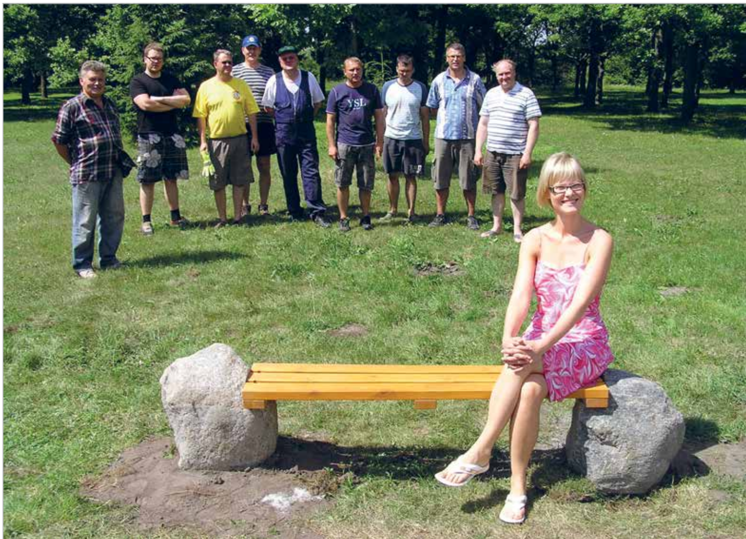
Pink Sindi Raekoja ees on valmis ja Sindi linnapea testib selle vastupidavust ning meeldivust 2011. a. juulis