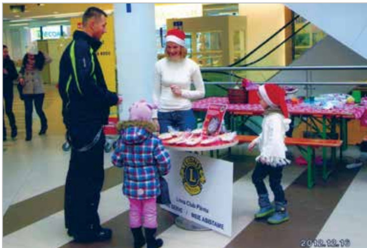
Jõuluparkookide müük heategevuseks

Selling Christmas gingerbreads for charity