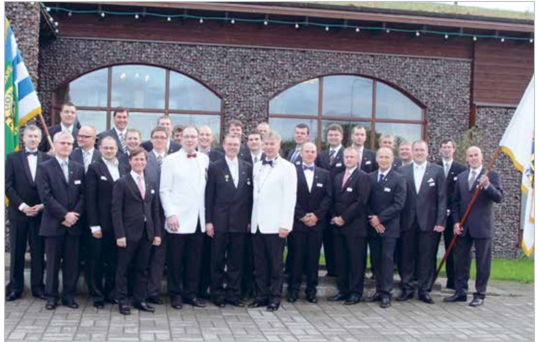
LC Rocca al Mare Charter 29. mai 2010