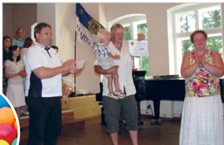
Kristliku Noortekodu kevadkontserdil annetus tseki üle andmas

Giving a donation cheque at Christian Youth Home's Spring concert