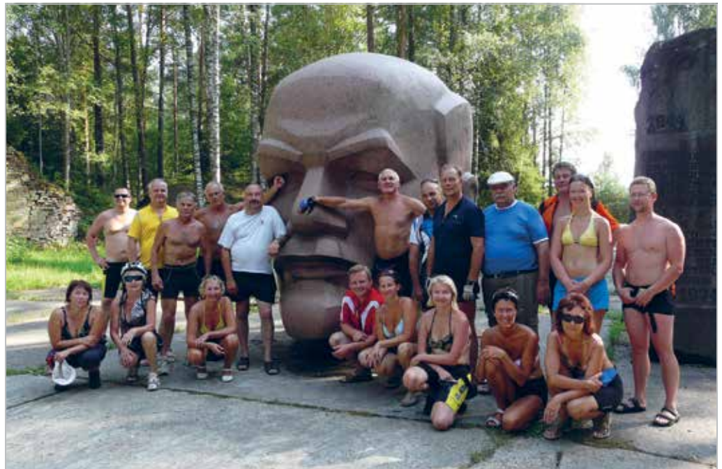
Rattamatkal 2010. a. Aluksnes koos sõpradega Põltsamaa klubist

Givin a helping hand by making firewood in Maarja village