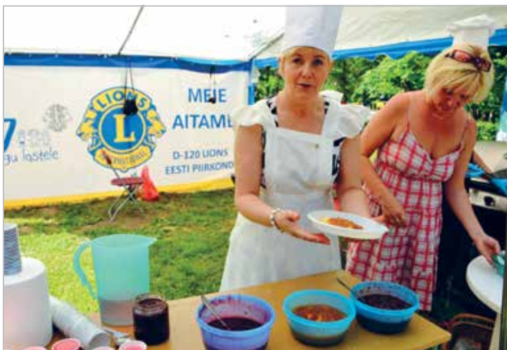
Pannkoogid lastele Paide perepäeval

Paide's family day Pancakes for Children