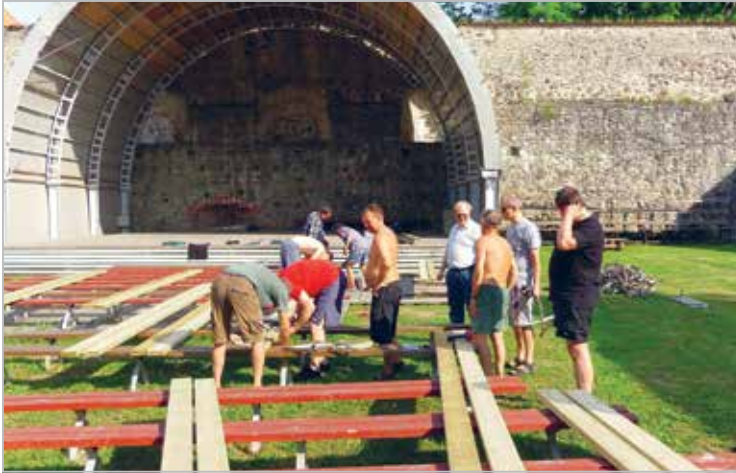
Põltsamaa lossihoovi pinkide korrastamine 2013 aasta suvel. Enne töö ja siis lõbu! Tööle järgnes hooaja lõpetamine

Cleaning the benches of Põltsamaa's castle park