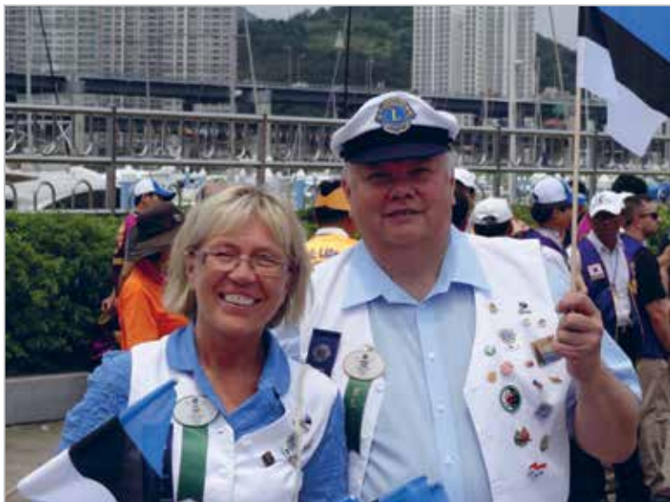
Busani aastakongressil, 2012