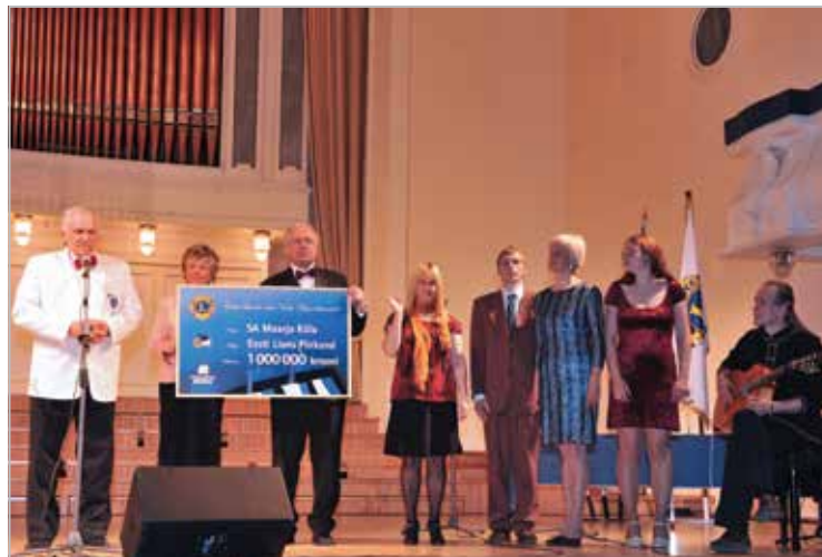
Eesti Lions-piirkond annetas Maarja Külale 1 000 000 krooni Eesti maja ehitamiseks Estonian Lions donated for Maarja Küla 1 000 000 kroons