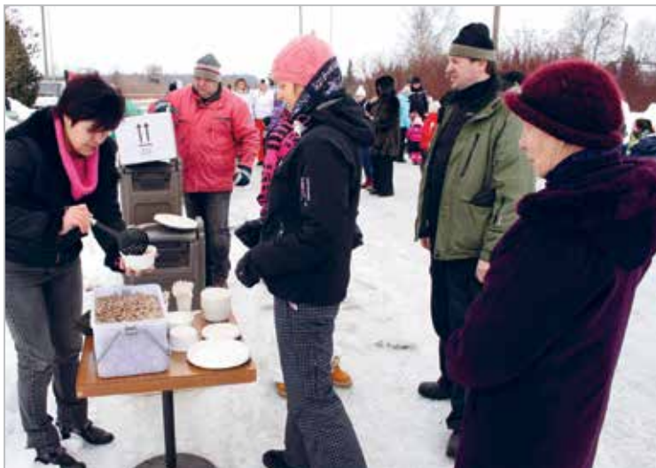
Kohaliku valla spordipäeval toitlustamas 2013

Catering at the local parish's sports day, 2013