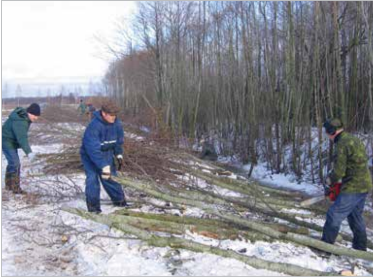
Heateo päev pensionärile küttepuude tegemiseks

Making firewood for senior citizens on a good deeds day