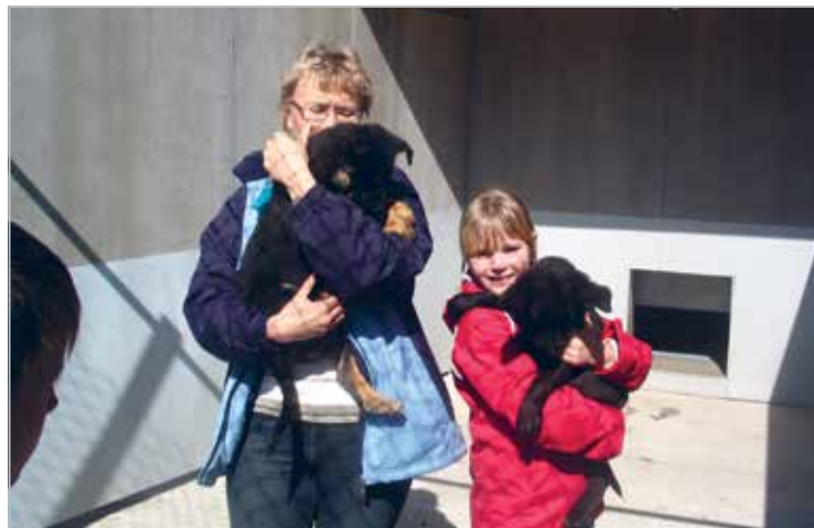
Loomade varjupaik – Maarjamäe lastekodu lastega loomade varjupaigas kodutuid koeri abistamas

In Nõmme Adventure park with childrens from Maarjamäe orphanage