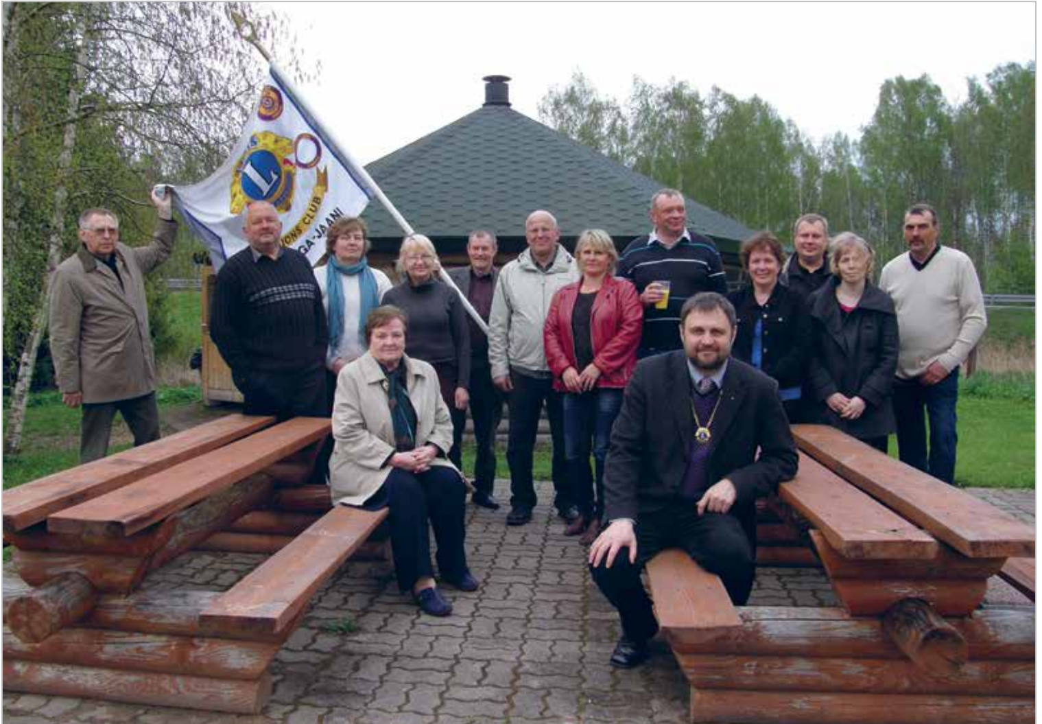
LC Kolga-Jaani lionid ja leedid

Asutamispäev: 21.05.1994 Charter Night: 15.10.1994