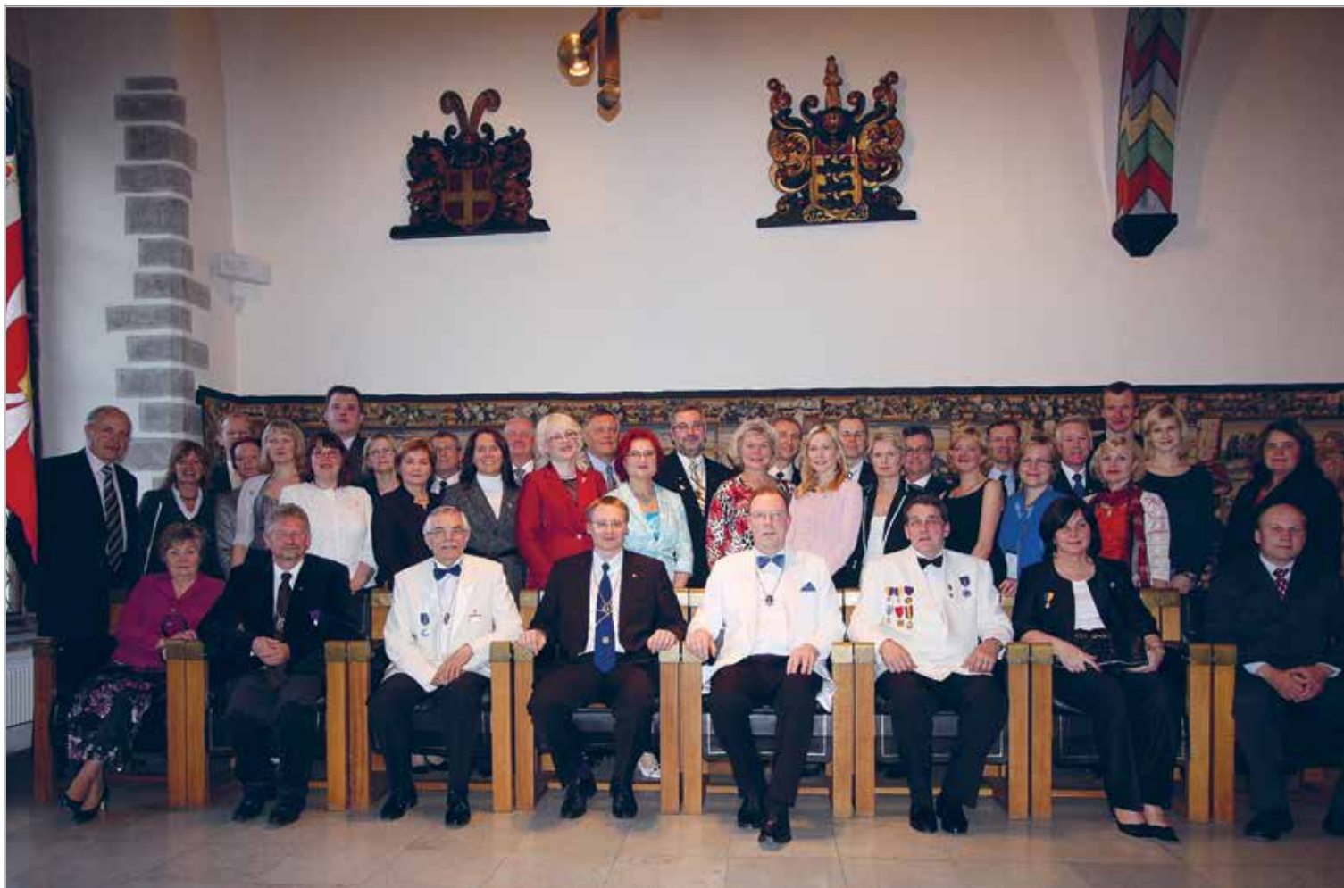
LC Tallinn Kristiine liikmed koos leedide ja külalistega klubi 15. aastapäeva tähistamas Tallinna Raekojas 11.05.2010