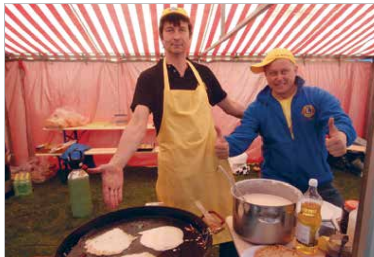
Nendest pannkookidest on võimatu keelduda. Saku lionid kevadlaadal

LC Saku built a work room for Haiba's Children Home