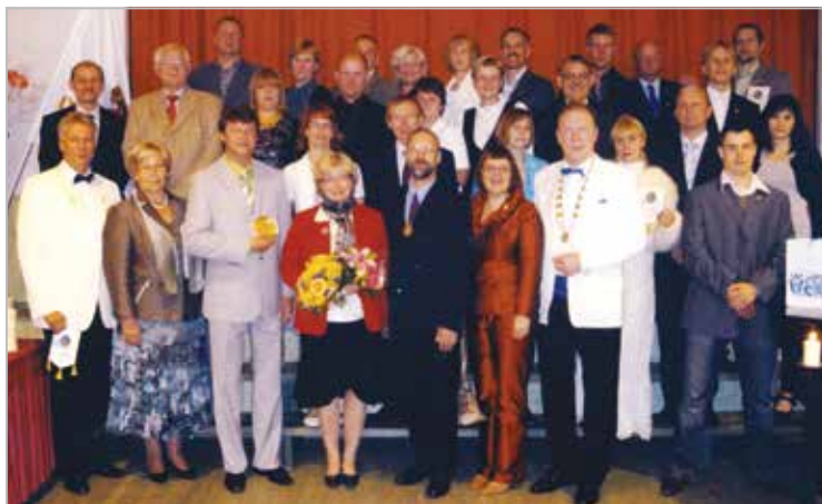
LC Rapla lionid koos leedide ja külalistega klubi 10. aastapäeva tähistamisel Valtu Rahvamajas 17. mail 2011. a.

Aastatel 2009–2014 oleme keskendunud oma põhitegevuses lasterikaste ja puudustkannatavate perede toetamisele. Kogusime raha Maarja küla toetuseks. Organiseerisime koolitusi asendusvanemate ja probleemsete perede vanematele. Müüisime jõulukuuski ja kogutud raha eest tegime jõuluringitusi paljulapselistele peredele. Teeme ka koostööd „Saagu valgus” fondiga. Vahendatud on Norra lionsite abi teistele lionsklubidele ja Rapla maakonna puudustkannatavatele peredele. Lastele suunatud tegevusena on remonditud Vesiroosi tervisepargi verti, istutatud puid, hooldatud terviseradu, aidatud kujundada laste suusamäge ja kingitud veepump liuvälja hooldamiseks. Ehitatud ja värvitud Valtu lasteaia ja koolimaja aeda 2009. a. 2013. a. ja ehitatud erinevate töötasapindadega kööki liikumispuudega inimesele.