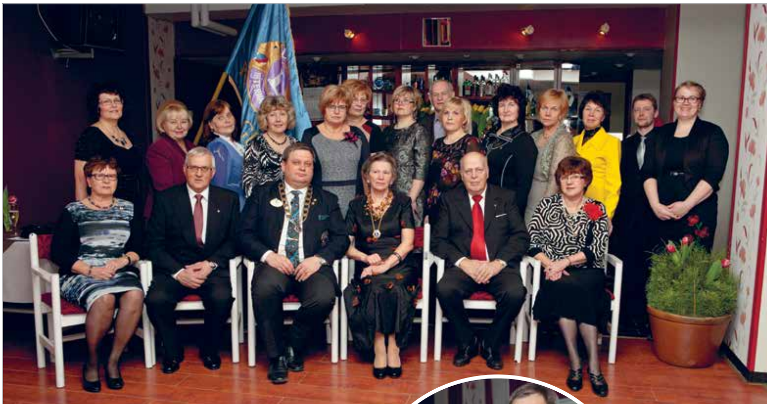
LC Põlva Gloria 15. charter 26.02.2014