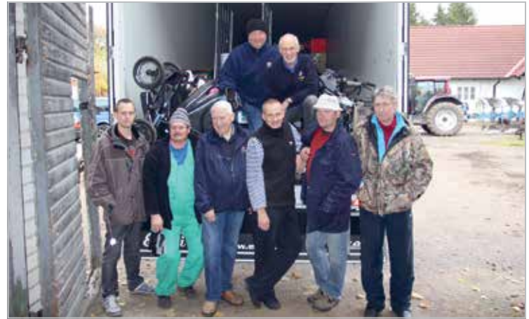
Norra lionsid lionite abisaadetist üle andmas Raplas