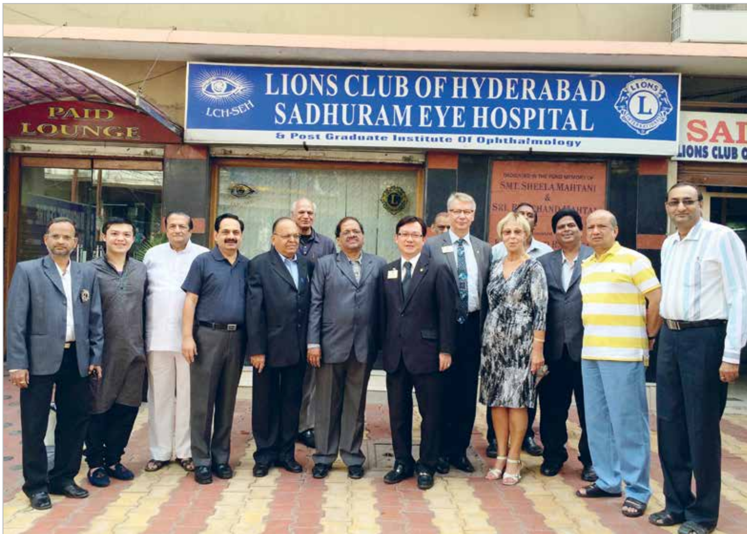
Peale ISAAME Foorumit Nepaalis külaskäik LC Hyderabadidi lionite Silmahaiglasse. India, detsember 2013