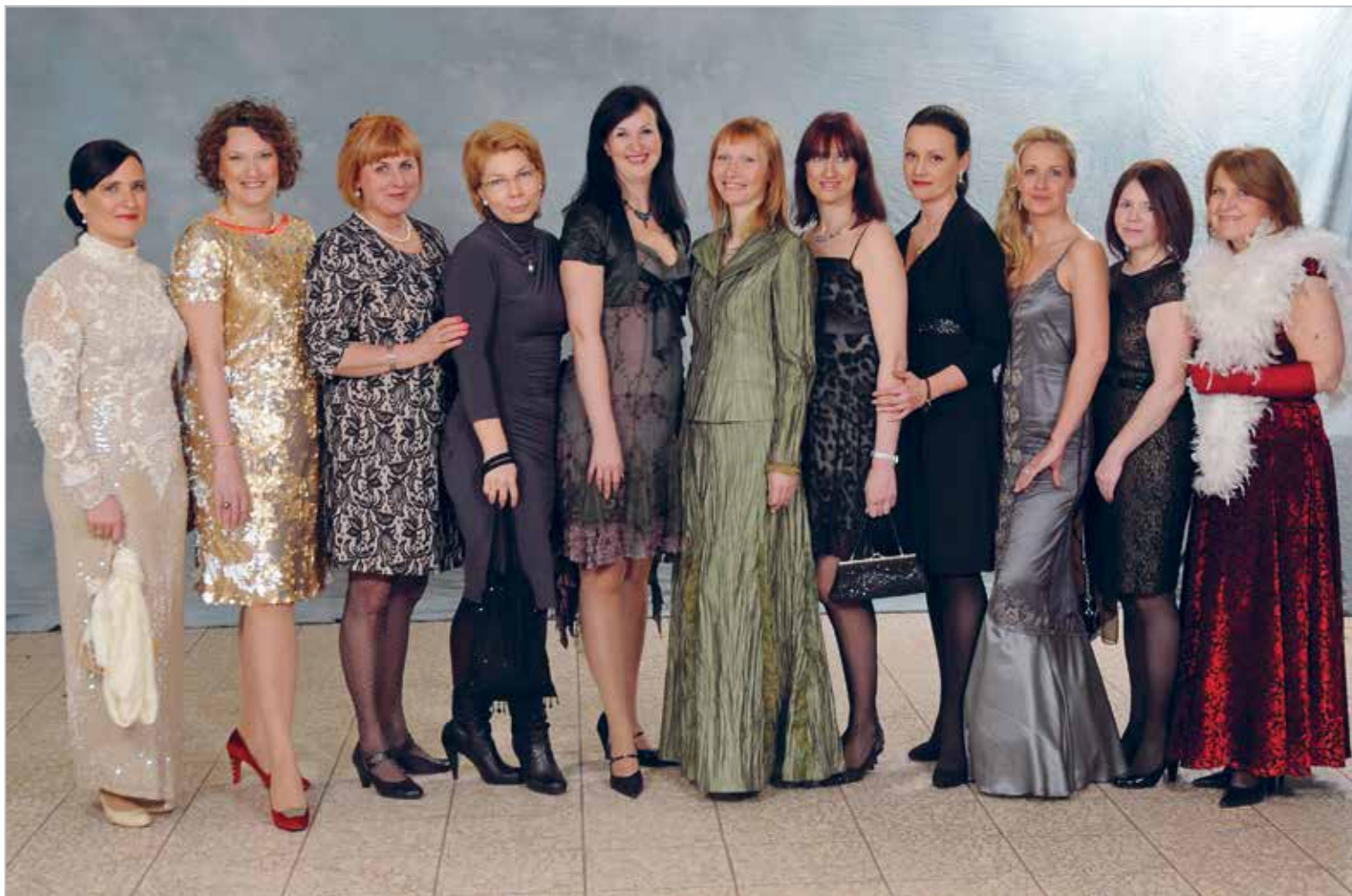
Lions ball – Meie klubi naised 2013. a. lions ballil

Asutamispäev: 20.05.2003 Charter Night: 22.08.2003