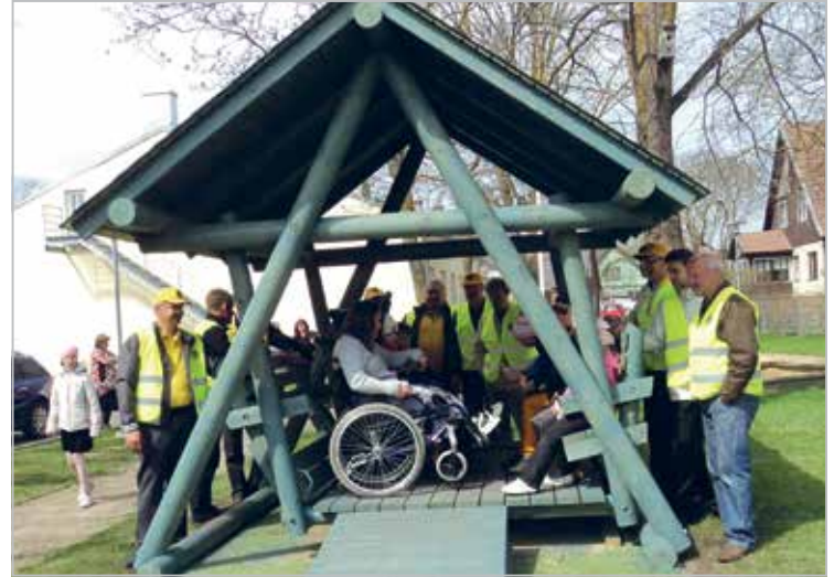
„Lõpuks ometi” Kiik erivajadustega lastele

A swing for children who need special care