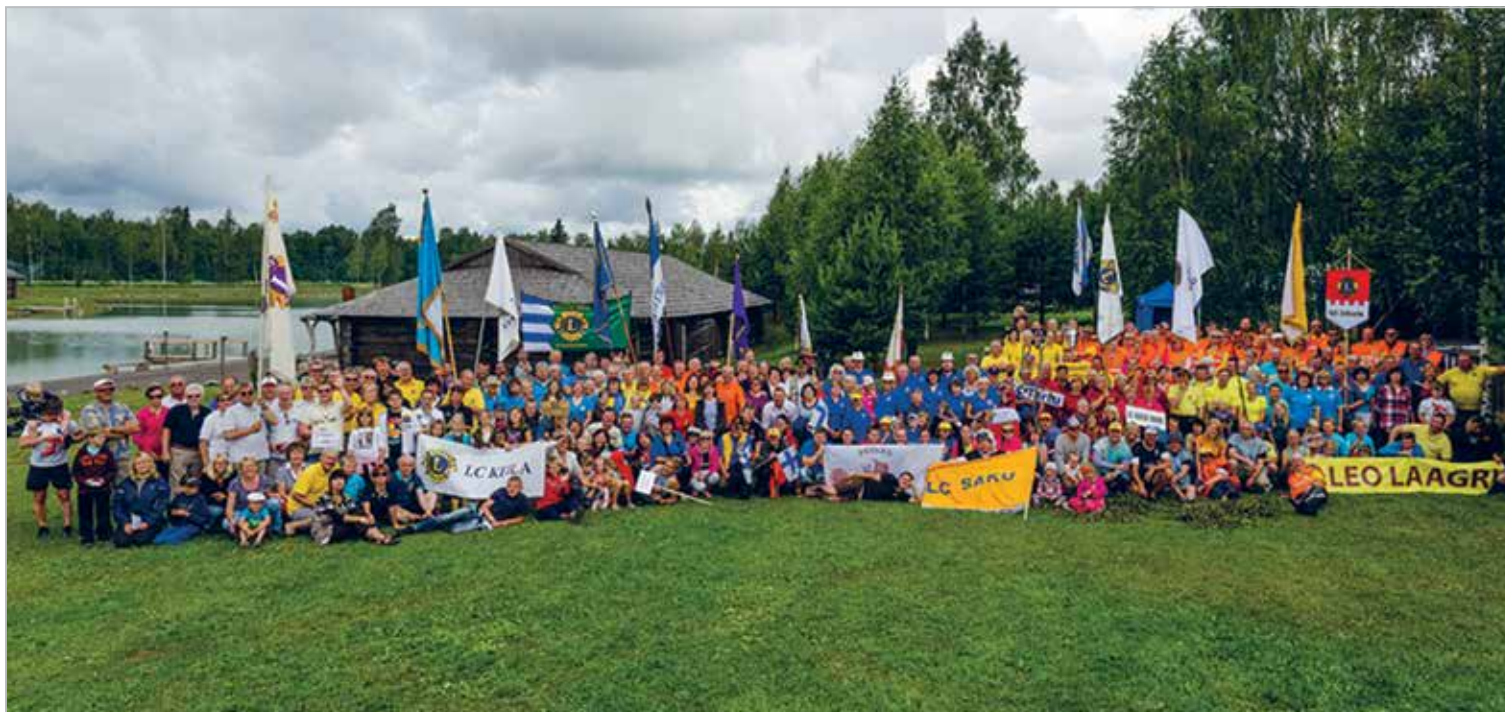
Lions perepäevad Raplamaal Toosikannu puhkekeskuses 20.–22. juuli 2012