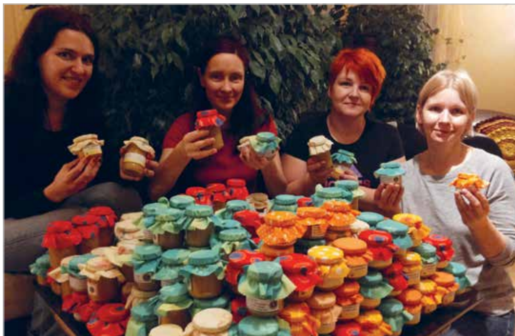
Making 200 jars of mustard on November, 2013