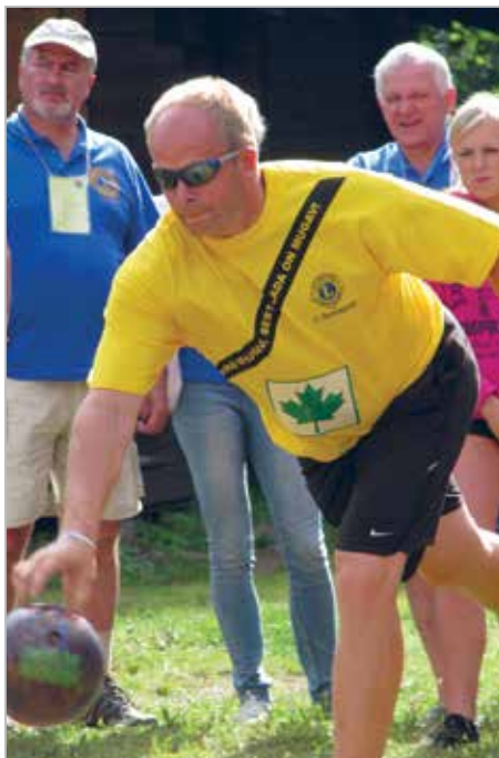
LC Ülenurme suvepäevadel Karepal 2011