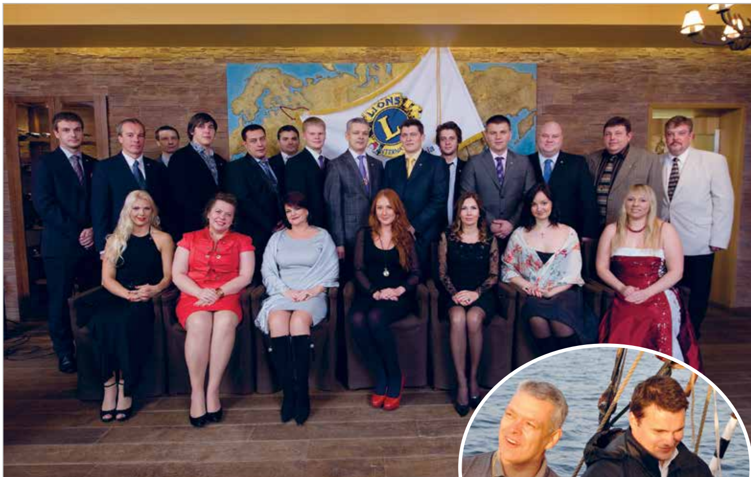
LC Tallinn Meri charter 2012 november

Asutamispäev: 30.05.2012 Charter Night: 04.10.2012