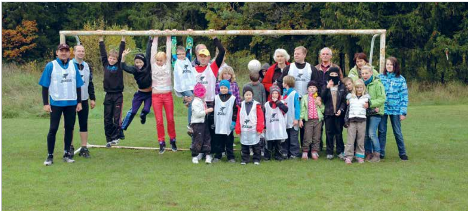
Saku lionid mängivad Haiba Lastekodu poistega jalgpalli