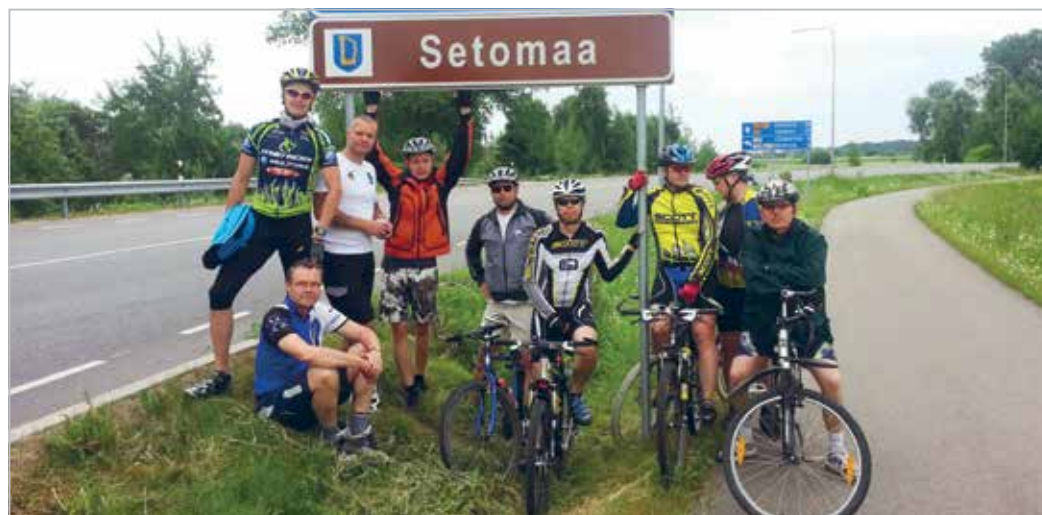
Klubi jalgrattamatk Setumaale 2013