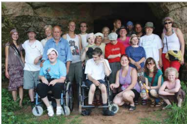
Maarja Küla elanikud väljasõidul Taevaskoja kaunisse loodusesse

The residents of Maarja Village on a trip to Taevaskoja