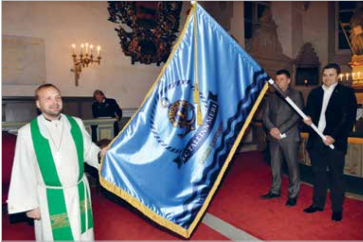
LC Tallinn Meri lipu õnnistamine Tallinna Toomkirikus 2013

LC Tallinn Meri in Tallinn's Dome Church when the flag is being blessed, 2013