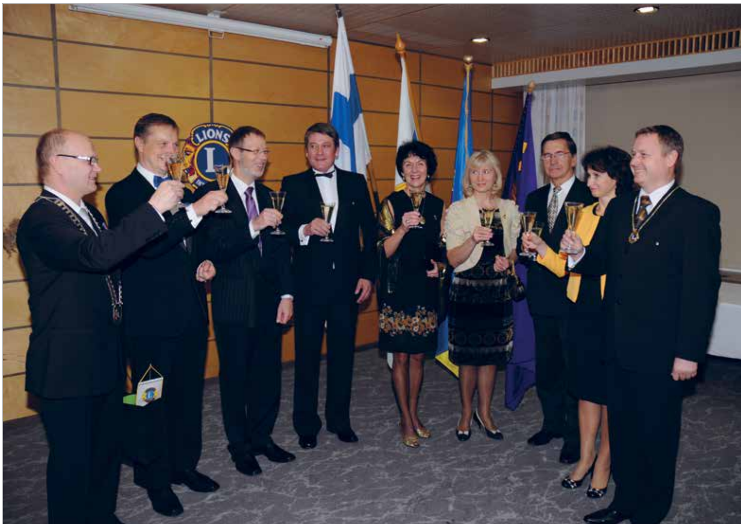
Külas vaderklubil Raumas

Asutamispäev: 15.10.1991 Charter Night: 25.01.1992