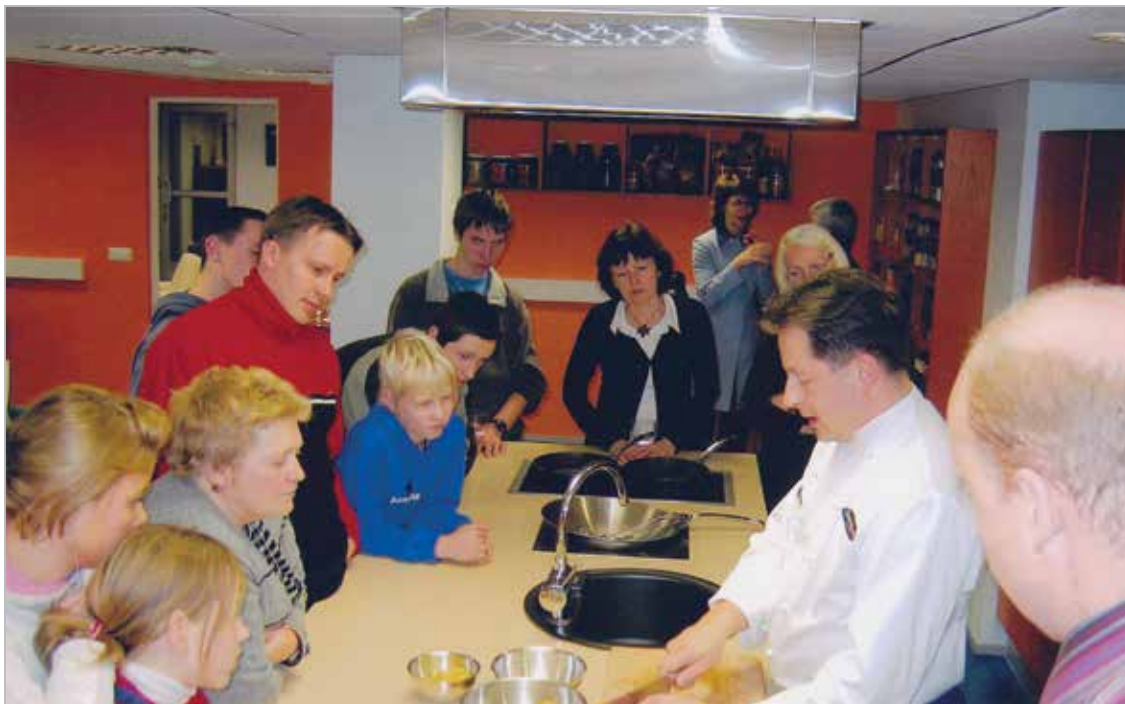
SOS Keila Lasteküla lastega Pauligi tehases

With children from Keila SOS Children's Village at the Pauling Coffee factory