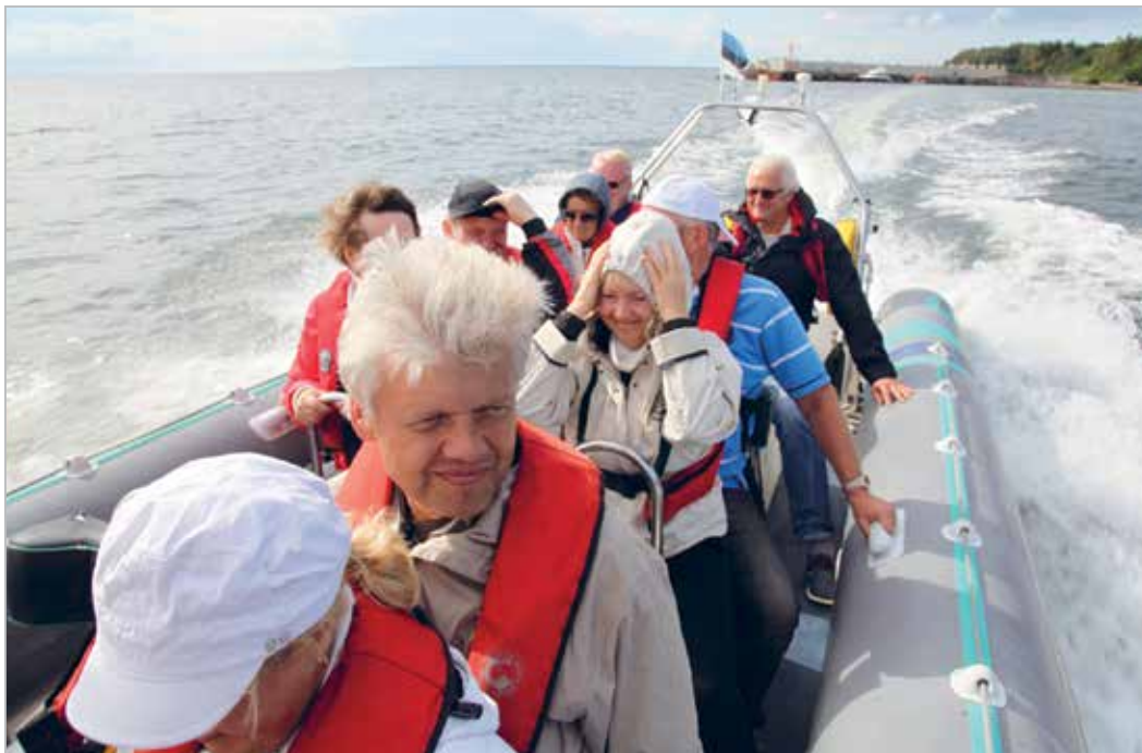
RIBiga sõit Tallinna lahel