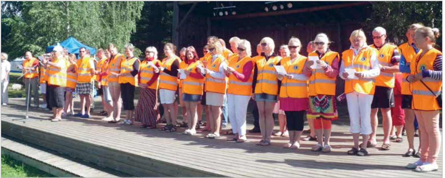
LC Ülenurme klubi lionid koos leedidega Toosikannu perepäevi korraldamas 20.–22. juuli 2012