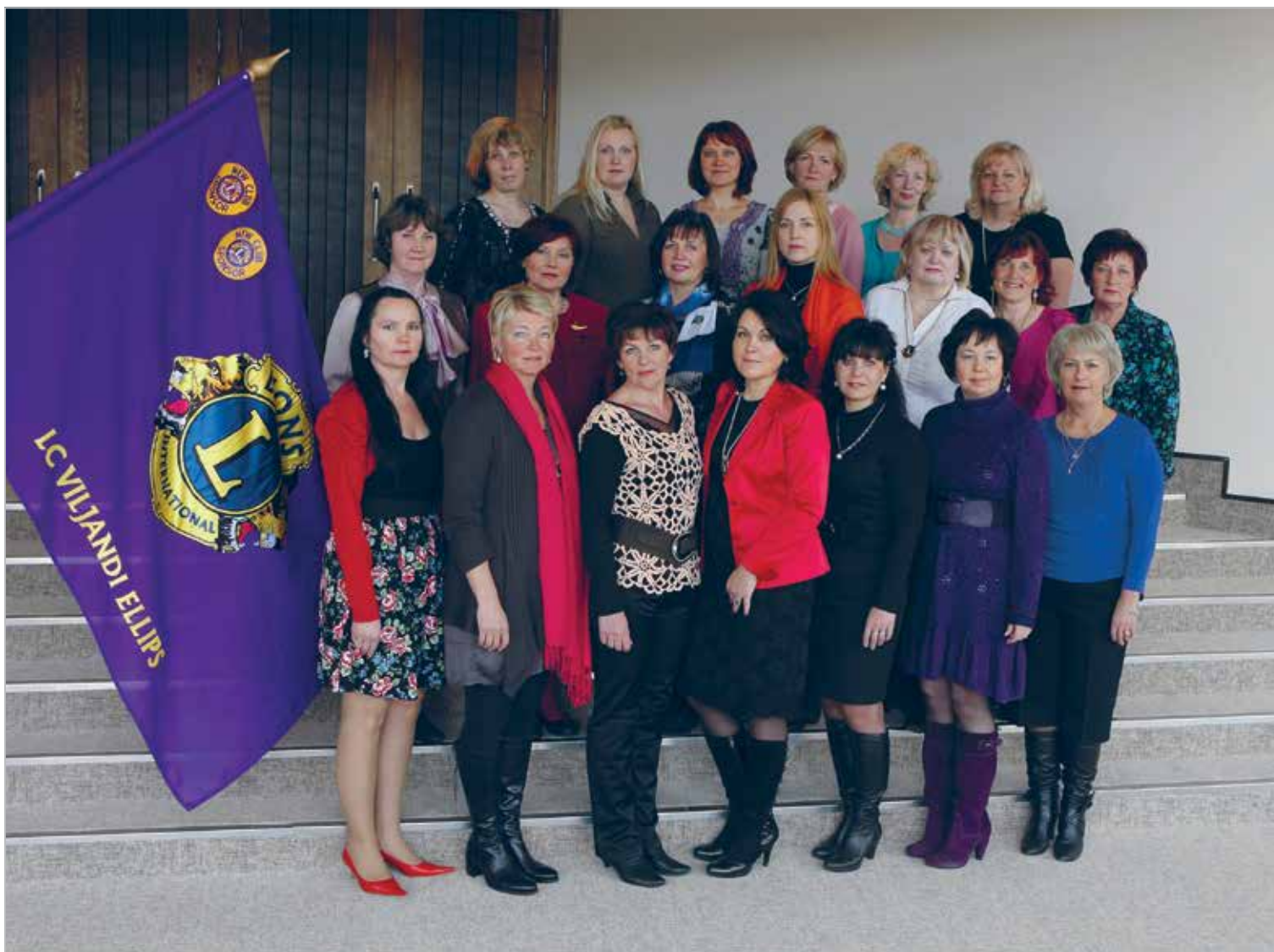
LC Viljandi Ellips leedid klubi 10ndal aastapäeval

Asutamispäev: 30.04.2001 Charter Night: 29.06.2001