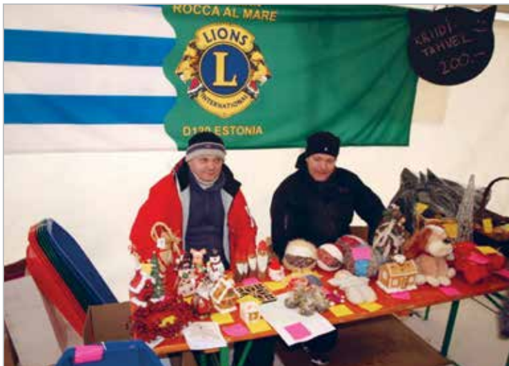
Klubi osalemas LC Tabasalu poolt korraldatud jõululaadal 2010

Club at the LC Tabasalu's Christmas market in 2010