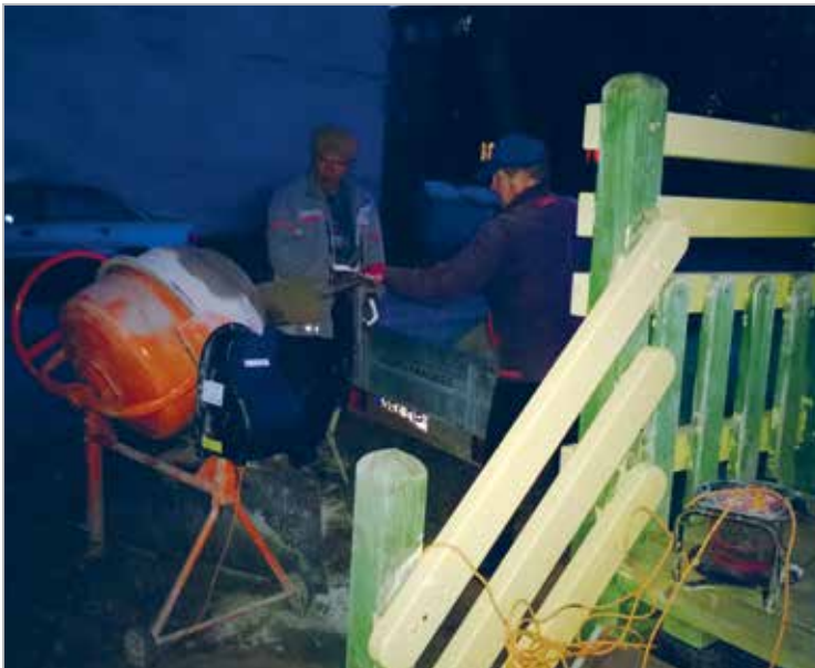
LC Jõgeva liikmed 2013 aasta Heateo Päeval Jõgeva Perekeskuse mängutuba Kraaksupesa õuele liumäge paigaldamas

The members of LC Jõgeva installing the playground slide at the Jõgeva Family Centre Kraaksupesa on the Good Action Day