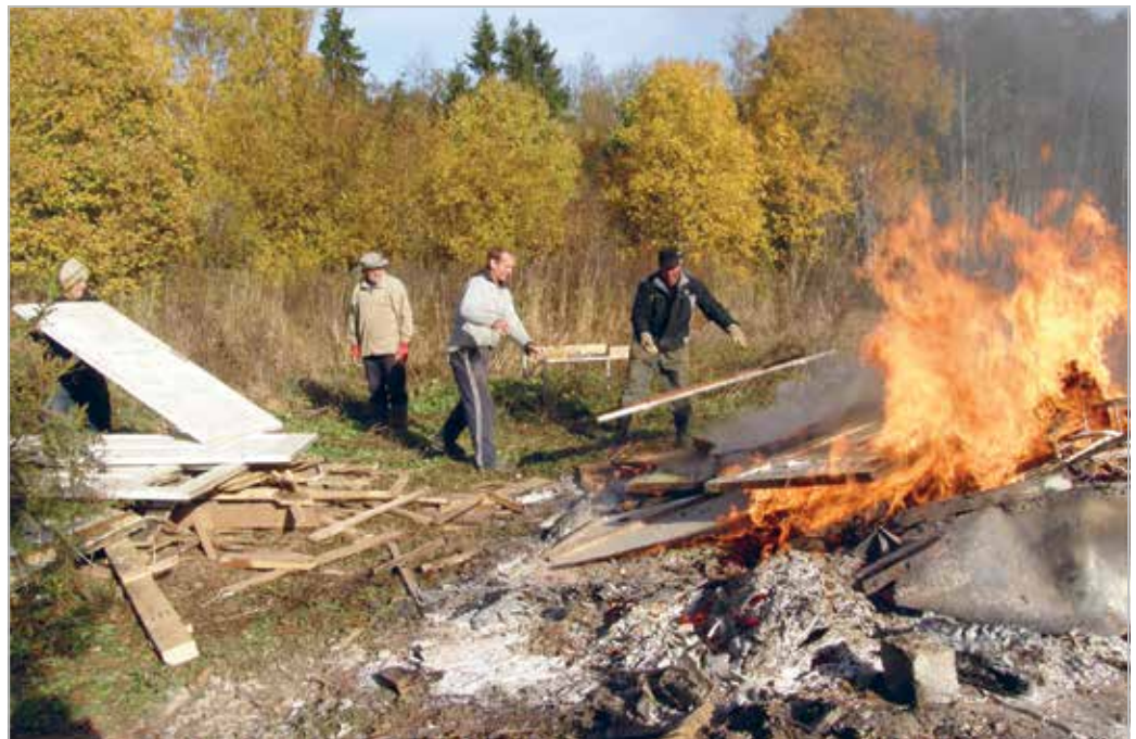
Traditsioonilised heateopäeva tööd Pariisi Erihooldekeskuses

The traditional annual sweep day in Kolga-Jaani Church park