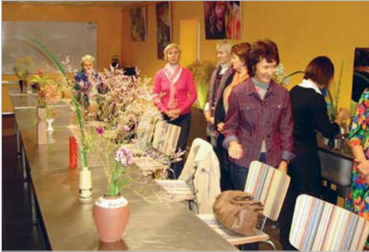
Üritame kaasata oma tegevustesse leedisid. Pildil uhked leedid ikebana koolitusel eksponeerimas oma taieseid

We try to involve ladies to our activities. Here are proud ladies with their artworks in ikebana course