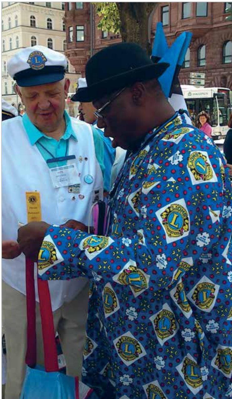
Lionid on sõbrad