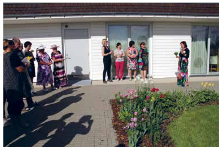
SA Perekodu Mäepeerele Ellipsi naiste poolt rajatud iluaias