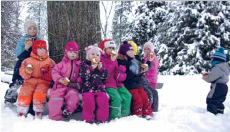
LC Tallinn Meri kostitas Pikavaere lasteaed-alkooli lapsi vastlapäeval kuklitega ja võeti osa sportmängudest. Seesama külastus mõjutas kohalikke niivõrd, et tänaseks on ka seal asutatud oma lionsklubi, LC Raasiku

LC Tallinn Meri on their Benefit day, 2013