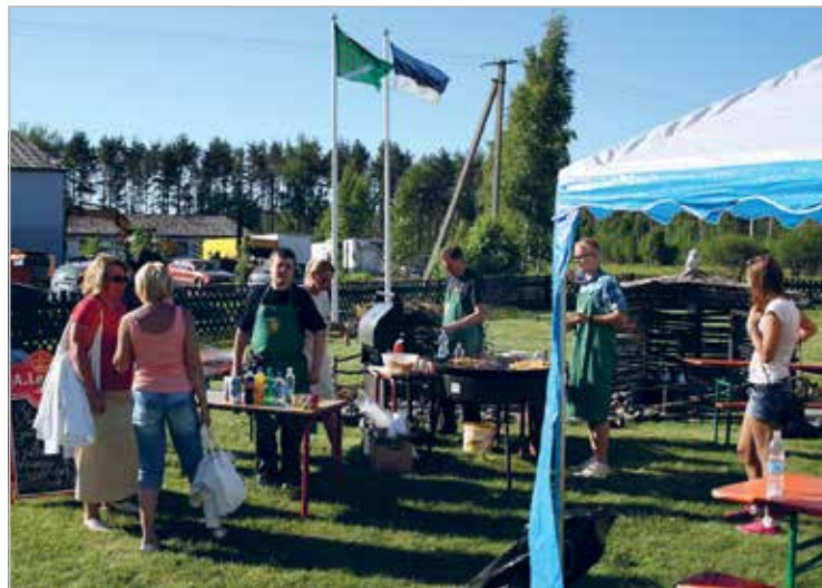
Valla suvepäevadel toitlustamas juuni 2011

Catering at the local parish's sports day, 2013