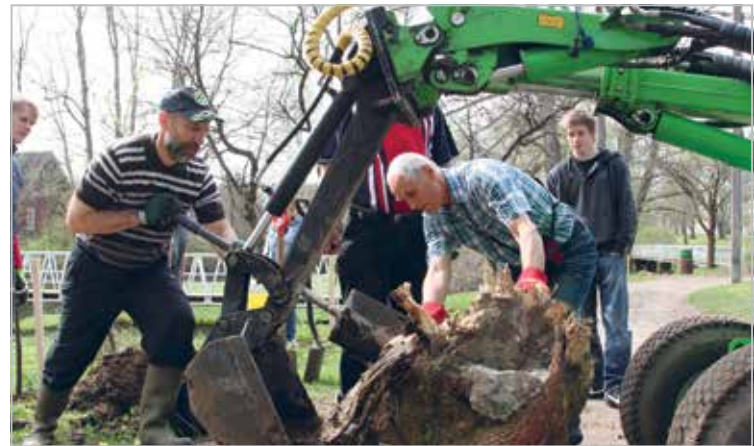
Tublid rapla mehed korrastavad Rapla linna promenaadi

Rapla's Lions with family members planting trees in the city promenade on May 11th, 2013. 18 Virginia bird cherries were planted