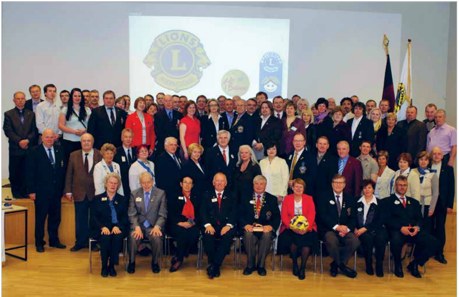
Aastakoosolekust osavõtjad 28.04.2012. a. Audentese Erakoolis Tallinnas