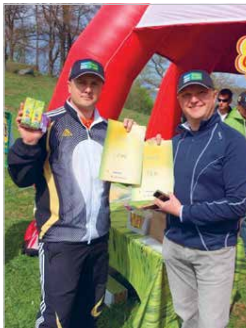
Rulluisumatk Haabersti linna-osa koolilastele. Fotol kaks lionit-korraldajat. 2012

Cleaning Kakumäe coastal area during the Let's Do It cleanup campaign in 2011