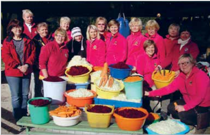
Klubi igasügisene traditsioon – Maarja külas hoidiseid valmistamas

Every year tradition – preparing preserves in the Maarja Village (home to 33 young adults with learning disabilities)