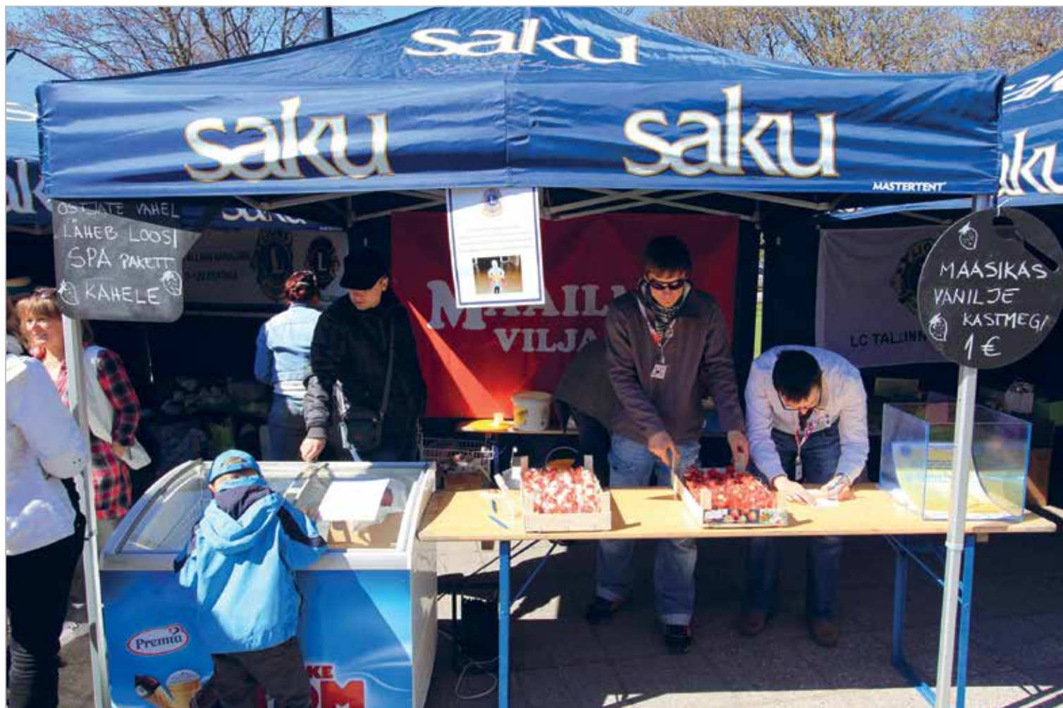
Heateopäev (2011): Klubi liikmed müümas linlastele jäätist ja maasikaid 2011. a toimunud Heateopäeval. Päikeseline päev andis positiivset energiat ja oli klubile väga edukas