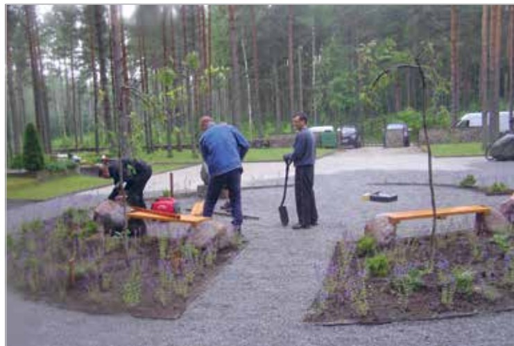
Pinkide paigaldamine Paikuse surnuaiale 2012. a. suvel, töö on täies hoos

Installation of benches in Paikuse graveyard in 2012