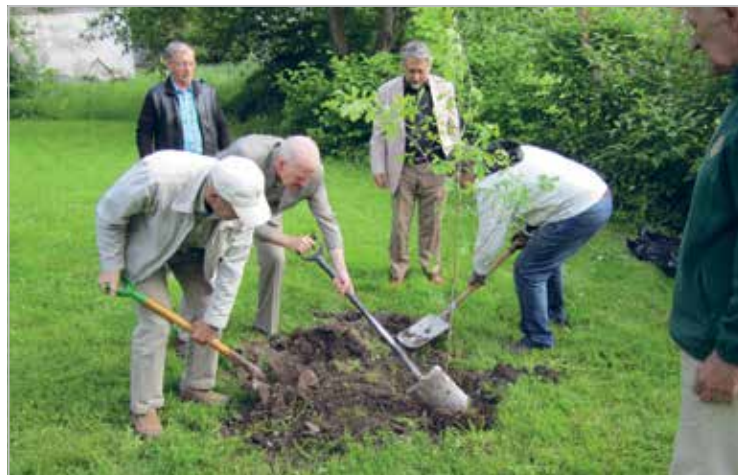
Tammede istutamine Saue Mõisapargis LC Saue 15. aastapäeval, 12.06.2012

Norway received an aid shipment, preparation to scattered distribution 02/12/2010