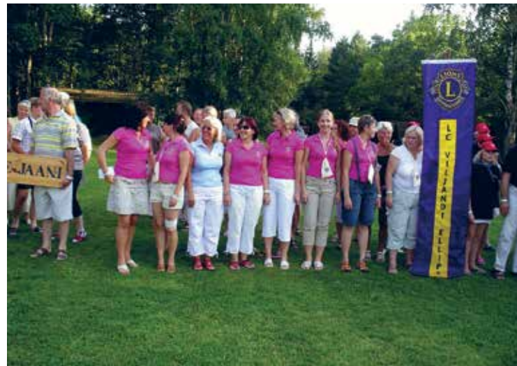
Karu järve ääres 2007. Meie suvepäevad on alati toredad ja sisukad Ikka leidub neid, kes jõuavad kõikjale ja see on vahva!