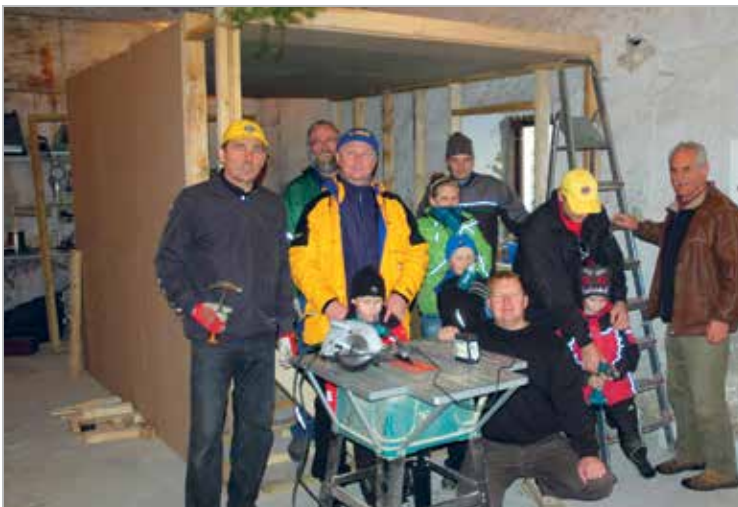
LC Saku ehitas Haiba Lastekodule tööruumi

LC Saku built a work room for Haiba's Children Home