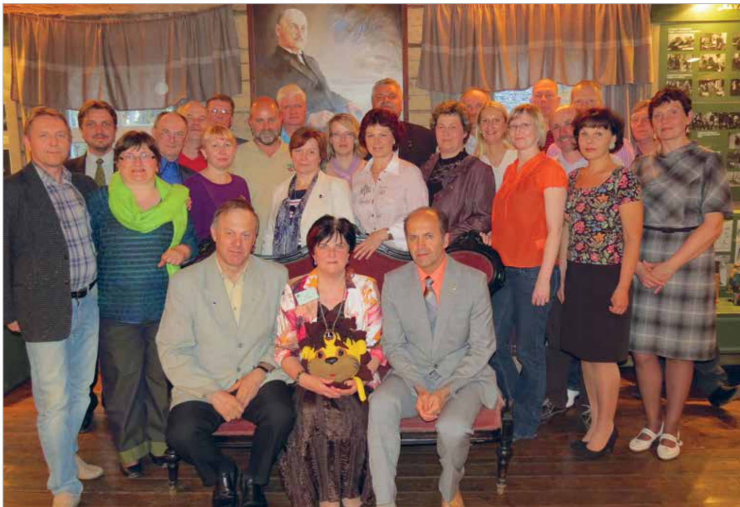
Koos heade sõpradega Tabivere klubist tähistasime Palamuse Kihelkonnakoolimuuseumis meie klubi 13. sünnipäeva