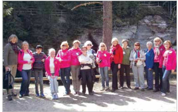
Koos sõprusklubi LC Husumi (Saksamaa) lionitega Taevaskojas veel enne Neitsikooa sisselangemist

Every year tradition – preparing preserves in the Maarja Village (home to 33 young adults with learning disabilities)