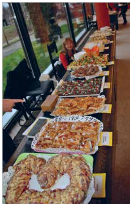
Baked cookies by LC Viljandi Ellips ladies on Viljandi's Theatre Day! Earned money is used to support orphanages