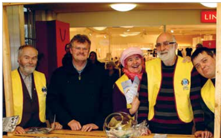
Lõvikampanial kaubamajakas, november 2009