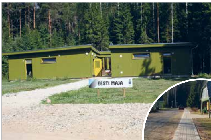
Eesti maja on ehitatud Eesti lionite ja rotariaanide kogutud rahaga

The Swedish house has been built for the money saved up by the Swedish Lions