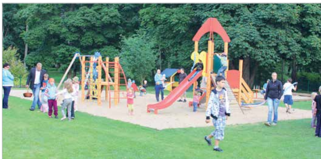
LC Saku ehitas Sakku kaasaegse mänguväljaku ja rularambi

LC Saku built a contemporary playground and a skating ramp to Saku