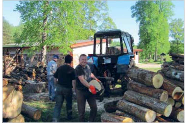
Ulatamas abikätt puude lõhkumisel Maarja külas

We try to involve ladies to our activities. Here are proud ladies with their artworks in ikebana course