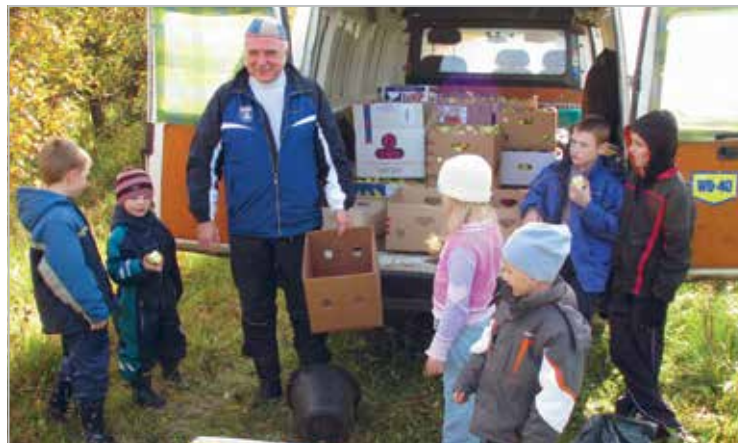
Kristliku Noortekodu lastega iga aastasel õunte korjamise aktsioonil

Annual flag ceremony in Tartu's City Hall Square. The flag of LC Tartu Tamme has been there since the beginning of the club, meaning for more than 20 years