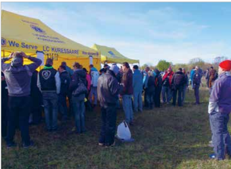
„Abiks ikka” Heateo päeval rallihuvilisi toitlustamas

A swing for children who need special care