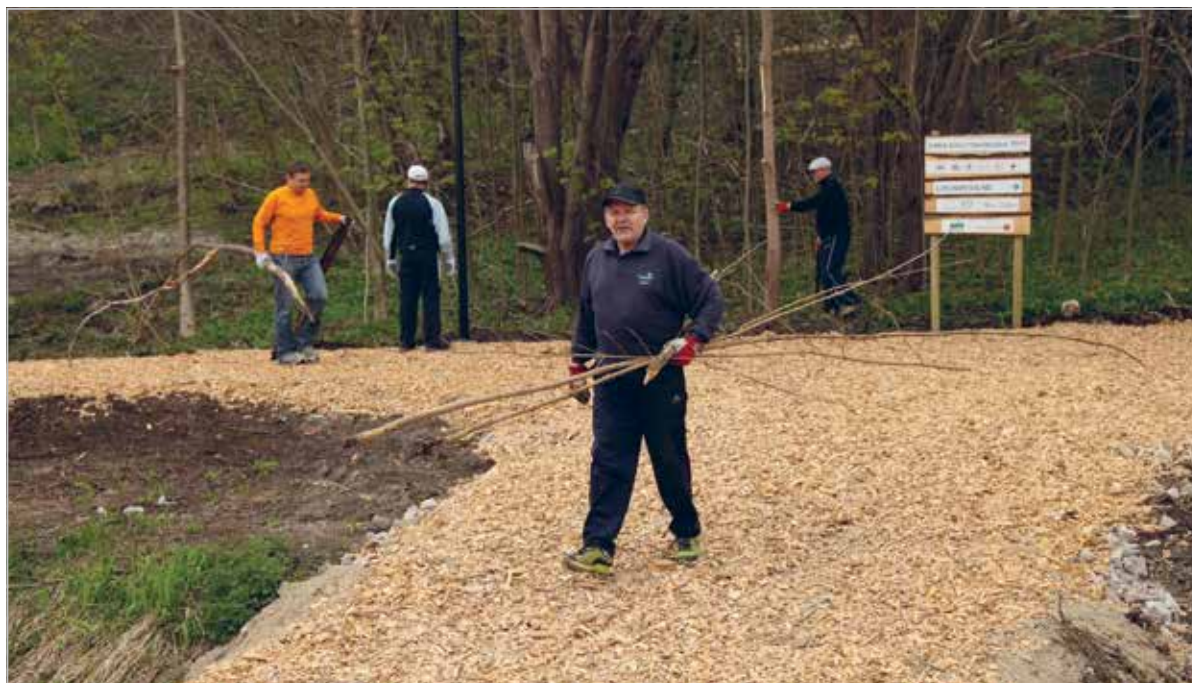
Haabneeme terviseraja koristustalgutel

Cleaning up a walking track at Haabneeme