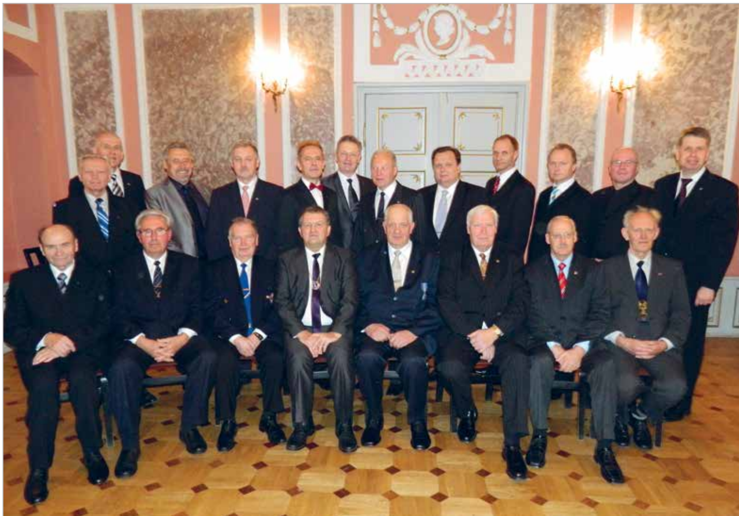
LC Saue liikmete ühispilt

Asutamispäev: 12.06.1997 Charter Night: 01.11.1997