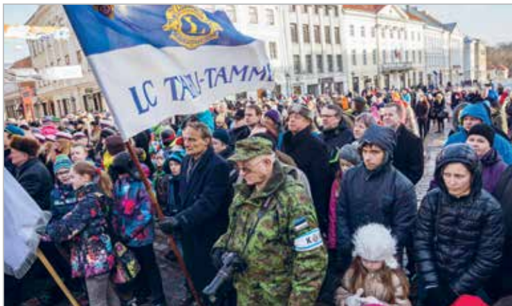
Iga aastasel lipu heiskamise tseremoonial Tartus Raekoja platsil. LC Tartu Tamme lionite lipp on lehvunud lipu-tseremooniatel alates klubi loomise algusajast enam kui 20 aastat tagasi

Annual flag ceremony in Tartu's City Hall Square. The flag of LC Tartu Tamme has been there since the beginning of the club, meaning for more than 20 years