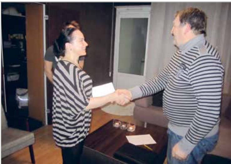
Pereisa kaotanud kolmelapselisele perele toetuse üleandmine 16.12.2012

At Planting of dams at Saue Manor Park on the LC Saue 15th anniversary, 12/06/2012