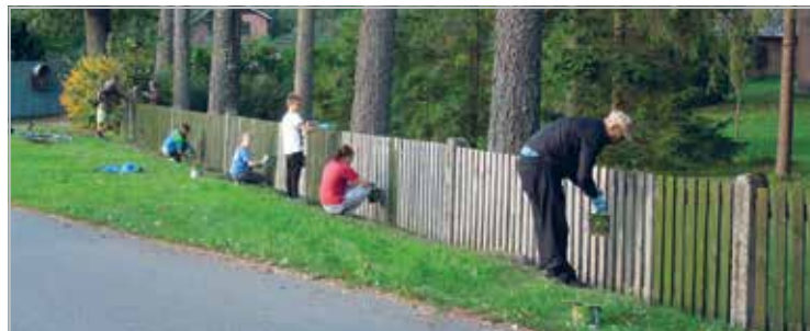
Värville Valtu koolimaja aeda