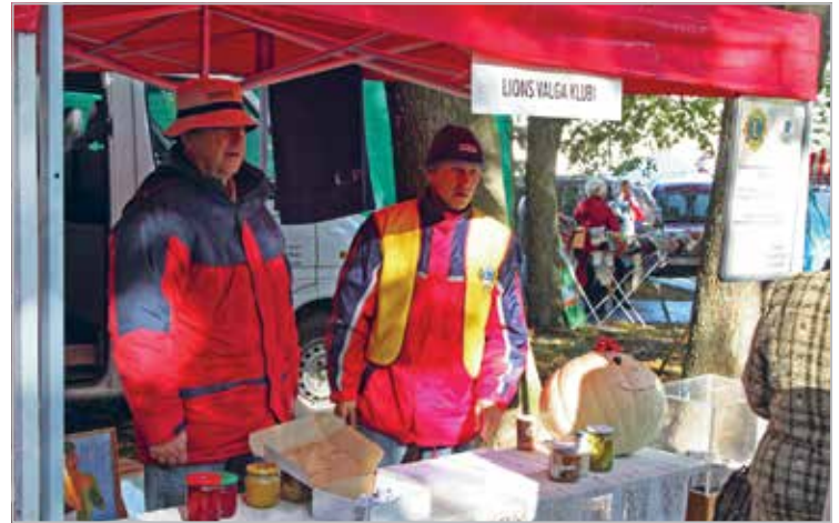
Heategevuseks tuleb ka vahendeid hankida. Klubiliikmed kauplemas Liivimaa laadal

Before having the longest slide, according to the Estonian tradition, children compete at the tug of war