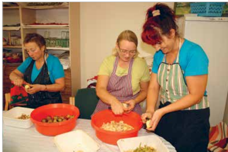
LC Tähtvere lionid talvehoidiseid valmistamas

LC Tartu Toome organised for children a trip to Tartu Eeden bowling hall