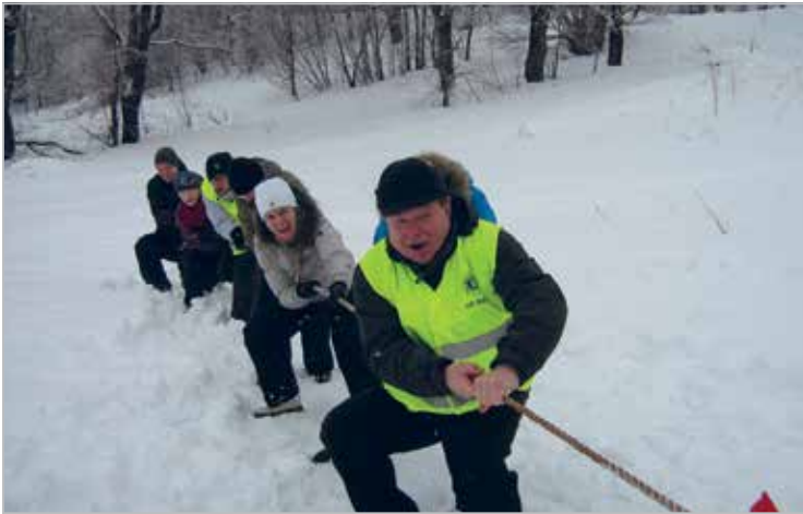
Enne liulaskmist proovitakse eesti kombe kohaselt jõudu kõieveos

Kadrid (children, disguised according to the traditions of St Cathrine's Day) are performing in the hall of Valga Music School