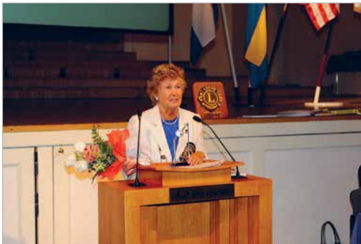
Piirkonna juubelikoosolek Estonia kontserdisaalis 16.05.2009 District's jubilee meeting in Estonia's concert hall