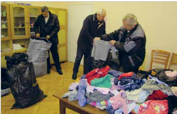
Norrast saabunud abisaadetise laialijagamise vahendamine 02.12.2010

Norway received an aid shipment, preparation to scattered distribution 02/12/2010