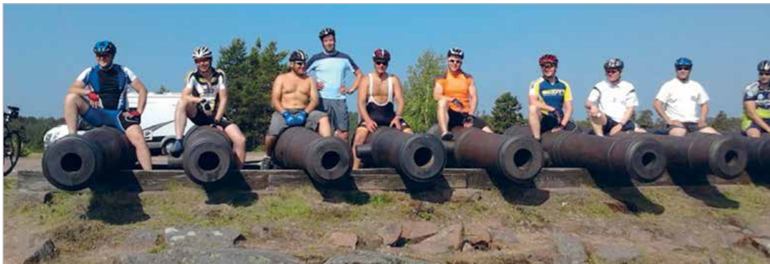
Klubi jalgrattamatk Ahvenamaale 2011