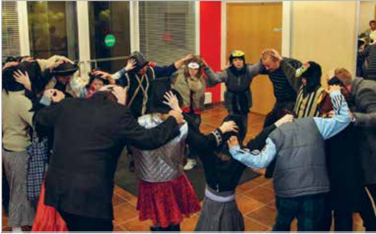
Mardid mänguringis Valga päästekeskuse uues hoones

Mardid playing in the new building of Regional Rescue Board in Valga