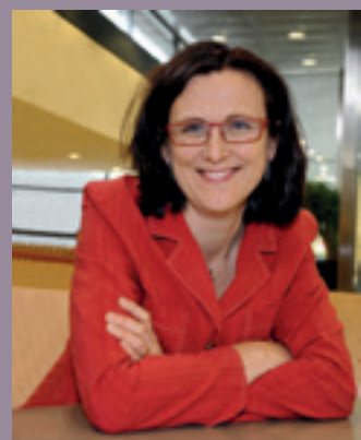
Cecilia Malmström, Euroopa Komisjoni siseküsimuste volinik

Selleni jõudmiseks on läbitud pikk tee, kuid meie töö ei ole veel lõpule viidud. Meil on vaja palju pingutada, et õigusaktid saaksid rakendatud ja et ühine süsteem töötaks kõikjal ühtmoodi hästi. Vaid siis saavutame oma nime väärilise kaitse ja solidaarsuse ala, mille üle võime uhked olla.