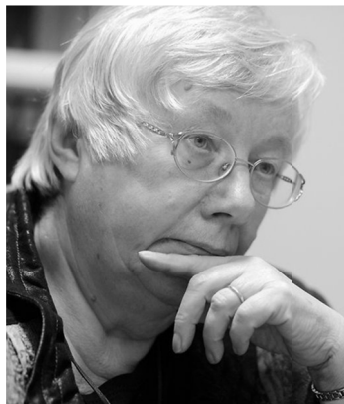
Professor Marju Lauristin

Korraldustoimkond soovib teile kõigile sisukaid arutelusid sessioonidel, mõnusaid hetki Toomemäel ja inspireerivaid mõttevahetusi kolleegidega nende kahe päeva jooksul.