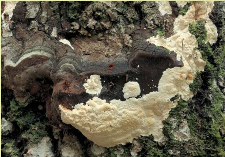
Haavanäätsu kreemika värvusega liibuvaid viljakehi võib leida vanadelt haavataeliku viljakehadelt.

Eestist on leitud tuhandeid seeneliike, suur osa neist on seotud metsaga. Kõige arvukam metsaga seotud seenerühm on puidul elavad torikseened. Ehkki torikseened lagundavad puitu ja põhjustavad seeläbi majanduslikku kahju, on neil ökoloogilises ainerings oluline roll. Teine suur rühm torikseente kõrval on lehikseened, kellest palju liike elavad metsapuu-dega sümbioosis ehk vastastikku kasulikes suhetes. Lehikseente hulka kuulub ka rohkesti tuntud söögiseeni, näiteks riisikad, pilvikud ja kukeseened. Lisaks meil küllalt tavalistele seeneliikidele leidub mõlemas rühmas ka haruldusi, neist osa on võetud looduskaitse alla või kantud Eesti ohustatud liikide punasesse nimestikku. Looduskaitsealuseid seeni on meil 46 liiki, millest enamik elab metsades.