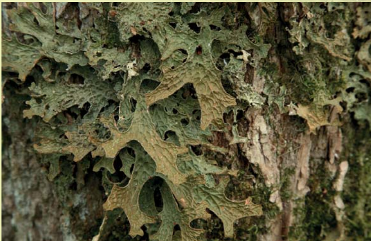
Harilikku kopsusamblikku kasutatakse põlismetsade ja vääriselupaikade indikaatorliigina.

Samblikel on metsaökosüsteemides mitu olulist rolli, näiteks on nad elupaigaks putukatele ja teistele selgrootutele ning linnud kasutavad neid sageli pesamaterjalina. Eri samblikud vajavad kasvamiseks erinevaid niiskus- ja valgustingimusi, mistõttu sõltub nende liigiline koosseis peamiselt metsatüübist ja domineerivast puuliigist. Teisalt võib mõne liigi esinamiseks olulisem olla hoopis mikroelupaiga olemasolu, näiteks elusa puu korbapragu, tüügaspuu ja kännu kõdunenud puit või hoopis mahakukkunud puuoks. Osa samblikke vajab aga kasvupinnaks koguni söestunud koort ja puitu, näiteks männi-soomussamblik, kes asustab meil vanu metsapõlengualasid. Üldiselt on samblikufloora rikas ja eriilmeline just mitmesugustes looduslähedastes metsades. Näiteks lodumetsades, kus on sobiv niiske mikrokliima ja mitmekesine kasvusubstraatide valik eri nõudlusega liikidele. Haruldasi samblikke esineb ka laialehistes salumetsades, kus puutüvede alumises osas kasvavad varjutaluvad (sageli koorikja tallusega), ent ülaosas valguslembesed (peamiselt lehtja tallusega) liigid. Põnevaid liike võib leida haavikutestki – mitmed tsüanobakteriga samblikud kasvavad just vanade haabade korbal, näiteks mustja tallusega haava-tardsamblik.