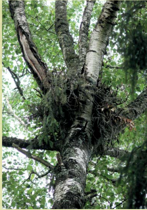
Risupesa – võimalik haruldase linnuliigi elupaik.