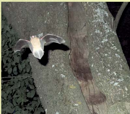
Pargi-nahkhiir ja tema varjupaik.

Lisaks suviste varjupaikadele vajavad nahkhiired toitumisaiku. Mõlemad paigad on võrd- selt vajalikud – kui piirkonnas üks neist hävib, on nahkhiired sunnitud lahkuma. Näiteks saavad nahkhiirekolooniad kasutada varjupaigana metsa servas asuva hoone (nt endise metsa- vahimaja) voodrilaudade aluseid tühemikke ning lennata sealt öösel metsa toituma. Lage- raiete tõttu võib ümbruskond nii palju muutuda, et nahkhiired seda enam toitumisaigana kasutada ei saa. Nahkhiired nimelt pelgavad lagedate alade ületamist. Siin on liikidel erinevad nõudlused ja uurimata on, kas mõnedel meie liikidel oleks säilikuudest kasu toitumisaiga või liikumiskoridori säilitajatena. Küsimus on ka selles, kui palju ja kuhu täpsemalt peaks säilikuuid jätma, et vähemalt osale nahkhiireliikidele säiliks toitumisaik või lennukoridor selleni. Isegi umbes saja meetri laiune raiesmik võib muutuda nahkhiirtele häirivaks takistuseks. Toitumisaigad ei saa asuda varjupaikadest ka liiga kaugel, sest lühikese suveöö ajal ei saa nahkhiired kulutada liiga palju aega toitumisaika jõudmisele ja sealt naasmisele. Siiski vajab mitu nahkhiireliiki toitumiseks küllaltki avatud lennupaiku. Tihe ühevanuseline ja üheliigiline majandusmets neile ei sobi. Nahkhiirte toitumisaiga kvaliteeti parandavad sel juhul häilud ja väikese pindalaga raielangid (0,5...1 ha). Võimalusel tuleb lageraiele eelis- tada turberaieid ja valikraiet.