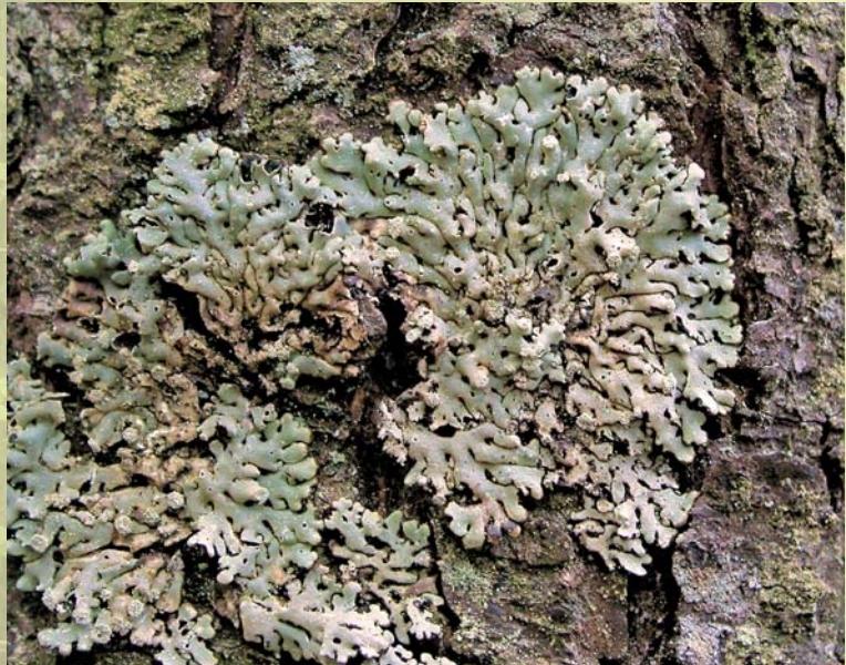
Harilik poorsamblik kasvab vanades ja kuivendamata lodumetsades.

Ehkki liik on Eestis veel üsna sage, on selle asurkonnad väikesed, kasvukohad üksteisest eraldatud ning kopsusamblikku ohustab pidev sobivate elupaikade kadumine. Vanade ja kuivendamata lodumetsade indikaatorliigiks peetakse aga harilikku poorsamblikku. Ta kasvab peamiselt sanglepal ja kaskedel ning on Eestis märgatavalt haruldasem kui kopsusamblik. Poorsamblik on väljanägemiselt sarnane meil väga tavalise hariliku hallsamblikuga. Kahe liigi hea eristustunnus on väikesed augukesed poorsambliku talluse pinnal – sellest tulenebki tema nimi.