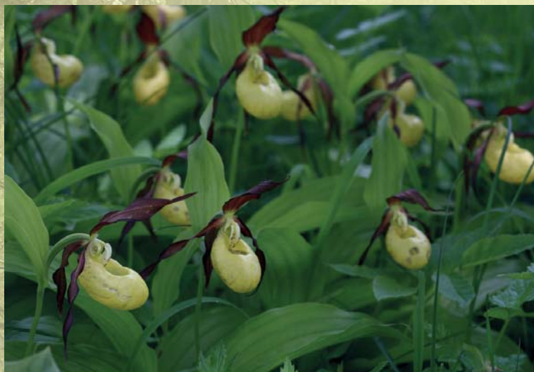
Kaunis kuldking kasvab sageli kinnikasvanud puisrobumaadel

Soostunud ja soometsades kasvab haruldasi eri liiki tarnu ja kõrrelisi, kuid nende määramine on tihtipeale keeruline. Väärtuslikust soometsast annavad teinekord märku ka erinevad orhideeliigid: kuradi- ja vööthuul-sõrmkäpp, kõdu-koralljuur, väike käopõll. Allikalistele aladele viitavad allakäändunud latvadega jässakad kuused, Lõuna-Eestis ka osjadega sanglepikud ja kaasikud, kus mätaste vahel läigib roosterikast, justkui õlist vett. Sellistelt aladelt puude maharaiumist peaks kindlasti vältima, sest seal leidub erinevatest elustikurühmadest haruldusi.