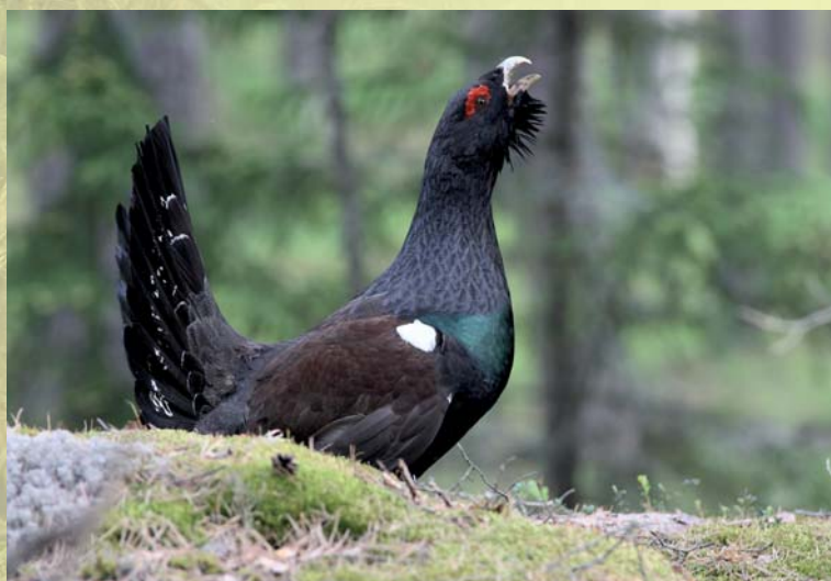
Metsise kaitseks on moodustatud rohkesti püsiehupaiku.