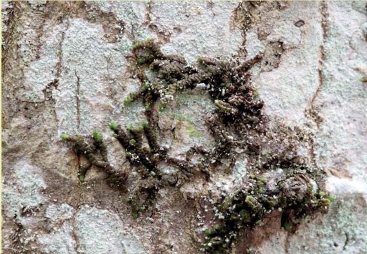
Harilik kariksammal on harunenud võsudega tumepruun sammal.