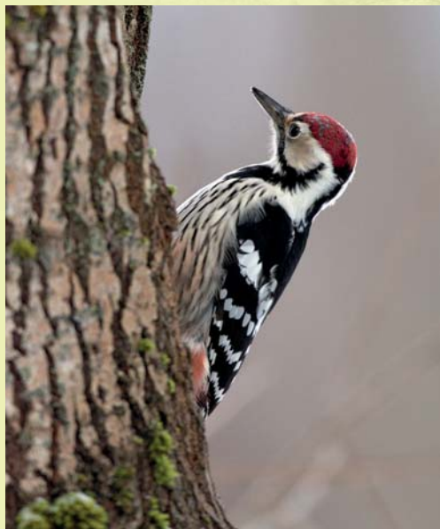
Valgeselg-kirjurähn rind on triibuline ja selg kirju.