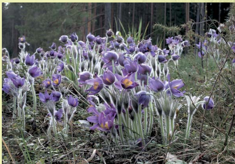
Pahu-karukella bea käekäigu tagab asjatundlik metsade majandamine liigi kasvualal.

Metsas kasvab ka haruldasi taimeliike, kõige suurem osa neist on seotud kunagi tihti toimunud maastikupõlengutega. Sellised liigid vajavad valgusrikkaid ja liivaseid kasvukohti, raiele nad otseselt väga tundlikud pole, küll aga ei elaks nad üle raiejäanuste alla mattumist. Sellised tundlikumad liigid on karukold, vareskollad, nõmmnelk, käokuld, võsu-liivsibul, karukellad. Viimaseid võib leida ka valgusrikkastel paekivialadel.