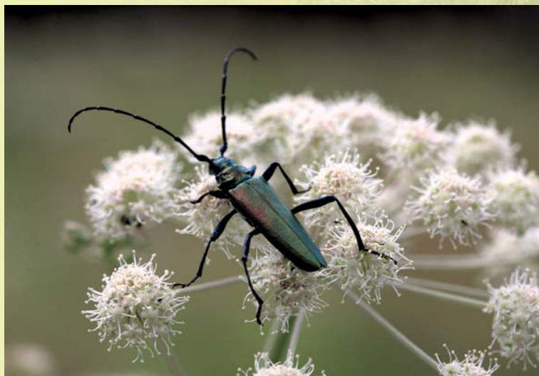
Paljusid suuri puidus elavaid siklasi võib paarilise otsimise ajal leida ka lehtedelt ja õitelt. Pildil muskussikk.

Kui sipelgate pesakuhilad välja arvata, ei hakka selgrootud loomad oma väiksuse tõttu metsas silma, kuigi nad ületavad kogumassilt suurte lindude ja imetajate hulka ning mõjutavad oma elutegevusega metsa tervist ja puiduvaru rohkem kui linnud ja imetajad. Putukad, ämblikud, saja- ja tuhatjalgsed, teod, mitmesugused ussid ja paljud eestikeelse nimetuseta pisiloomad hoolitsevad metsa aineringe eest, muutes taimede ja loomade elutegevusest tekkinud materjali jälle uutele taimedele, sealhulgas puudele, kättesaadavaks toitaineks. Selgrootute liigiline mitmekesisus metsas on väga suur. Tavaline on, et mida väiksemad loomad, seda rohkem liike ja ökoloogilisi rolle neil on. Näiteks ainuüksi surnud puude peal ja sees elama kohastunud mardikaid leidub meie metsades ligi 900 liiki. Iga üksiku liigi praktilist ökoloogilist väärtust on raske tõestada, kuid üldreegel kõlab: mida liigirikkam on mets, seda väiksem on tõenäosus, et mõni liik oma massilise paljunemisega metsapuid ja metsa tervikuna ohustaks.