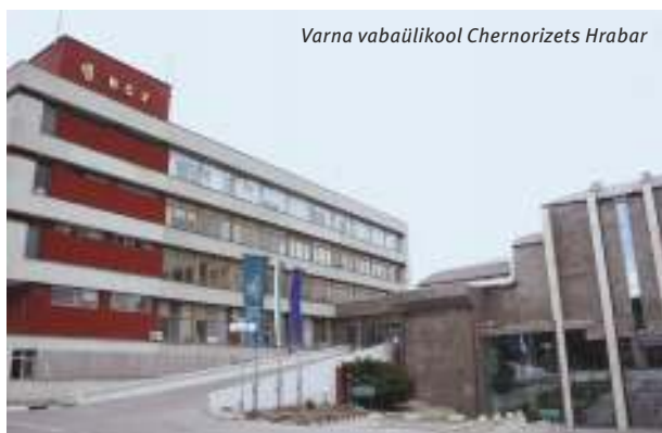
Varna vabaülikool Chernorizets Hrabar