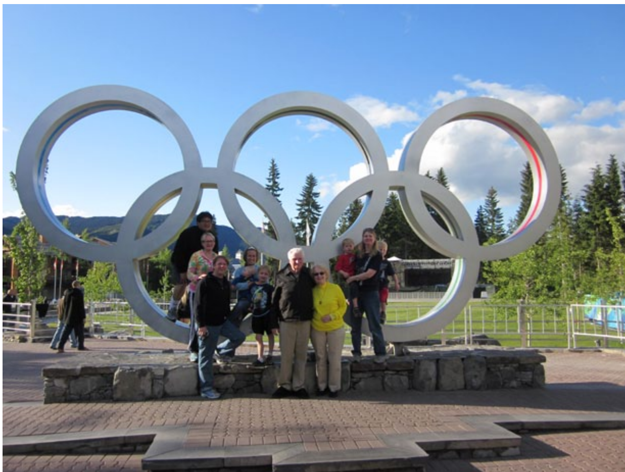
Meie pere Whistleris British Columbias 2011 suvel.