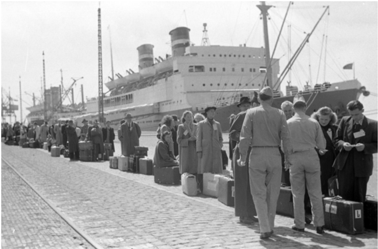
This is how someone photographed our preparation to board a ship to the US.