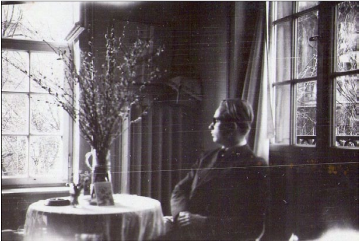
Alexander in Hamburg