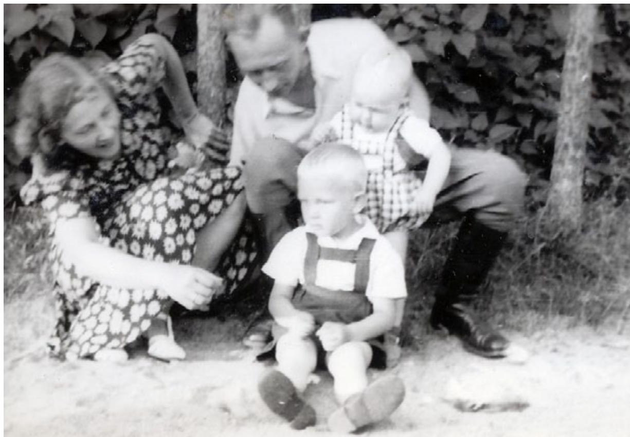
1944.a vahetult enne Saksamaale põgenemist.