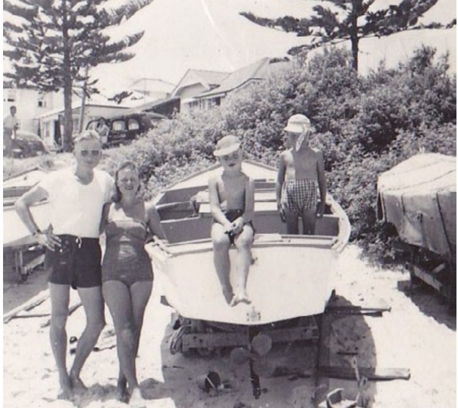
The Sydney beachside suburb of Manly was an idyllic place for raising a family.