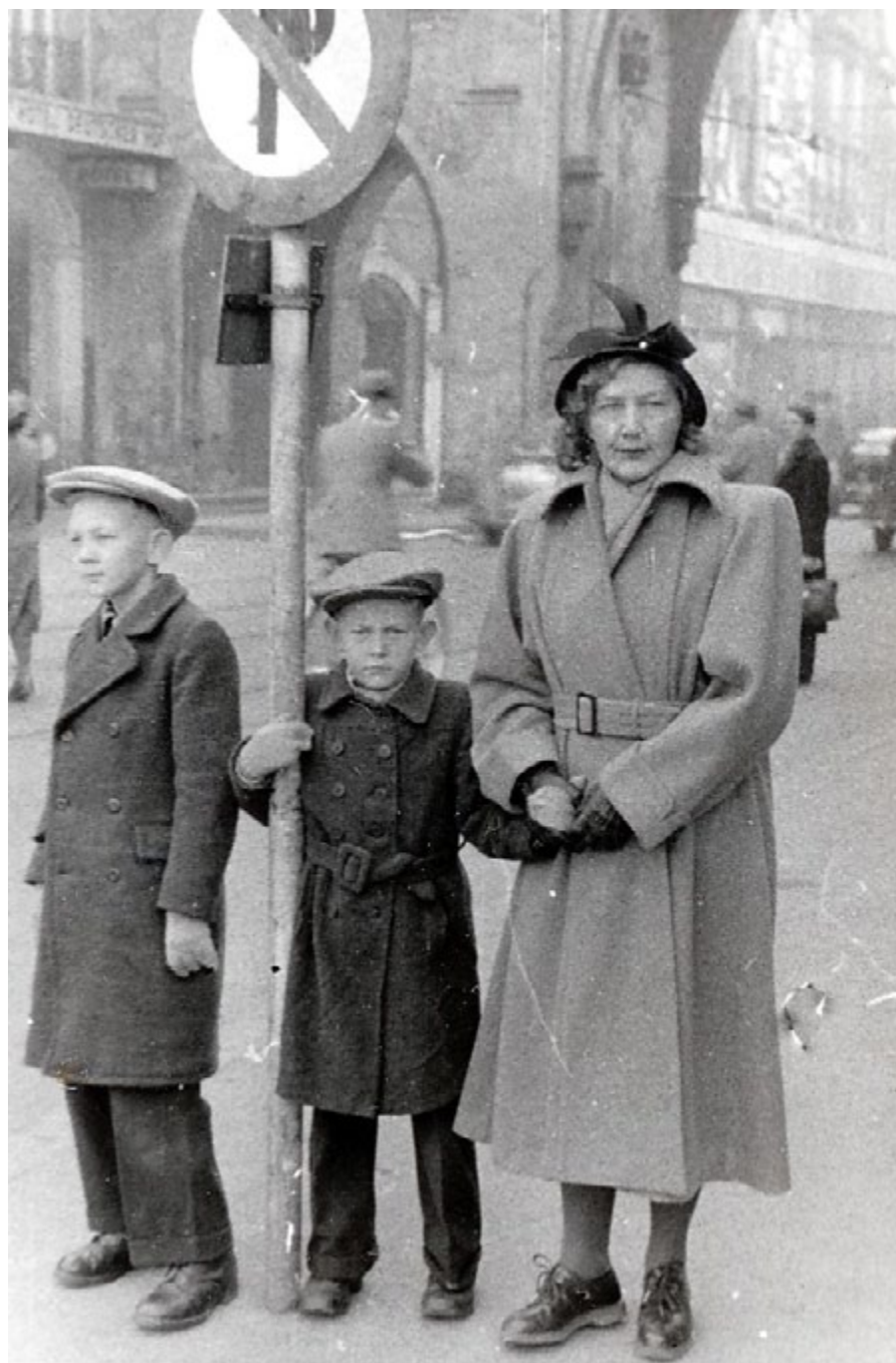
1950.a immigrerusime Rootsi.