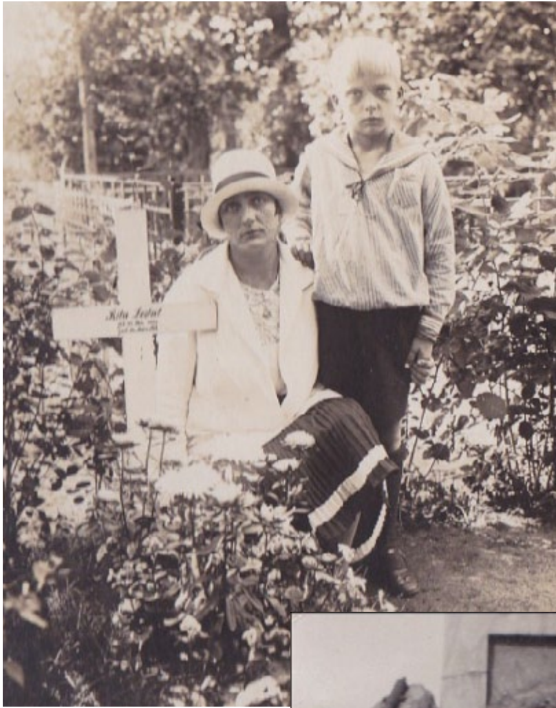
Soviet troops destroyed the Baltic German cemetery where Rita was buried