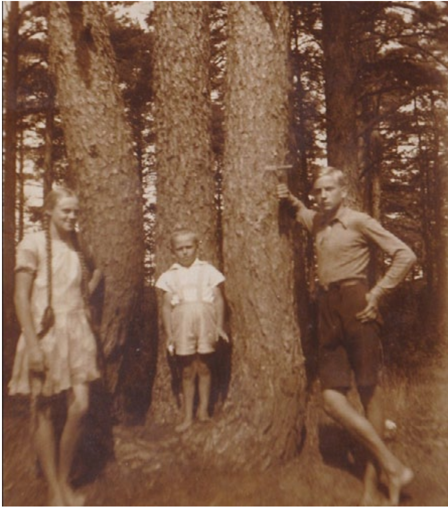
Nature is very dear to all Estonians