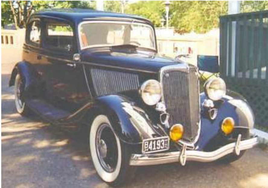
This is a similar 1934 Ford