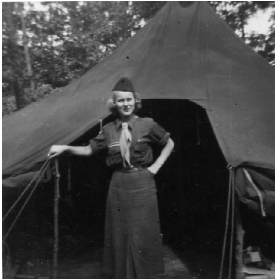
Lakewoodis 1953. Linnutee gaid 1953. a, Lakewood, NJ.

Alhool, New Yorgi Public School 45, Queensi klassilõpetamise pilt 1951. Aire kolmandas reas keskel prillidega.