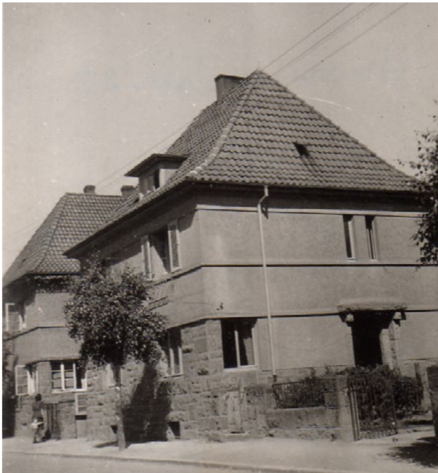
Blomberg 1945. Blombergi DP-laagris. Huxwiede Str. 20. Selles sakslastelt rekvireeritud majas teisel korrusel paremal oli meie kodu 1945- 1949.