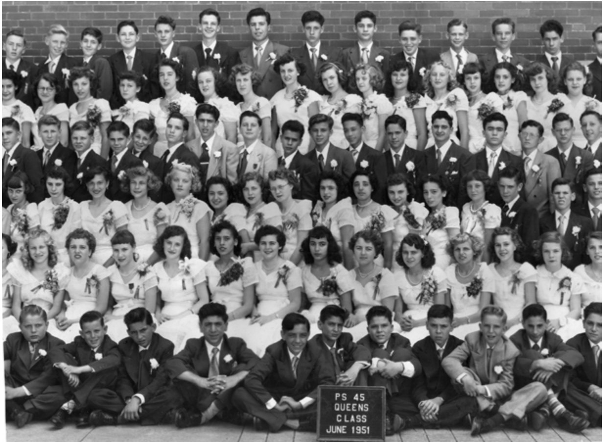
P.S. 45. 1951.

Alhool, New Yorgi Public School 45, Queensi klassilõpetamise pilt 1951. Aire kolmandas reas keskel prillidega.