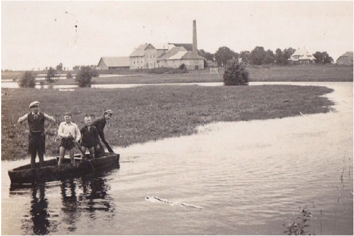
The simple pleasures of childhood