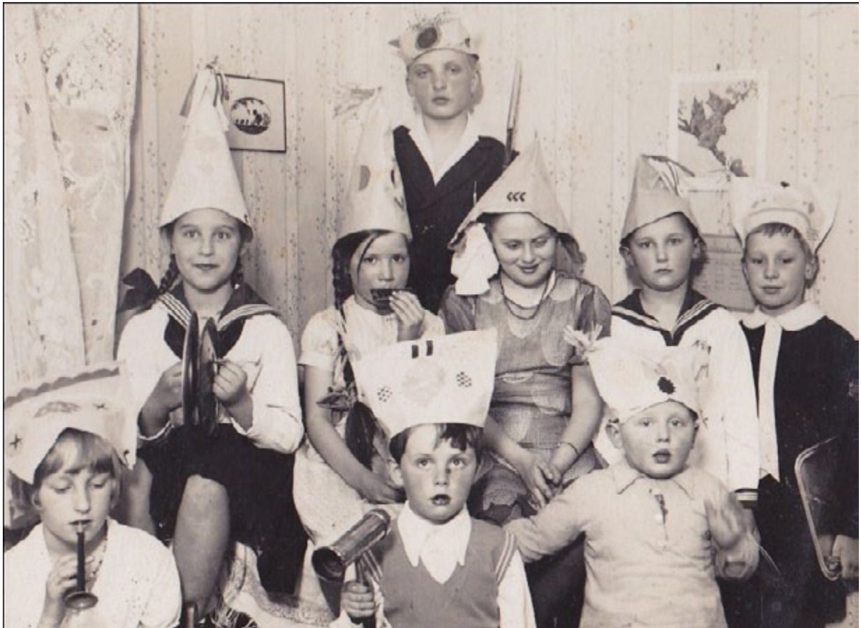
Family birthday party ca. 1928