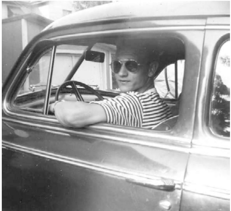
My father let me drive his car often