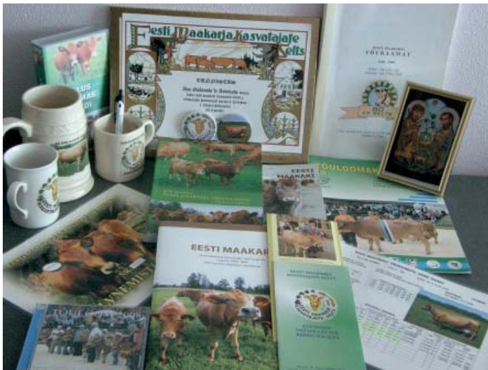
EK Seltsi atribuutika (K. Kalamees)

Maatõugu on tutvustatud erinevatel näitustel (Luigel, Säreveres, Saaremaal Upal ja Ülenurmel). Kahel viimasel aastal on maatõugu esitletud veel C. R. Jakobsoni Talumuuseumis augustikuisel eesti hobuse ja eesti maakarja päeval. Upa näitusel korraldatakse Saarte vissi ja Ülenurmel eesti maatõu vissi konkurss.