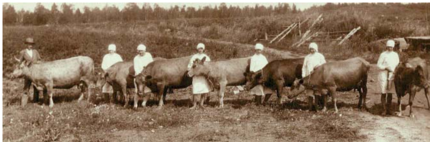
Luha talu maatõu rühm näitusel 1925. a

maakarja riiklikku tõulava ei asutatud. Riiklike majandite üksikud maatõugu loomad koondati Päriverve sovhoosi, millest kujunes aastateks 1950–1990 eesti maatõu aretus- ja säilituskeskus.