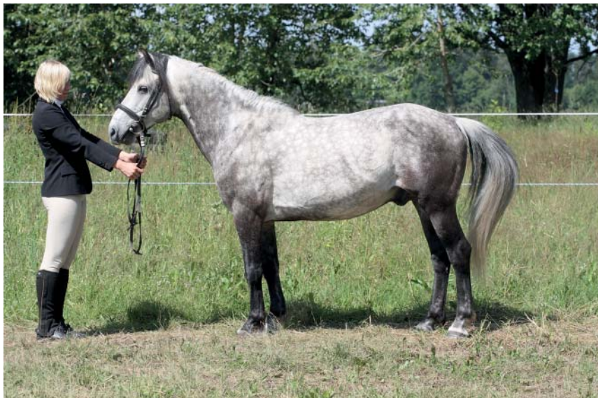
Eesti hobuse tõugu täkk Aksel 722 E (K. Sepp)

2010. aastal kinnitati Eesti Hobusekasvatajate Seltsi üldkoosolekul eesti hobuse säilitus- ja aretusprogramm aastateks 2011–2020. Programmi eesmärk on tagada eesti hobuse genofondi ja geneetilise mitmekesisuse säilimine, populatsiooni suurenemine ning leviala laienemine. Tõug peab säilima puhasaretuse teel, sobiva välimiku ja põlvnemise ning mitmekesise töövõimega.