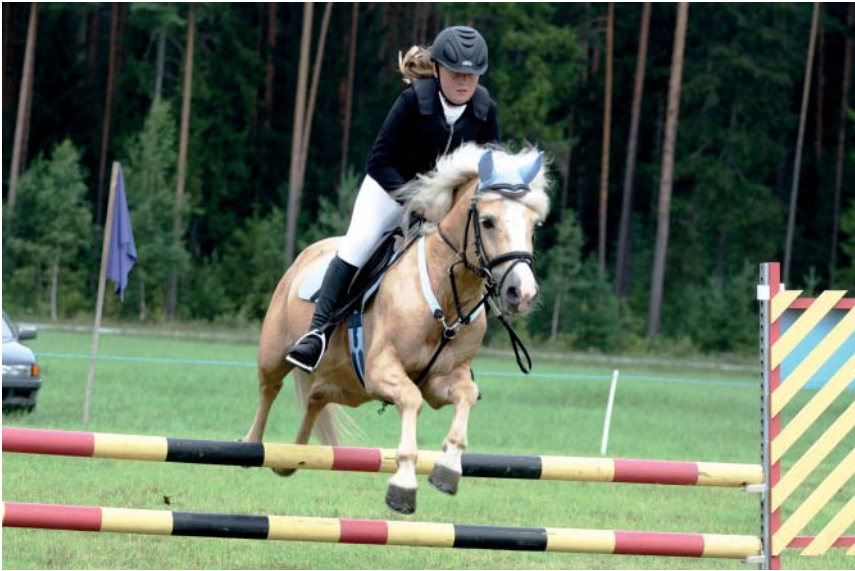
Eesti hobuse tõugu täkk Romeo 734 E ja Maian Keskiüll takistussõidus (K. Sepp)

Alates 2011. aastast korraldab Eesti Hobusekasvatajate Selts Carl Robert Jakobsoni talumuuseumis Kurgjal eesti hobuse päeva, kus lisaks tõuhobuste näitusele koolitatakse eesti hobuse kasvatajaid, võistlusareenil toimub aga eesti hobustega kooli-, takistus- ja rakendisõidud.