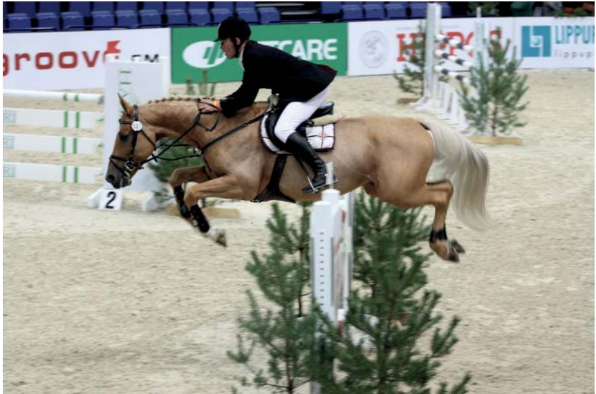
Tori tõugu täkk Opaal 13 697 T ületas 215 cm tõkke (K. Sepp)

Universaalse tüübi, hea lihastiku ja korrapärase välimikuga tori hobune tunnustati 1952. aastal N. Liidus parandajatõuks, mistõttu oli 1960.–1970. aastatel tori hobuse kasvatamise eesmärk seotud hobuste müügiga N. Liitu. 1990. aastatel, pärast Eesti taasiseseisvumist, lõpetasid paljud tori hobuste tõufarmid tegevuse, hobused erastati põllumajandusreformi käigus ja aretustöö põhiraskus kandus erasektorisse. Vastavalt turunõuetele tekkis vajadus ratsatüübiliste tori hobuste järele.