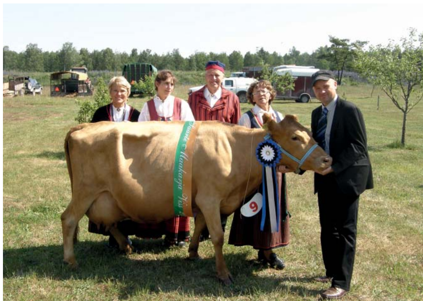
Neljakordne (2002, 2003, 2004, 2008) Saarte Viss Ürdi (P. Kalamees)