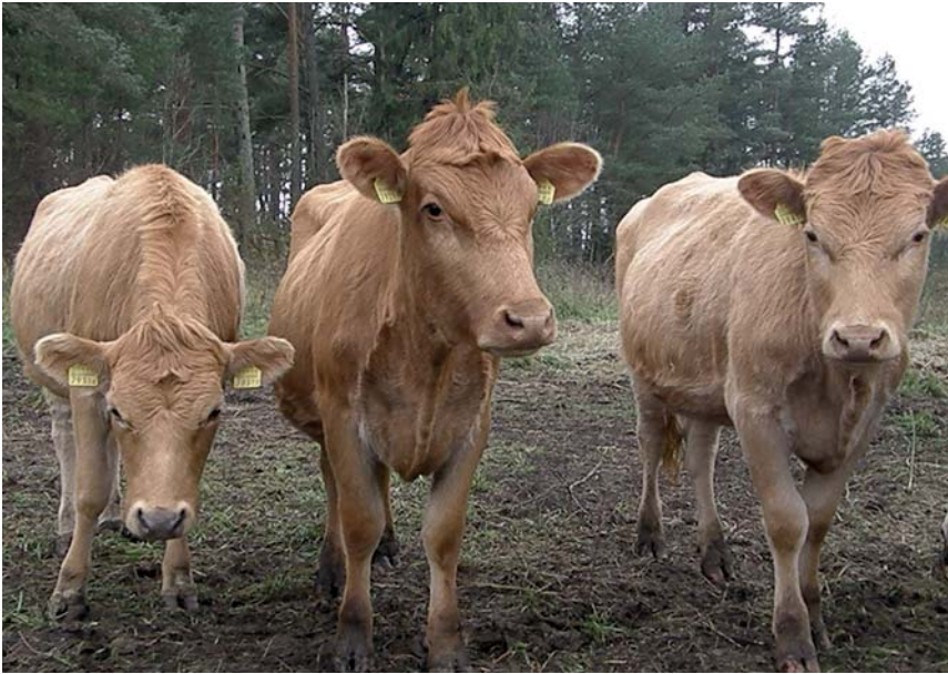
Ants Aamani eliittõufarmi noorkari (K. Kalamees)

• Söötmisskatsed Põlula katsefarmis näitasid, et eesti maatõu geneetiline potentsiaal avaldub heades söötmingimustes üllatavalt hästi, nad lüpsavad juba esimesel laktatsioonil 6000–8500 kg piima. Rekordtoodangu lüpsis Põlulas lehm Uuni teisel laktatsioonil: 305 päevaga 9502 kg, päevalüps 42,7 kg. Nüüdseks on rekordtoodangu, 10 696 kg piima, viinud uuele tasemele Sadala Piim OÜ-le kuuluv lehm Aafrika, kelle suurem päevalüps oli 50,3 kg. Samuti on Massiaru POÜ Lillik ületanud juba kahel laktatsioonil 10 000 kg toodangu: 3. laktatsioonil 10 126 kg ja 5. laktatsioonil 10 393 kg piima.