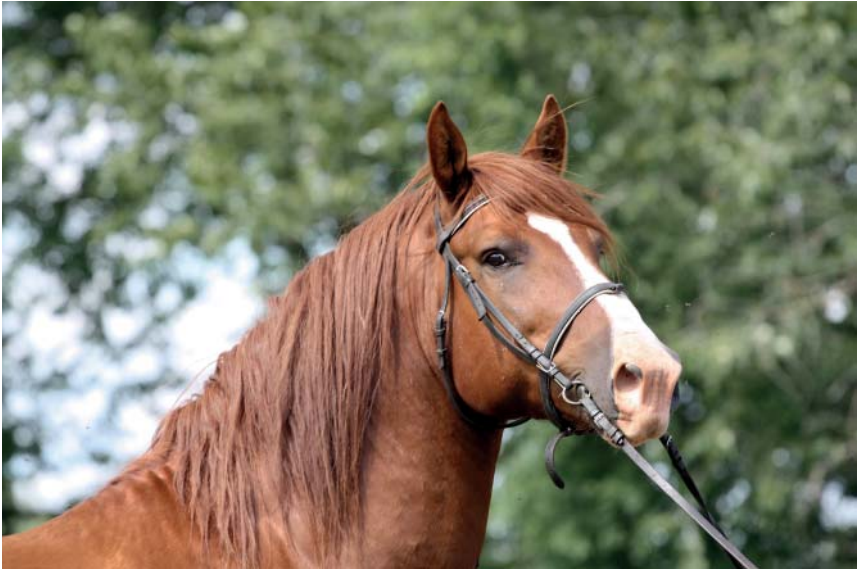
Tori tõugu täkk Hoius-Hatiitos 13 775 T (K. Sepp)