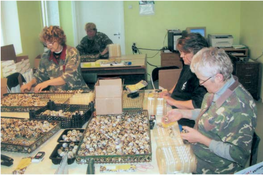
Munade sorteerimine Järveotsa vutifarmis (H. Tikk)

misperioodi jooksul – noortel, munemist alustavatel vuttidel moodustas see vaid 69% munemise lõpetanud lindude kehamassist. Vuttide kehamassi ja nende munatoodangu vaheliste seoste uurimisel ei ole uurijad jõudnud ühesugustele seisukohtadele, sest vuttidega tehtud katsetes on kasutatud erinevat geneetilist materjali, katselindude söötmis-pidamistingimused on olnud erinevad (Minvielle, Oguz, 2002). Eesti emasvuttide kehamass oli munemise algul keskmiselt 175–180 g. Aastaga suurenes nende kehamass 254–260 grammini (vastavalt muna- ja lihatüübilistel lindudel). Peab märkima, et kehamass varieerub rohkem lihatüübilistel vuttidel, suurimate emasvuttide kehamass ulatus munemisperioodi lõpuks kuni 362 grammini.