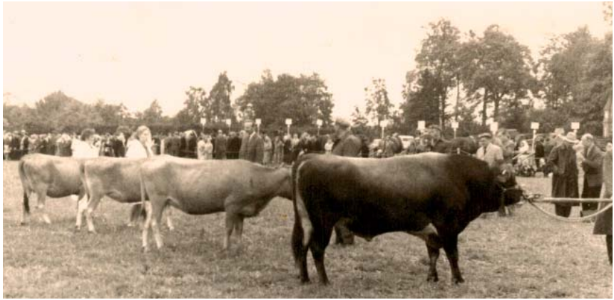
Pärivere maatõu lehmikud koos Tori seemendusjaama pulli Edelslundiga Tori näitusel 1965. a

Verevärskenduseks soetati kaks rootsi punase nudi tõu pulli: 1992. a Frippe ja 1997. a Quatro. Mõlemalt pullilt varuti spermat maatõu aretustööks. Nende järglased on maatõu tüübilised ja nudid.