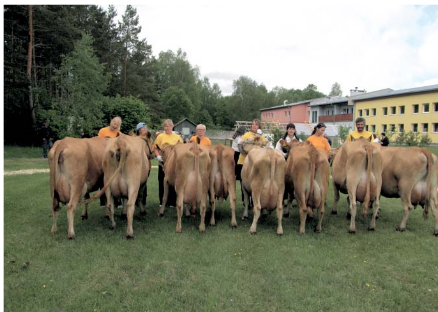
Maatõu esindus Saarte vissi konkursil 06.06.2012. a