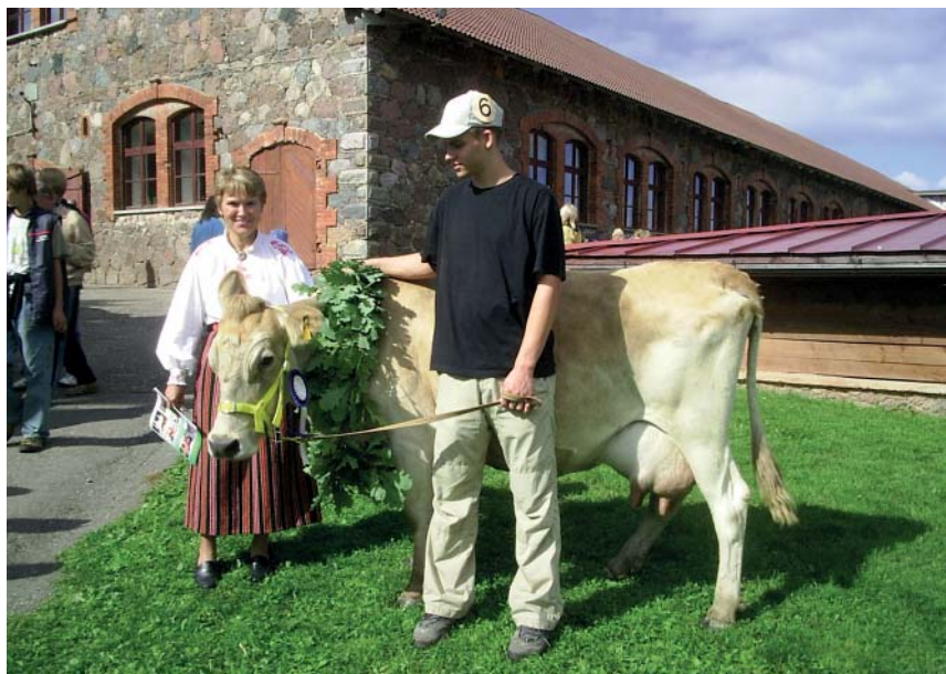
Eesti Maatõu Viss 2003 ja 2004 Niiu Ülenurme näitusel (H. Hiis)