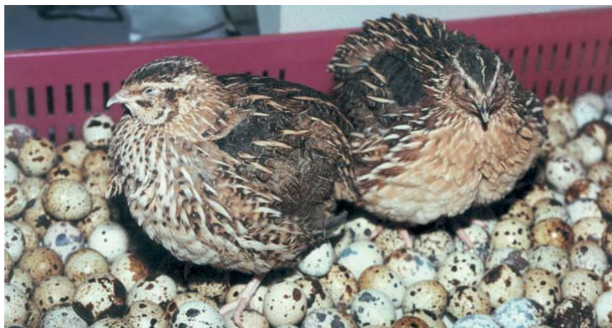
Emas- ja isasvutt (O. Tikk)

varieerub heleroosast kuni kollakashallini. Nokk on mustjaspruun, heledama otsaga. Kloaagi ümbruses on nahk roosaka varjundiga.