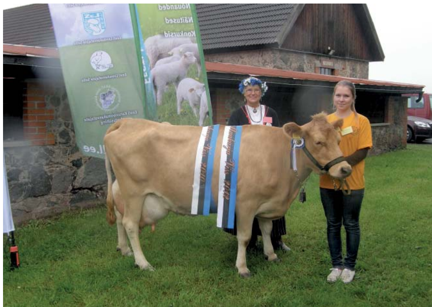
Eesti Maatõu Viss 2012 Pipi (M. Kalamees)