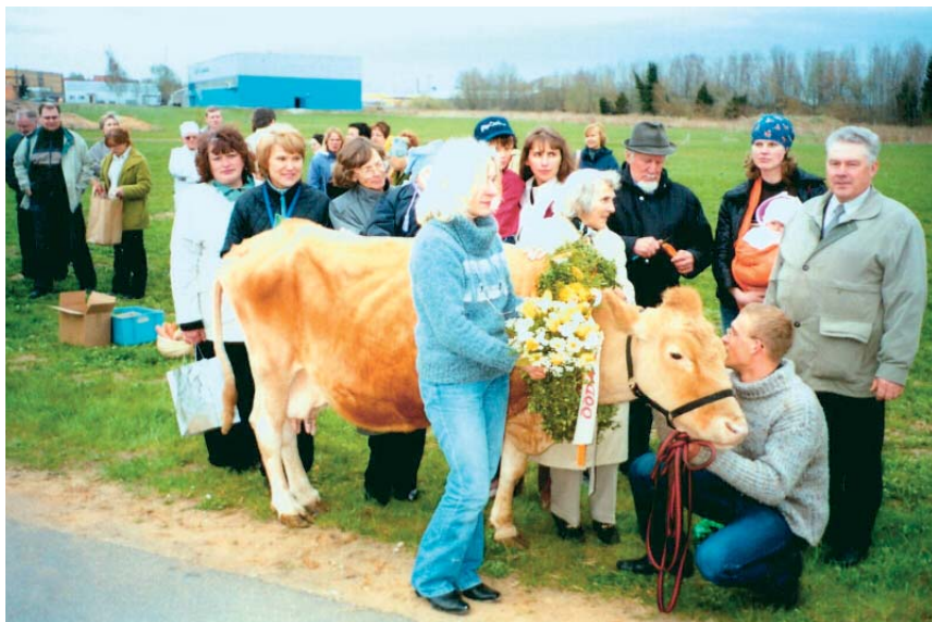
EK Seltsi juhatus Tartus maaülikooli suurloomakliiniku ees Õõda 23. sünnipäeval 10.05.2005. a

Iseloomult on eesti maatõugu veis sõbralik, uudishimulik, kuid isepäine, tugeva karjainstinktiga. Teiste piimaveisetõugudega koospidamisel on ta sageli karja juhiks. Ohu korral (hundid, koerad) võtavad maatõugu veised ringkaitseks ja peletavad ohuallika eemale. Sööda suhtes on nad valivad ja seetõttu esineb vähem ka ainevahetushaigusi. Tüüpilisteks omadusteks on veel vähenõudlikkus, haigustele vastupidavus (nakkushaigused, jalgade haigused), kerge poegimine ja sobivus tavalistesse söötmissidamistingimustesse ning pikaelasticus. Eesti vanim lehm Õõda (sünd 10.05.1982) elas oma viimase eluaasta Eesti maaülikooli suurloomakliinikus ja suri 29.12.2005. a 23 aasta 7 kuu vanusena.