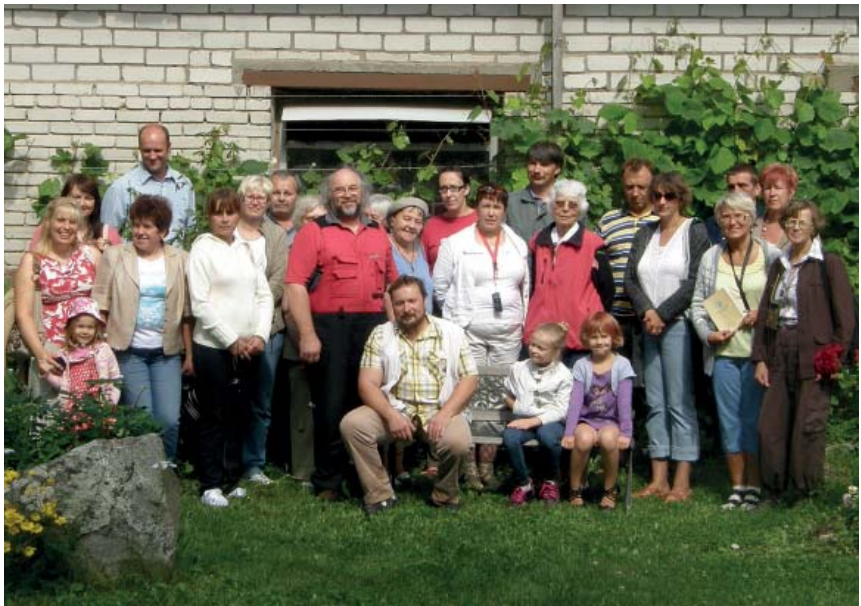
Seltsi liikmed 2012. a suvepäevadel (M. Kalamees)

Piima hea laapuvus on vajalik kvaliteetse juustu saamiseks. Juustu- tootmise põhireegel on, et 10 liitrist toorpiimast saab 1 kg juustu, kusjuures tuleb kasutada veel mitmesuguseid lisandeid õige konsistentsi saamiseks. Katsetused Eesti Maaviljeluse Instituudi Saku mikrobioloogialaboris (1998. a) näitasid, et maatõugu lehma üheksast liitrist piimast saadi lisandeid kasutamata 1,165 kg juustu.