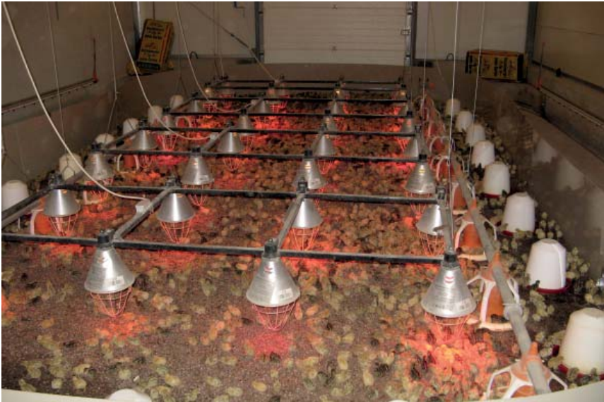
Mõnepäevased vutitibud infrapunaste soojenduslampide all