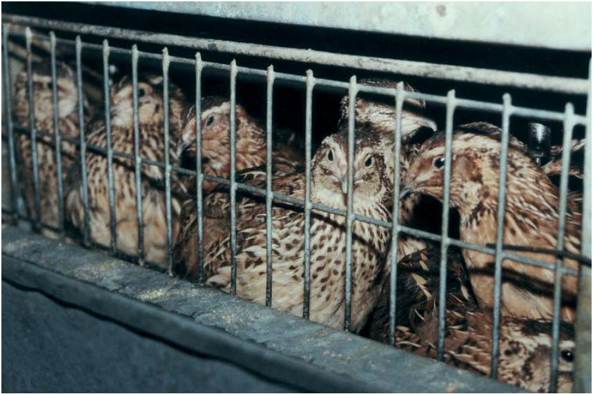
Farmivutid Eestis (O. Tikk)

pas ja Lähis-Ida riikides hakati vutte kasvatama 1930–1950. Tänapäeval kasvatatakse Jaapanis rohkem munavutte, Hispaanias ja Prantsusmaal rohkem lihavutte, vähe peetakse vutte Saksamaal, Suurbritannias ja Hollandis.